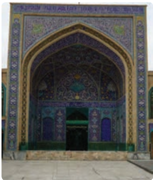
شکل ۳-۴- مرقد مطهر یحیی بن موسی بن جعفر (ع) در شهر سمنان