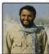
شهید سردار... امینیان مسئول جهادسازگی آل سید