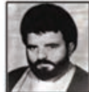
شهید سید احمد لوی فرمانده سپاه پاسداران