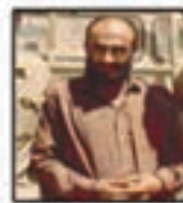
شهید حاج برنسی نائینی فرمانده پدافند جنگ جبهه جوار کربلا