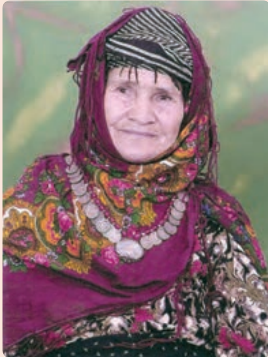
شکل ۳-۵- پوشش لباس زنان عشایر الیکایی در شهرستان گرمسار