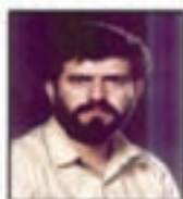
شهید سید حسن تکلیفانی نماینده مجلس و منطقه امام فر روزنامه کیهان