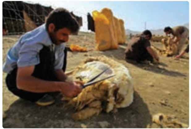
شکل ۳-۳- شیوه های همیاری در استان