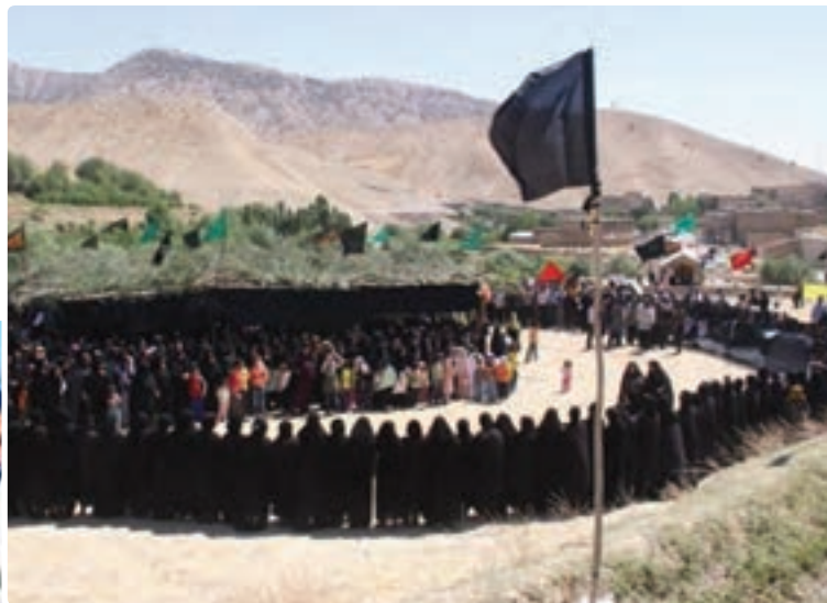
شکل ۳-۴- مراسم سنتی چه مه ر