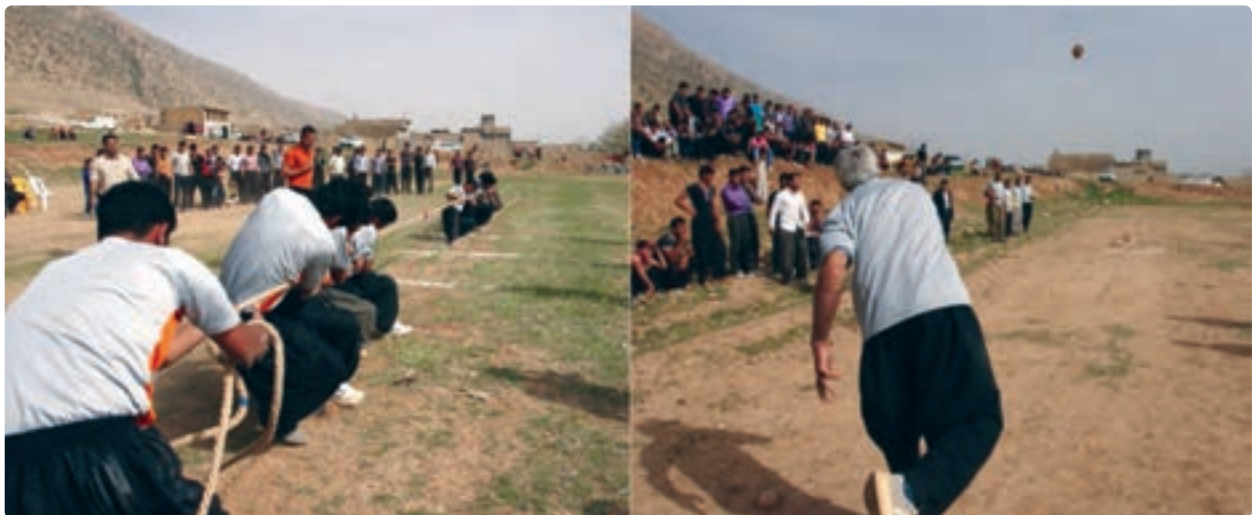
شکل ۵-۳- بازی‌های محلی در استان