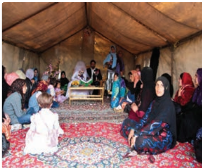
شکل ۲-۳- مراسم عروسی سنتی