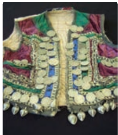
شکل ۳-۶- انواع لباس‌های محلی استان