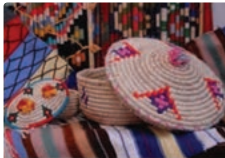
شکل ۳-۷- برخی صنایع دستی استان