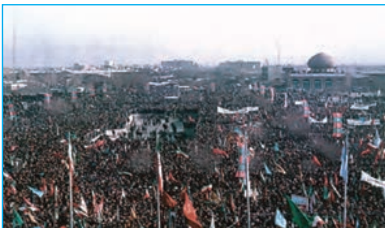
شکل ۲۸-۴- صحنه‌ای از اعزام رزمندگان به جبهه‌ها در دوران دفاع مقدس

اگر حمزه سیدالشهداء در جنگ‌های صدر اسلام، مدافع اسلام و آرمان‌های رسول خدا بود، تا پای جان از اسلام دفاع نمود و در جنگ احد عاشقانه به شهادت رسید، لشکر ۲۱ حمزه آذربایجان نیز همراه با افراد غیور و شجاع و خلبانان تیزپرواز پایگاه دوم شکاری تبریز، از آغاز جنگ تحمیلی و دفاع مقدس، در جبهه‌های حق علیه باطل با دشمن بعثی نبرد کردند. امیران و فرماندهان رشید و از جان گذشته و غیور مردان این لشکر سرافراز آذربایجان با جان فشانی‌ها و حماسه‌سازی‌های خود چهره ایران و ایرانی را در پیشگاه تاریخ و اجداد سلحشور خود سفید کردند. حملات خلبانان متهور پایگاه دوم شکاری آذربایجان به عمق خاک و استحکامات دشمن و بمباران مراکز حیاتی، نظامی و صنعتی عراق، فرماندهان آن کشور که خواب تصرف تهران را دیده بودند به زانو درآوردند. لشکر سرافراز ۲۱ حمزه و پایگاه دوم شکاری تبریز با پایداری خود در مقابل دشمن خسارات و تلفات سنگینی بر آنها وارد کردند. این پایگاه افسران و سربازان و امرای شهیدی چون سرلشکر شهید فکوری را تقدیم اسلام و ایران نمودند. نامشان جاودانه تاریخ پرافتخار گلگون کفن ارتش ایران اسلامی باد.