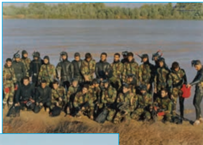
شکل ۳۰-۴- رزمندگان استان در ساحل اروندرود