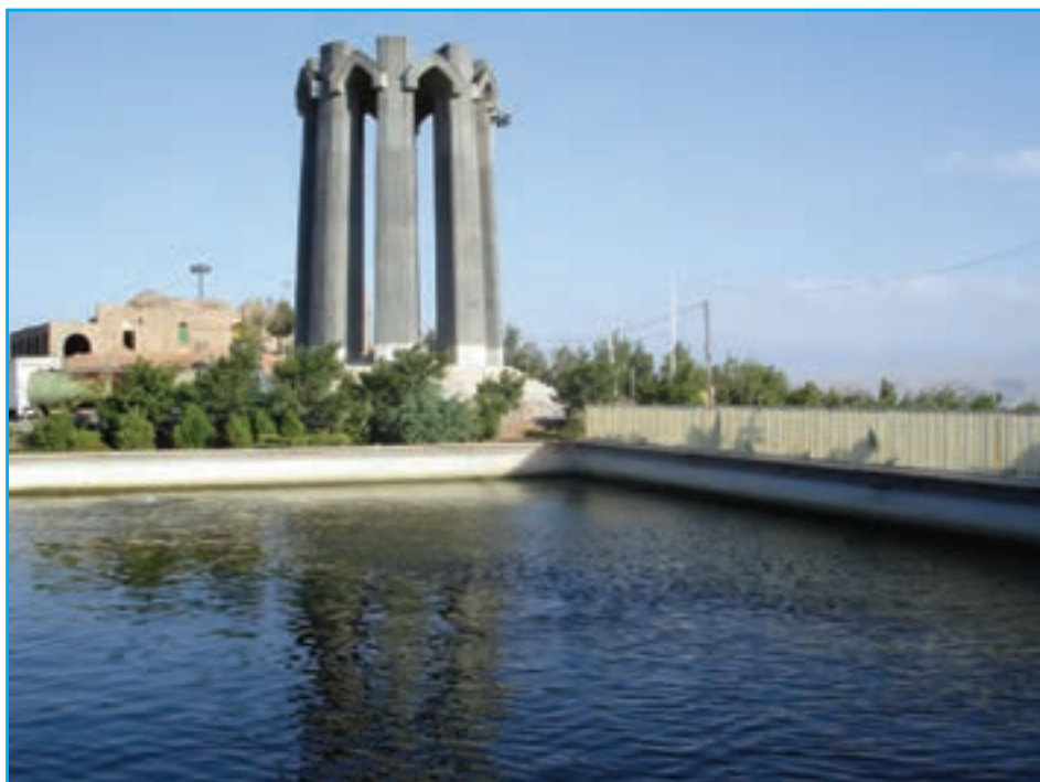
شکل ۲۷-۴. یادبود شهدای گمنام واقع در کنار امام‌زاده عون‌بن علی تبریز

ملت آذربایجان همواره در طول تاریخ با فداکاری‌ها و نثار خون خویش مدافع ایران و اسلام بوده‌اند و در جنگ تحمیلی در هشت سال دفاع مقدس نقش مهمی را ایفا نمودند. لشکر سرفراز ۳۱ عاشورا از رزمندگان دلاور و سرداران رشید آذربایجان تشکیل شده بود که در طول جنگ تحمیلی لرزه بر اندام دشمن بعثی و پشتیبانان جهان‌خوار آنها می‌انداختند. حماسه آفرینی‌های رزمندگان و سرداران لشکر ۳۱ عاشورا در جنگ تحمیلی «تیترا» اول روزنامه‌ها و سرفصل اخبار رادیوهای بیگانه بود. حملات اعجاب انگیز و خط شکنی‌های متهورانه رزمندگان آن لشکر سرفراز، موجب تعجب ناظران سیاسی و مفسران نظامی اروپا و آمریکا می‌شد. سرداران بزرگی چون شهید مهندس مهدی باکری و برادرش شهید مهندس حمید باکری، شهید علی تجلایی، شهید مرتضی باغچیان و شهید حسن شفیع زاده از نامی‌ترین و پرافتخارترین سرداران این استان بودند که حیات پراج خود را عاشقانه در طبق اخلاص نهاده و تقدیم انقلاب و اسلام و ایران نمودند و اوراق زرین دیگری بر کتاب افتخارات ملت آذربایجان، افزودند. روانشان شاد و یادشان جاودانه باد.