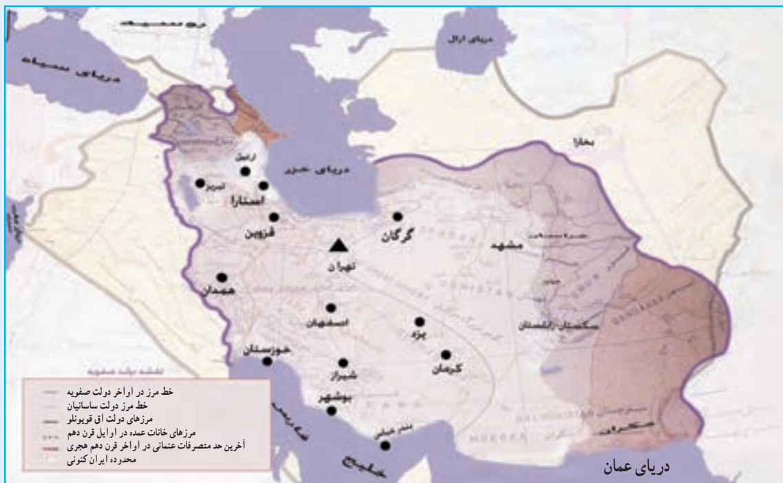
شکل ۲۰-۴- نقشه ایران در دوره صفویه که در آن تبریز به عنوان اولین پایتخت جهان تشیع محسوب می‌شد.

قاجاریه در سال ۱۳۰۴ ه. ش ادامه داشت. در جنگ‌های ایران و روسیه، (۱۲۱۸-۱۲۴۳ ه. ق) آذربایجان اهمیت سیاسی و نظامی فراوانی داشت. مردم آذربایجان با دادن کشته‌های زیاد از این آب و خاک دفاع کردند و در جریان جنگ‌های دوره اول و دوم ایران و روسیه علاوه بر شهرنشینان و روستاییان، عشایر آذربایجان نیز نقش عمده‌ای داشتند. این ایالت بعد از شکست قشون ایران، از قوای روسیه در سال ۱۲۴۳ ه. ق به وسیله نیروهای روسی اشغال شد و بعد از پذیرش عهدنامه ترکمن‌چای و از دست دادن مناطق شمالی رود ارس، از قوای بیگانه تخلیه گردید. در نهضت تنباکو اعتراض از آذربایجان و شهر تبریز آغاز شد و در جریان انقلاب مشروطه در سال ۱۳۲۴ ه. ق آذربایجان از ایالات پرچمدار آزادی بود و تبریز از شهرهای پیشگام در انقلاب و مرکز فعالیت آزادی خواهان مشروطه طلب محسوب می‌شد. پس از مرگ مظفرالدین شاه و اعلان سلطنت محمد علی شاه، تبریزی‌ها، با توجه به شناختی که در دوران ولیعهدی از او داشتند، به سلطنت وی روی خوش نشان ندادند. لذا پس از به توپ بستن مجلس اول در سال ۱۳۲۶ ه. ق به وسیله محمد علی شاه و آغاز دوره استبداد صغیر، تبریز مرکز مقاومت ملی علیه شاه مستبد شد. ستارخان و باقرخان دو تن از سرداران غیور آذربایجان، با کمک مردم و علمای آزادی خواه آذربایجان مدت ۱۱ ماه در مقابل نیروهای دولتی مقاومت کردند و با برکناری پادشاه مستبد از سلطنت در سال ۱۳۲۷ ه. ق دوباره نظام مشروطه را برقرار نمودند.