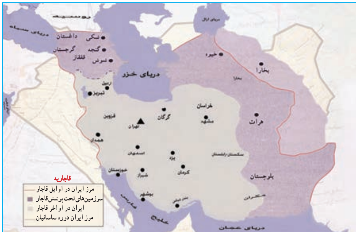
شکل ۲۱-۴ نقشه ایران در اوایل قاجاریه که در آن آذربایجان مرکز فرماندهی جنگ‌های ایران و روس بود