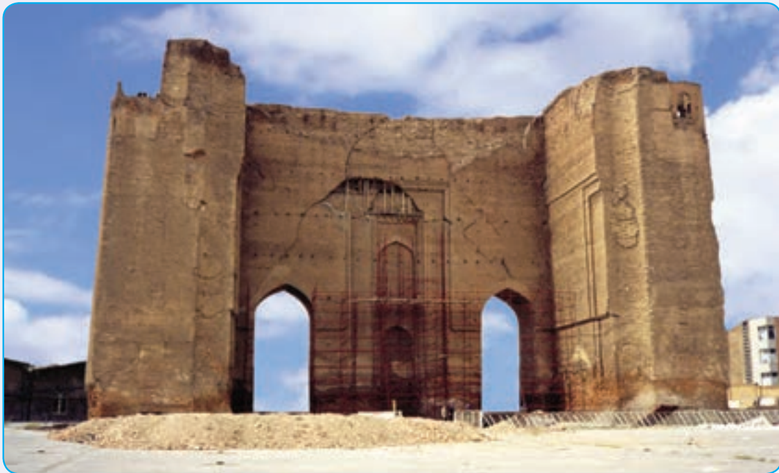
شکل ۱۳-۴- ارگ علیشاه از آثار دوره مغول

ربع رشیدی به عنوان بزرگ ترین دانشگاه جهان اسلام در قرون ۷- ۸ هـ. ق شناخته می شد.