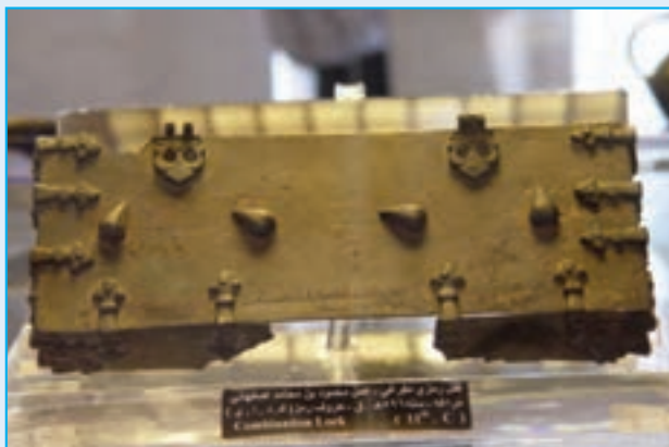
شکل ۲-۴- قفل رمزخوان اثری متعلق به قرن ششم ه.ق - عجب‌شیر

شده بودند. بعد از اتحاد با دولت «ماننا» دولت آشور را شکست دادند و نخستین دولت آریایی را به رهبری «دیا اکو» (۷۰۱ یا ۷۰۸-۶۵۵) ایجاد کردند و به این خاطر آذربایجان را کشور «ماد» می‌گفتند.