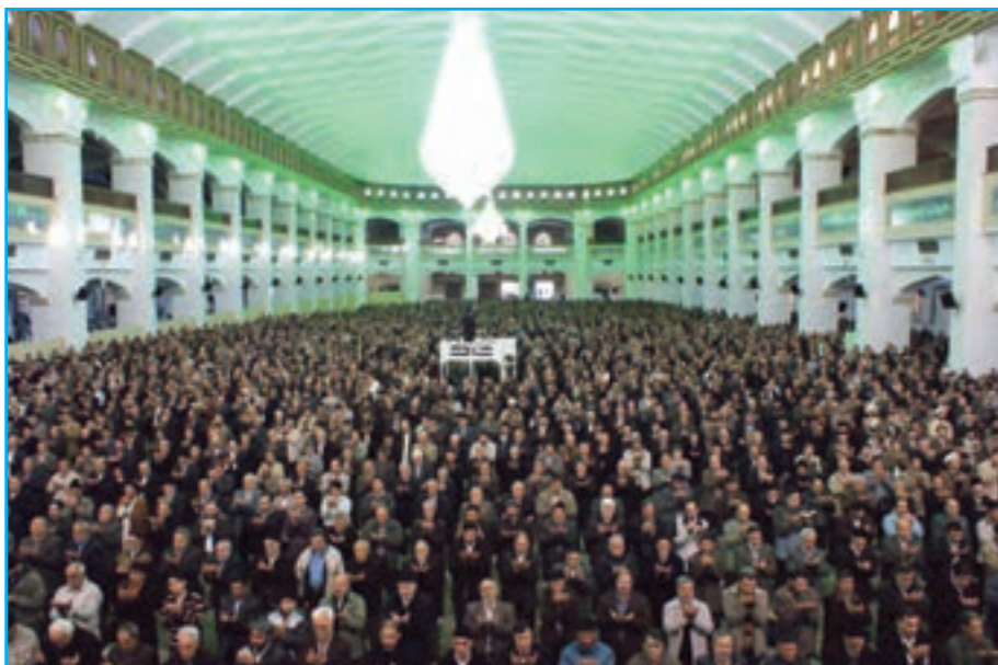
شکل ۲۵-۴- برگزاری پرشکوه نماز جمعه در مصلائی امام خمینی (ره) - تبریز

تلاش انقلابی مردم آذربایجان بعد از پیروزی انقلاب اسلامی تا به امروز گواه روشن، بر حمایت بی دریغ مردم آذربایجان از آرمان‌های مقدس انقلاب اسلامی ایران به رهبری حضرت امام (ره) و آیت‌الله خامنه‌ای است. در جریان هشت سال دفاع مقدس، جوانان غیور و باایمان آذری حمایت بی چون و چرای خود را از اسلام و انقلاب به نمایش گذاشتند. اقدامات ایثارگرانه مردم آذربایجان