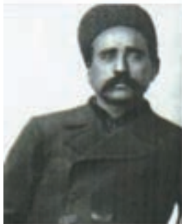
ستارخان سردار ملی