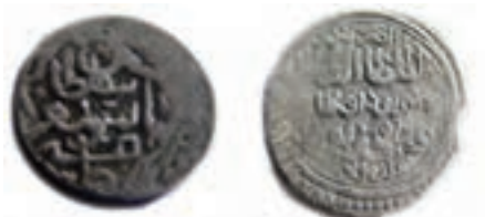
شکل ۱۶-۴- سکه‌های متعلق به دوران آق قویونلوها

اوزون حسن بنیان گذار دولت آق قویونلوها بود. او تبریز را پایتخت خود قرار داد و قلمرو خود را تا بغداد و هرات توسعه داد. بعد از مرگ او فرزندش سلطان یعقوب به سلطنت رسید اما او در جوانی از دنیا رفت و با مرگ یعقوب دولت آق قویونلوها در آذربایجان فروپاشید. مدرسه دینی «نصریه» و مسجد «حسن پادشاه» واقع در خیابان دارایی جدید تبریز از آثار آنها است.