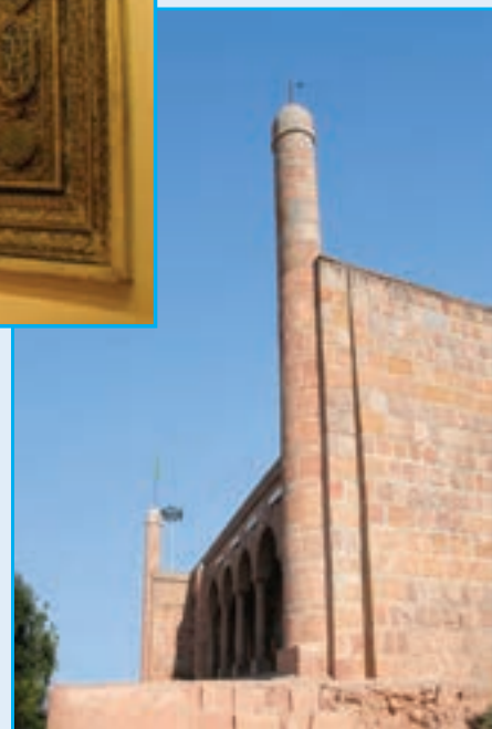
شکل ۱۹-۴- نمایی از امامزاده عون بن علی - قلعه عون بن علی مربوط به قرن هشتم و مرمت شده در دوره های بعدی