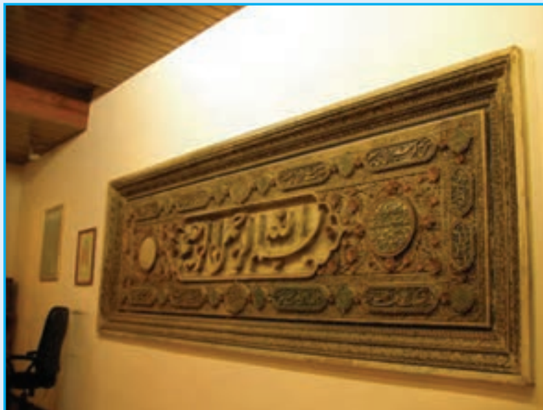
شکل ۱۸-۴- سنگ «بسم الله» - قرن دهم هجری

۶- دوره قاجاریه : در زمان سلطنت فتحعلی شاه قاجار، آذربایجان به دلیل همسایگی با دو کشور بزرگ روسیه و عثمانی، از اهمیت فراوانی برخوردار بود. به همین جهت شهر تبریز ولیعهد نشین شد. این سنت تا انقراض