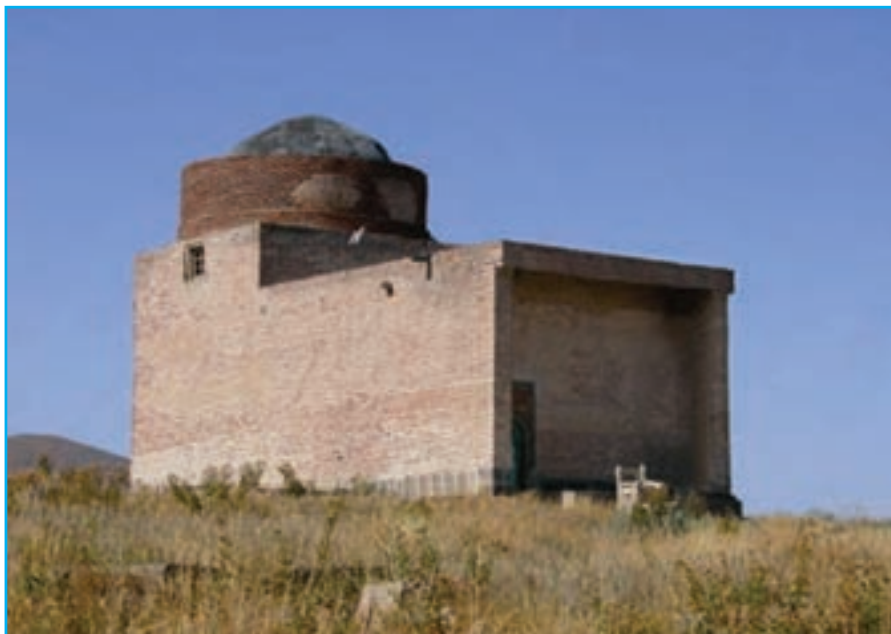
شکل ۱۲-۴- مقبره شیخ اسحق هریس- دوره صفوی ۹۹۰ ه.ق