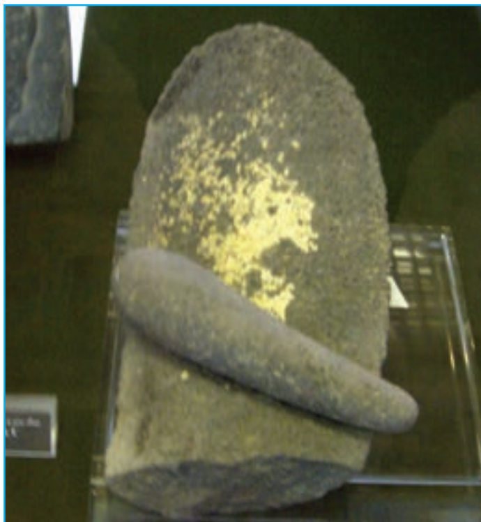
شکل ۳-۴. سنگ ساب مربوط به هزاره سوم ق.م. — خدا آفرین