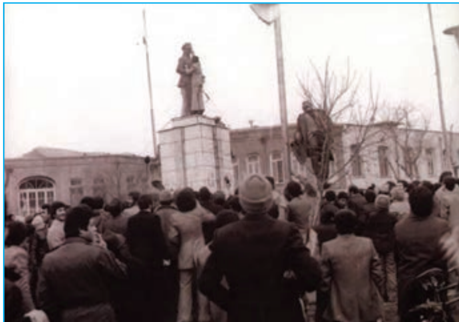
شکل ۲۴-۴- تخریب مجسمه شاه توسط مردم غیور تبریز در ۲۶ دی ماه ۱۳۵۷- روز فرار شاه (میدان ساعت تبریز)

تلاش انقلابی مردم آذربایجان بعد از پیروزی انقلاب اسلامی تا به امروز گواه روشن، بر حمایت بی دریغ مردم آذربایجان از آرمان‌های مقدس انقلاب اسلامی ایران به رهبری حضرت امام (ره) و آیت‌الله خامنه‌ای است. در جریان هشت سال دفاع مقدس، جوانان غیور و باایمان آذری حمایت بی چون و چرای خود را از اسلام و انقلاب به نمایش گذاشتند. اقدامات ایثارگرانه مردم آذربایجان