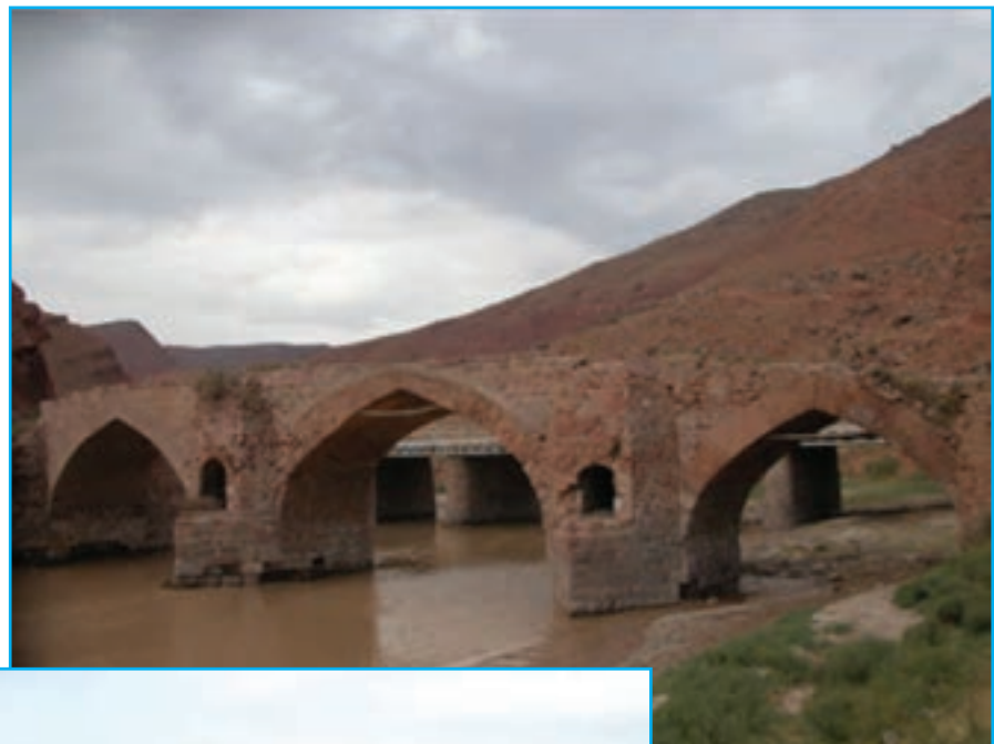
شکل ۷-۴- پل و نیار - شهرستان تبریز انری متعلق به دوران معاصر

کشته شد، والی آذربایجان بود. در عهد بنی عباس نیز ابو جعفر منصور دوانیقی دومین خلیفه عباسی و یحیی بن خالد برمکی وزیر معروف ایرانی، از والیان معروف آذربایجان بودند. در سال ۱۹۲ فرقه خرم‌دینان در این ناحیه علیه خلفای غاصب و ستمگر عباسی به رهبری جاویدان بن سهلک سر به شورش برداشتند. این قیام بعد از مرگ او به رهبری بابک خرم‌دین ادامه یافت. عاقبت این قیام در دوره خلافت معتصم هشتمین خلیفه ستمگر عباسی به وسیله افسین سردار دیگر ایرانی که در خدمت عباسیان بود، سرکوب شد. بابک اسیر گردید و در سال ۲۲۳ هـ. ق در بغداد به دار آویخته شد. در زیر نمونه‌هایی از بناهای تاریخی متعلق به دوره اسلامی آمده است.