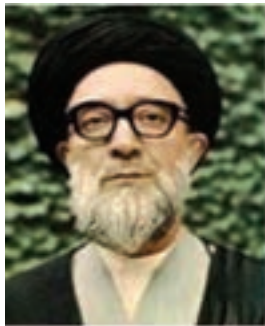
شهید قاضی طباطبایی