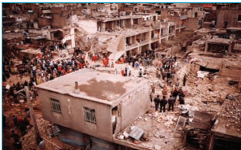
شکل ۲۹-۴- بمباران دبیرستان دخترانه زینبیه شهر میانه در جنگ تحمیلی عراق علیه ایران