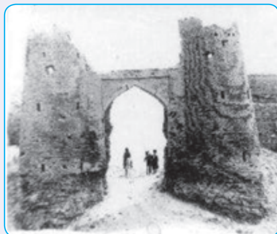
شکل ۱۴-۴- نمایی از ربع رشیدی اولین دانشگاه ایران در دوره مغول