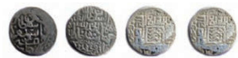
شکل ۱۷-۴- سکه‌های متعلق به دوران قرا قویونلوها