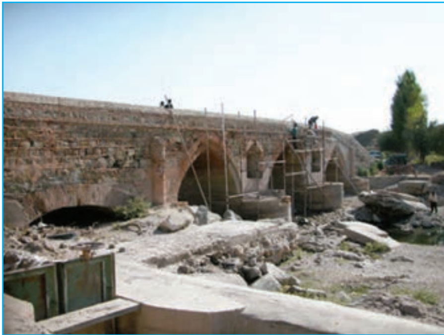
شکل ۱۱-۴- پل دختر- ملکان- دوره صفوی ۹۵۱ ه.ق