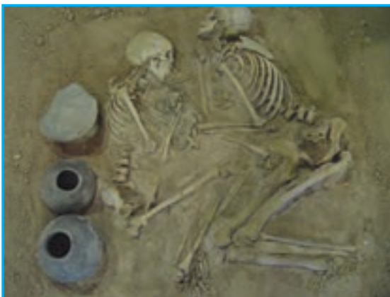
شکل ۲-۴- آثار مکشوفه هزاره اول ق.م در محل محوطه مسجد کبود

در جواب این سؤال که آذربایجان کی و چگونه محل سکونت شد و ساکنان اولیه آن از کدام اقوام بوده‌اند، اطلاع دقیقی در دست نیست. برخی از دانشمندان، با توجه به اشکال سفالینه‌های به دست آمده، در کاوش‌های باستان‌شناسی ساکنان اولیه آذربایجان را مردمی دامدار و از نژاد مدیترانه‌ای می‌دانند. در آغاز هزاره اول ق.م. دره آجی چای و ناحیه کنونی تبریز متعلق به قوم متمدن دالیان بوده است. کاوش‌های باستان‌شناسی در این منطقه کم‌انجام گرفته و مدارک قابل استناد در این زمینه بسیار ناچیز است. تپه‌های فراوان مکشوفه و غیرمکشوفه باستانی، سنگ‌نگاره‌های متعلق به پادشاهان اورارتی و وجود قبرستان‌های کلان‌سنگی در نقاط مختلف استان که به قبرهای «گور» معروف‌اند، بیانگر سکونت طولانی انسان در این استان است. از سویی آذربایجان در طول تاریخ، دالان جابه‌جایی اقوام از شرق به غرب و بالعکس بوده و نقش عمده‌ای در تبادلات فرهنگی اقوام گوناگون داشته است. در نتیجه کاوش‌های باستان‌شناسی سال‌های اخیر آثار فراوانی در جنوب شرقی استان به دست آمده که متعلق به عهد حجر قدیم است و قدمت تمدن آذربایجان را به هزاره چهارم ق.م می‌رساند.