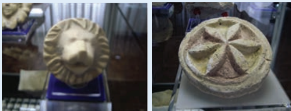
شکل ۶-۴- گنجبری‌های نقش خورشید و شیر آثاری متعلق به دوره اشکانی (قلعه ضحاک - اشکانی - هشترود)

به دست اسکندر مقدونی، خستریوان والی ماد، آتروپات (آذربد) فرمانده طلايه قشون داریوش سوم در جنگ گوگمل بود. بعضی‌ها او را مرد روحانی می‌دانند، او و بازماندگانش با تدبیر توانستند استقلال ماد و حاکمیت خاندان خود را تا سال ۲ ق.م حفظ کنند، در طول دوره‌ای نزدیک به هفت قرن فرمانروایی اشکانیان و ساسانیان، آذربایجان جزء جدایی ناپذیر ایران و از ایالات بسیار مهم این دو دولت محسوب می‌شده است. آذربایجان در عهد ساسانیان به دلیل استقرار پایتخت تابستانی آنها در شهر «شیز» ۱ یا «گنزک» ۲ و وجود آتشکده مقدس «آزرگشنسب» ۳ در این محل از تقدس خاص و اهمیت فوق‌العاده‌ای برخوردار بوده است.