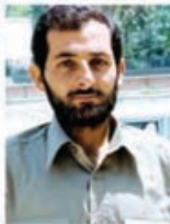
شهید مهدی باکری