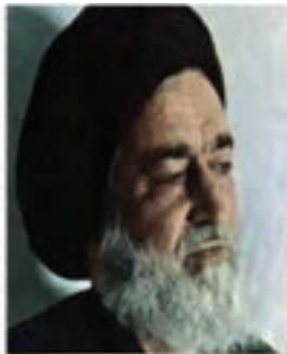
شهید آیت الله سید اسدالله مدنی