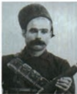
باقرخان سالار ملی