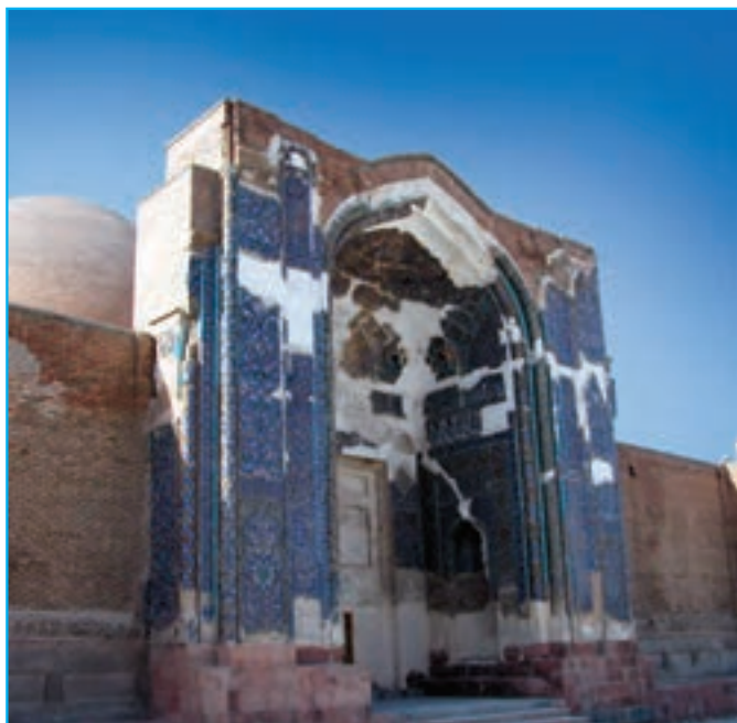
شکل ۱۵-۴- نمایی از مسجد کبود معروف به فیروزه اسلام متعلق به معماری قرن نهم هجری قمری

۴- عصر ترکمنان : با فروپاشی دولت تیموریان در آغاز قرن نهم اقوام ترکمن (آق. قویونلوها و قرا قویونلوها) در آذربایجان نیرومند شدند. در نتیجه مؤسس دودمان قرا قویونلوها قرایوسف در سال ۸۲۳ ه.ق در آذربایجان به قدرت رسید. وی تبریز را پایتخت خود قرار داد. پس از وفات او، فرزندش جهانشاه که مشهورترین پادشاه این دودمان است به سلطنت رسید. وی عاقبت در جنگ با اوزون حسن «آق قویونلو» در سال ۸۷۲ ه.ق به قتل رسید. پس از مرگ جهانشاه، دولت قرا قویونلوها در آذربایجان برچیده شد؛ مسجد کبود از آثار او است.