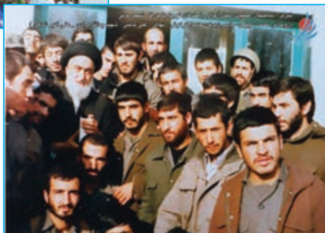
شکل ۲۶-۴- صحنه‌هایی از اعزام رزمندگان آذربایجان شرقی به جبهه‌ها در دوران دفاع مقدس