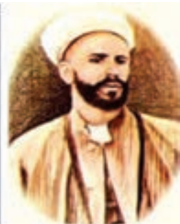
شیخ محمد خیابانی