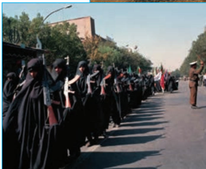
شکل ۳۱-۴- بسیج خواهران در استان