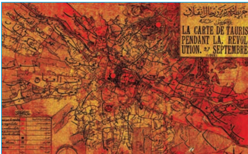
شکل ۲۲-۴- نقشه قدیمی تبریز در سال ۱۲۸۶ هجری شمسی

با دشمن تا آخرین نفس تأکید می‌کردند و عباس میرزا را به ادامه آن و عدم قبول شرایط روس‌ها تشویق می‌کردند. در این میان رفتار پیرزنی از زنان آذربایجانی از همه افتخارآمیزتر بود. این زن سالخورده با شنیدن خبر متارکه جنگ، از قیمت ریسمان دست تاب، مقداری لوازم جنگ و خواروبار برای سربازان تهیه کرده و به مقر فرماندهی عباس میرزا آورده بود تا در تجهیز سربازان وطن در مقابل دشمن سهمی داشته باشد.