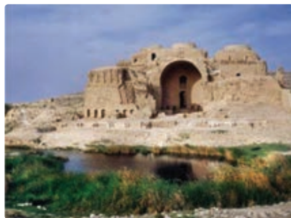
شکل ۲۲-۵- کاخ اردشیر - فیروز آباد