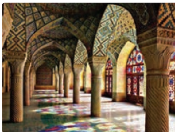
شکل ۲۱-۵- مسجد نصیرالملک - شیراز