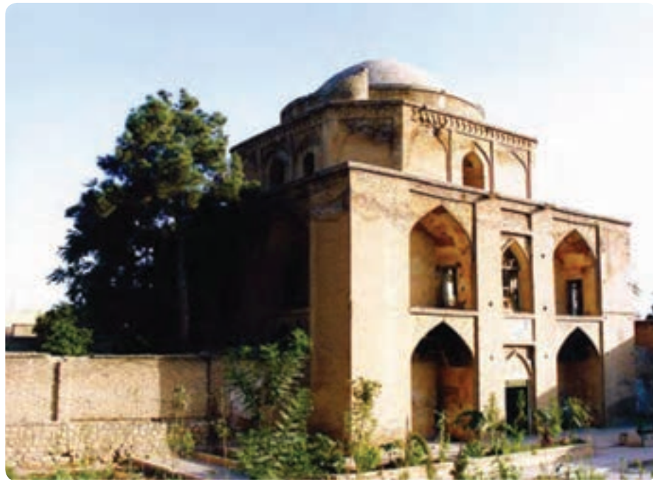
شکل ۵-۵- بی بی دختران شیراز

در کشور ما گام‌های نخست در توسعه این بخش برداشته شده است، به گونه‌ای که اکنون بیش از ۵۰ هزار نفر به‌طور مستقیم در زمینه گردشگری مشغول به کارند. از این تعداد در استان فارس در حال حاضر ۴۵۰۰ نفر در این صنعت شاغل‌اند. گردشگری و خودباوری: نهر، نخست‌وزیر هند در کتاب نگاهی به تاریخ جهان می‌نویسد: من هرگاه در برابر ایران و تمدن ایران قرار می‌گیرم، ناخودآگاه سر تعظیم فرود می‌آورم.