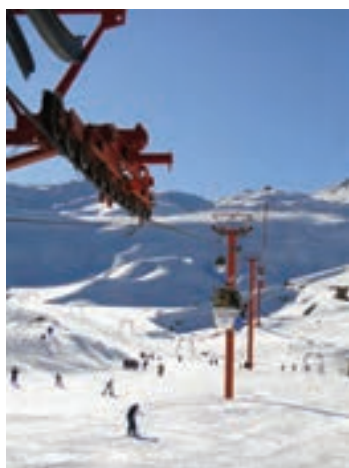
شکل ۱۸-۵- مجتمع بولاد کف