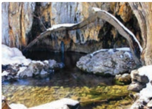
شکل ۱۹-۵- سرچشمه رودخانه شش پیر - سپیدان