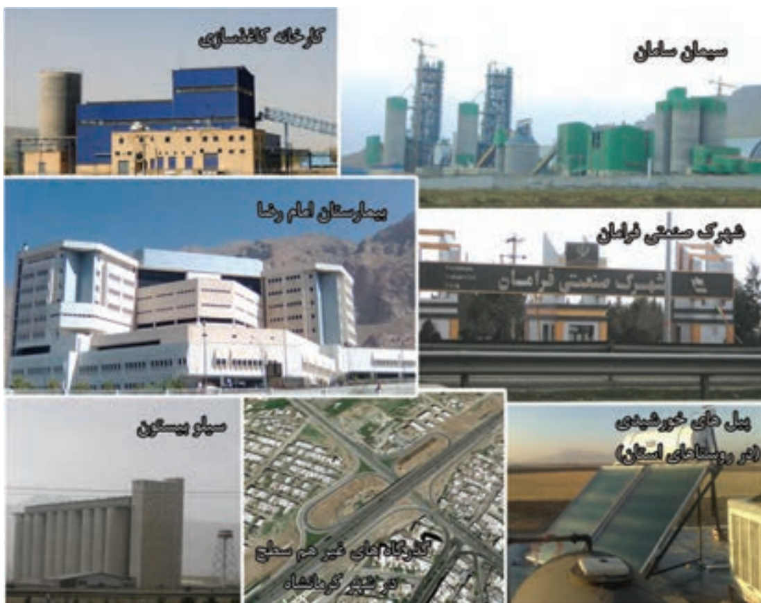
شکل ۴-۶- تصاویری از دستاوردهای استان کرمانشاه