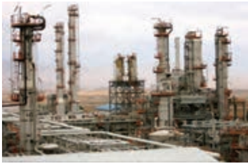
شکل ۲-۶- مجتمع پتروشیمی کرمانشاه