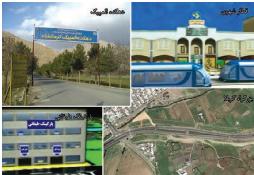
شکل ۸-۶- بخشی از چشم انداز استان کرمانشاه در بخش خدمات