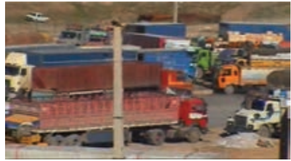
شکل ۱-۶- بازارچه مرزی پرویزخان

در دهه اول پس از انقلاب اسلامی، سرعت توسعه در بخش‌های زیربنایی و عمرانی استان کرمانشاه مانند دیگر استان‌های واقع در غرب کشورمان، به دلیل موقعیت مرزی و تأثیر مستقیم از جنگ تحمیلی، روند کندی داشت. اما در دهه‌های بعدی روند حرکت سرعت بیشتری یافته است. نمود این تحولات در استان را می‌توان در بخش‌های مختلف اقتصادی و زیربنایی مشاهده کرد. در این درس به‌طور گذرا مهم‌ترین این دستاوردها در بخش‌های مختلف بررسی می‌شود: