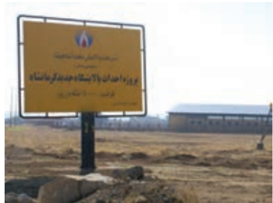
شکل ۶-۶- پالایشگاه نفت آنارهایتا کرمانشاه