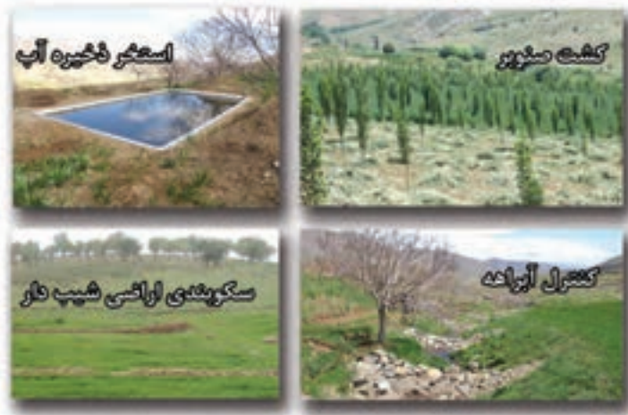
شکل ۵-۶- مهم ترین دستاوردهای بخش منابع طبیعی