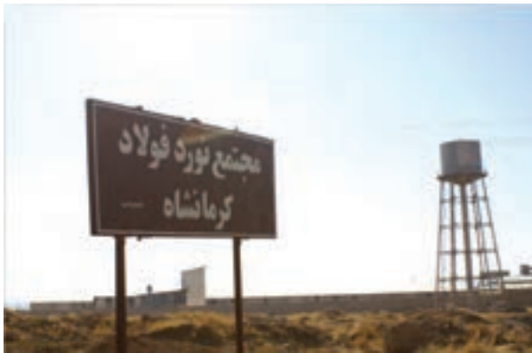
شکل ۷-۶- مجتمع نورد فولاد کرمانشاه