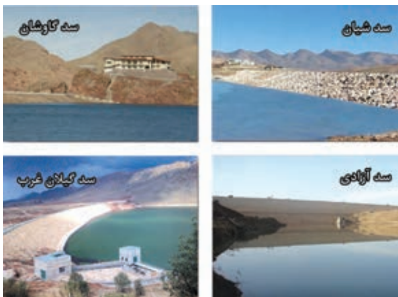
شکل ۳-۶- نمایی از برخی از سد های استان کرمانشاه