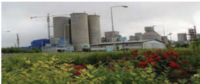
شکل ۱-۶- کارخانه سیمان آرتا اردبیل

پس از انقلاب شکوهمند اسلامی ایران نیز به علت مشکلات سیاسی مخصوصاً جنگ تحمیلی، تحول عمده‌ای در صنعت استان رخ نداد. اما پس از استان شدن اردبیل و با شروع برنامه اول توسعه اقتصادی، مسئولان منطقه در صدد توسعه صنعتی استان برآمدند و با تشکیل ادارات کل اقتصادی مخصوصاً اداره کل صنایع و معادن و شرکت شهرک‌های صنعتی، رغبت و علاقه برای سرمایه‌گذاری افزایش یافت به طوری که با راه اندازی واحدهای صنعتی بزرگ در کنار واحدهای صنعتی و معدنی کوچک، کارخانجاتی مانند: سیمان، لاستیک، خودرو، شیرخشک صنعتی، رنگ و ابزار آلات صنعتی، ریسندگی، پنبه پاک کنی، فولاد، نئوپان سازی، قطعات خودرو، ... احداث و به مرحله بهره‌برداری رسید.