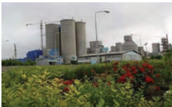
شکل ۱۰-۶ کارخانه سیمان در اردبیل

تصاویر پایین نشانگر بخشی از توانمندی‌های استان اردبیل در زمینه‌های کشاورزی و گردشگری و صنعتی و باغداری است. به نظر شما هر تصویر مربوط به کدام توانمندی‌های استان است؟ آیا می‌دانید استان اردبیل با وجود چنین توانمندی‌ها، با کدام موانع و محدودیت‌هایی در جهت توسعه مواجه است؟ این درس ضمن شرح وضعیت موجود، شما را با چشم انداز و برنامه‌های آتی توسعه استان آشنا می‌سازد.