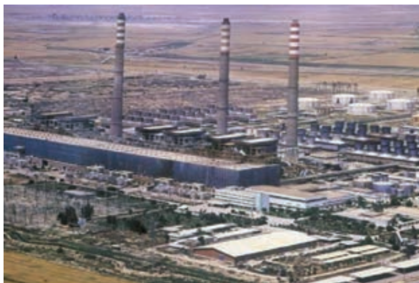
شکل ۵-۶- نمایی از توسعه نیروگاه حرارتی رامین اهواز