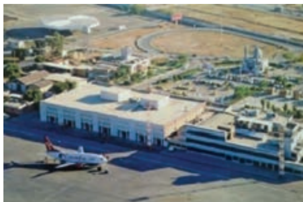
شکل ۹-۶- فرودگاه بین‌المللی اهواز