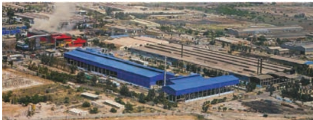
شکل ۲-۶- فولاد کویان - اهواز

چرا صادرات مشتقات پتروشیمی بر صادرات نفت خام اولویت دارد؟