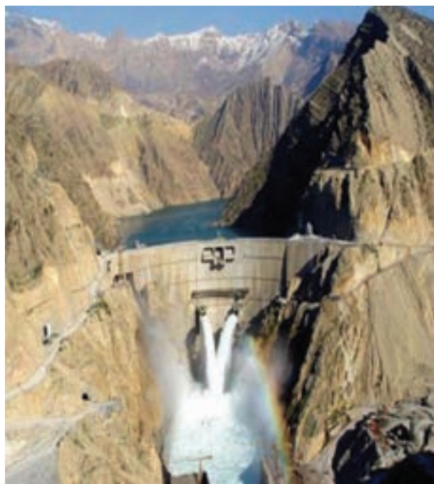
شکل ۴-۶- سد کارون ۳ بلندترین سد بتنی کشور

صنایع فلزی و غیرفلزی : صنایع فلزی استان به علت مجاورت با خلیج فارس و دارا بودن منابع سوختی فراوان از شرایط مناسبی برای توسعه برخوردار است. پس از پیروزی انقلاب اسلامی با ساخت و توسعه چهار کارخانه فولاد با تولید سالانه ۵ میلیون تن، خوزستان سهم عمده‌ای از تولید فولاد کشور را به خود اختصاص داده است. سایر طرح‌های در دست مطالعه مرتبط با بخش صنایع فلزی استان عبارت‌اند از: مجتمع ذوب و نورد خرمشهر، شرکت نورد و لوله کارون، فولاد شادگان و طرح فولاد اروند. در بخش تولید سیمان سه کارخانه با ظرفیت تولید ۸۳۰۰ تن در روز فعال‌اند. نیروگاه‌ها : در زمینه آب و برق قبل از پیروزی انقلاب اسلامی تنها دو سد مخزنی دز و شهید عباسپور با مجموع ۶/۶ میلیارد متر مکعب آب وجود داشت، ولی امروزه تعداد این سدها به شش مورد و گنجایش حجم آنها به حدود ۱۸ میلیارد متر مکعب افزایش یافت. ۶ سد مخزنی در مرحله ساخت و ۱۸ سد در دست مطالعه است. کرخه بزرگترین سد خاکی خاورمیانه، کارون ۳ مرتفع‌ترین سد بتنی و سد مسجد سلیمان (گدارلندر) مرتفع‌ترین سد خاکی کشور در استان قرار دارند. این سدها علاوه بر تولید برق کشور نقش مهمی در تأمین آب زمین‌های کشاورزی و صنایع استان را برعهده دارند.