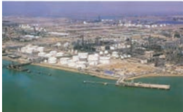
شکل ۱-۶- منطقه ویژه پتروشیمی ماهشهر