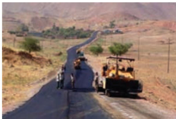
شکل ۸-۶- توسعه و احداث جاده‌های روستایی