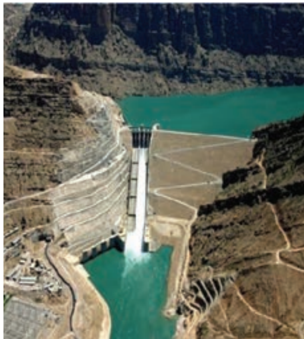
شکل ۳-۶- سد مسجد سلیمان (گدارلندر) بلندترین سد خاکی کشور

بیش از ۹۵ درصد ظرفیت نیروگاه‌های برق آبی کشور متعلق به خوزستان است و بدین ترتیب مقام اول کشور را در زمینه تولید برق به خود اختصاص می‌دهد. این استان به علت وجود سوخت‌های فسیلی، نیروگاه‌های حرارتی متعددی دارد که با توجه به صنایع متعدد، تراکم زیاد جمعیت و گرمی هوا، دومین مصرف‌کننده برق کشور محسوب می‌شود.