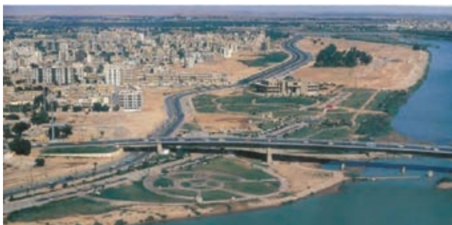
شکل ۱۰-۶- جاده ساحلی در حاشیه کارون - اهواز

توسعه عمران روستایی و محرومیت زدایی یکی از دستاوردهای انقلاب اسلامی بوده است. در بخش عمران روستایی مهم ترین اقدامات انجام شده در استان عبارتند از: