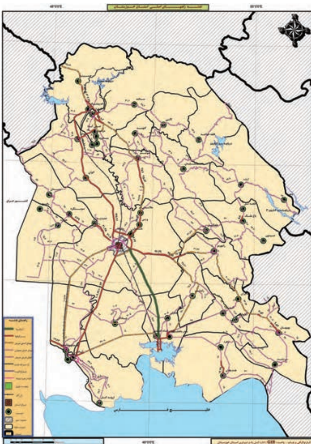
شکل ۱۱-۶- نقشه راه‌های استان