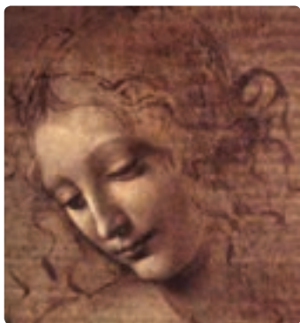
سوزان، لئوناردو داوینچی

در قرن ۱۴ میلادی، به مرکزیت ایتالیا در فلورانس، رنسانس به وجود آمد. رنسانس به معنای نوزایی می‌باشد. از ویژگی‌های این دوره استفاده از ویژگی‌های یونان و روم، انسان‌گرایی، فردیت‌گرایی، عقل‌گرایی، ناتورالیسم و مضامین مسیحی را می‌توان نام برد. ویژگی‌های تجسمی آثار این دوره شامل استحکام ساختار ترکیب‌بندی، استفاده از رنگ‌های روشن و تابناک، تأکید بر پرسپکتیو علمی و هنری، سایه روشن کاری، تأکید بر فضا با فعال کردن عامل مکان می‌باشد. رنسانس به سه دوره تقسیم می‌شود: