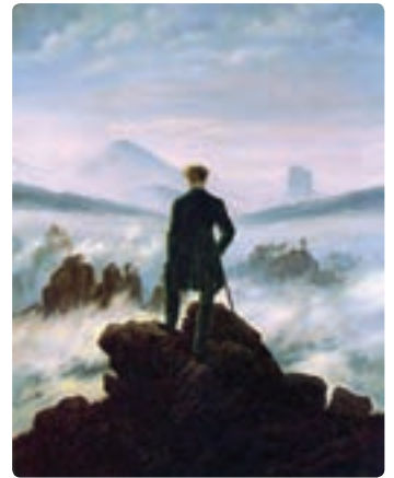
گاسپار دیوید فریدریش

رمانتیسیسم، مهمترین جنبش هنری و ادبی قرن ۱۹ است، که در تقابل با خردگرایی نئوکلاسیک، در انگلستان و آلمان مطرح شد. هنرمندان این جنبش، با استفاده از رنگ‌ها و خطوط درون‌نما و با هویتی خردگریز، سعی در بیان احساسات و هیجانات خود دارند. مهم‌ترین مرکز تولید آثار تجسمی رمانتیسیسم، انگلستان است. شعار هنر برای هنر، اولین بار توسط پیروان این مکتب (و پس از آنها توسط پیروان مکتب سمبولیسم) مطرح می‌شود. هنرمندان برجسته: جان کاتمن، جان کنستابل، ویلیام ترنر، اوژن دلاکروا، تئودور ژریکو، فریدریش، گویا، ویلیام بلیک، فرانسوا رود (با اثر معروف لامارسیز)