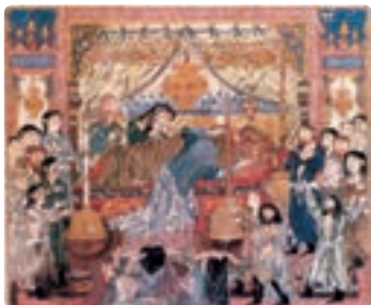
مرگ اسکندر - شاهنامه ایلخانی - تبریز