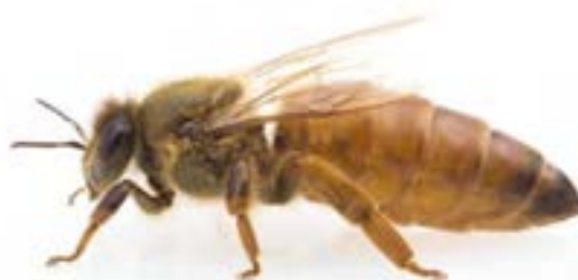
زنبور ملکه (طول بدن ۲ سانتی‌متر)

زنبور عسل نر: این نوع زنبور از تخم بدون نطفه تولید می‌شود، جثه آن پهن و حجیم‌تر از زنبور کارگر است و بدنش پوشیده از مو است هنگام پرواز صدای بال آنها بیش از زنبوران کارگر است. زنبور نر قادر به جمع‌آوری گرده و شهد نیست، در فعالیت‌های کلنی نیز دخالتی ندارد. تنها وظیفه آن جفت‌گیری با ملکه‌های جوان است و بعد از اتمام فصل جفت‌گیری جمعیت آنها کاهش می‌یابد و در صورت کمبود منابع غذایی معمولاً از کندو رانده شده یا از سوی کارگران تغذیه نمی‌شوند تا بمیرند؛ زیرا به تنهایی قادر به تغذیه نمی‌باشند. زنبور عسل کارگر: این زنبور عسل از نظر جثه کوچک‌ترین عضو کلنی است، تمام کارهای داخل و خارج از کندو مانند تمیز کردن کندو، رسیدگی به نوزادان و ملکه، جمع‌آوری گرده و شهد گل، ساختن حجره، حفاظت از کندو و غیره بر عهده آنها است.