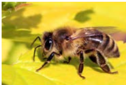
زنبور عسل معمولی