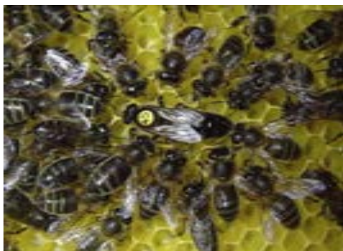
زنبور عسل تیره اروپا

ج) نژاد زنبور عسل تیره اروپا: موطن اصلی این نژاد تمام اروپا، غرب و شمال آلپ و مرکز