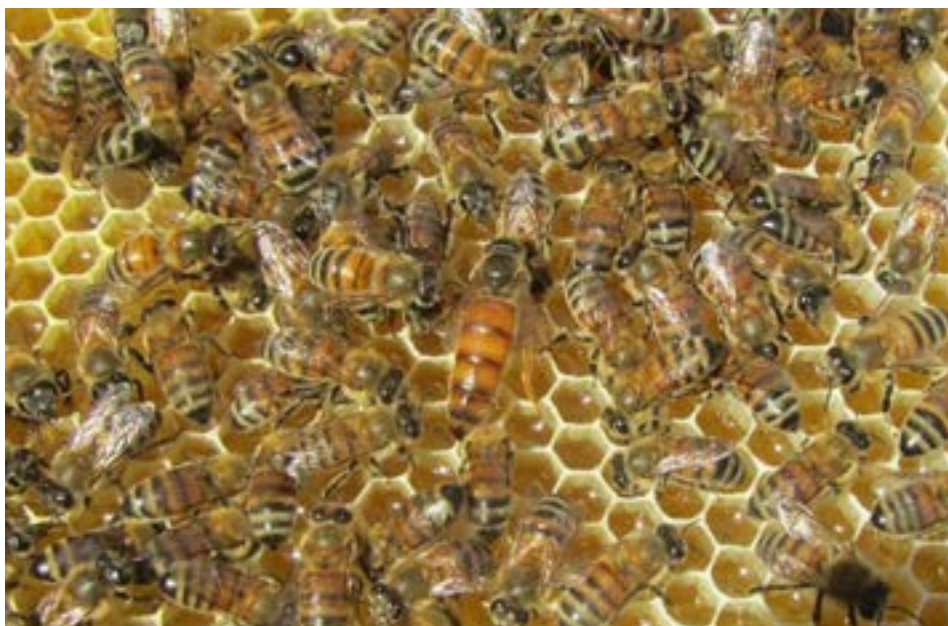
زنبور عسل ایرانی

ه) نژاد ایرانی: یکی از نژادهای گونه زنبور عسل معمولی است. چون در طول سالیان متمادی خود را با شرایط محیطی ایران سازگار کرده است، در مقایسه با نژادهای اصلاح شده خارجی سازگاری بیشتری با شرایط محیطی کشور ایران دارد.