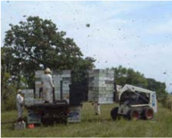
انتقال کندوها به داخل کامیون

مکان فعلی زنبورستان منتقل کرد و پس از چند روز آنها را به مکان مورد نظر که ممکن است در یک یا چند کیلومتری از محل زنبورستان باشد، انتقال داد.