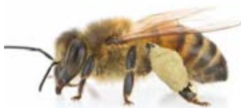
زنبور کارگر (طول بدن ۱ سانتی‌متر)

هر کلنی زنبور عسل از یک ملکه، چند صد زنبور نر و چندین هزار زنبور کارگر تشکیل شده است.