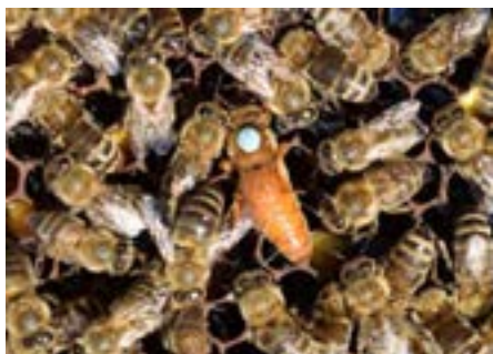
زنبور عسل ایتالیایی

زنبور عسل اروپائی در نقاط مختلف کره زمین دارای نژادهای مختلفی است، هر یک خصوصیات ویژه‌ای دارند که انواع معروف آن به شرح ذیل می‌باشد: