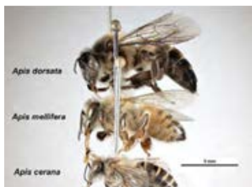
مقایسه سه گونه زنبور عسل درشت، ریز و معمولی