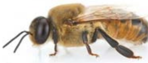
زنبور نر (طول بدن ۱/۵ سانتی‌متر)