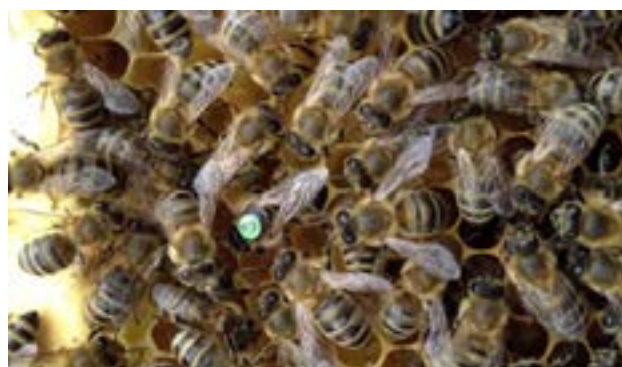
زنبور عسل کارنیولان

ب) نژاد کارنیولان یا زنبور عسل خاکستری: این نژاد از نواحی جنوبی سلسله جبال آلپ در اتریش