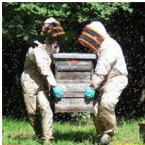
انتقال کندو در محل زنبورستان

اگر منظور از جابه‌جایی کلنی‌های زنبور عسل انتقال به فاصله نسبتاً کم مثلاً چند متر در محل زنبورستان باشد. ساده‌ترین کار این است که روزانه کندوی مورد نظر را حداکثر یک متر به سمت محل جدید انتقال داد. با این کار زنبورها قادر خواهند بود موقعیت کندوی خود را در حافظه ثبت کرده و به اشتباه وارد کلنی دیگری نشوند و عمل انتقال آنها انجام گیرد.