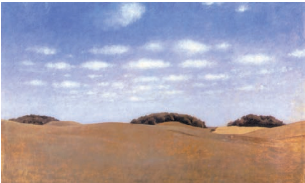
تصویر ۶۲-۲- ویلهم هامرشوی - ۱۹۰۵ - رنگ و روغن روی بوم

پس از خشک شدن رنگ، برای محو کردن و برجسته کردن، از «رنگابه کاری» استفاده می‌شود. این کار در طبیعت برای اجزای دورتر مثل کوه‌ها و درختان دوردست و همچنین، برای ساخت و ساز ابرها استفاده می‌شود.