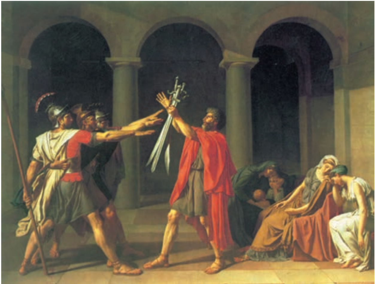
تصویر ۱-۳ - ژاک لویی داوید - سوگند هوراتیوس‌ها - ۱۷۸۴ - رنگ و روغن روی بوم ۳۳۰×۴۲۰ سانتی متر

شکوه و عظمت در نورپردازی باروک، پیکره‌ها را حجیم‌تر و حالات چهره را دقیق‌تر می‌نمایاند. در این عصر، چهره پردازی در آثار رامبراند، با نوعی موشکافی روان‌شناسانه و استفاده‌ی آزادانه از قشر رنگ همراه است. همین خصوصیات، به‌علاوهٔ تنوع در کاراکترسازی و موقعیت‌های فیگور در آثار گویا ۱ نیز به شکلی دیگر دیده می‌شود. گویا، روحیات رمانتی‌سیسم، رئالیسم و اکسپرسیونیسم را در دوره‌های مختلف آثارش به نمایش می‌گذارد. تجدید میثاق‌های رنسانس و یونان باستان در دوره‌ی «نتوکلاسیک» ۲ و ظهور موضوعات شاعرانه (تصویر ۱-۳ ) و افسانه‌ای در دوران رمانتی‌سیسم، پیکره‌نگاری را با تلقی‌ات این شیوه‌ها، توأم نمود.