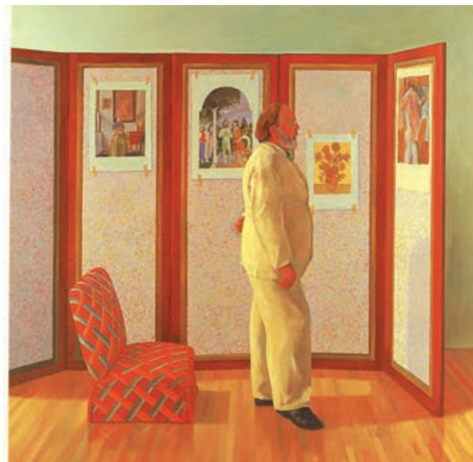
تصویر ۲۶-۳- دیوید هاکنی - نگاه کردن تصاویر روی پاراوان - ۱۹۷۷ - رنگ و روغن روی بوم - ۷۲×۷۲ سانتی متر