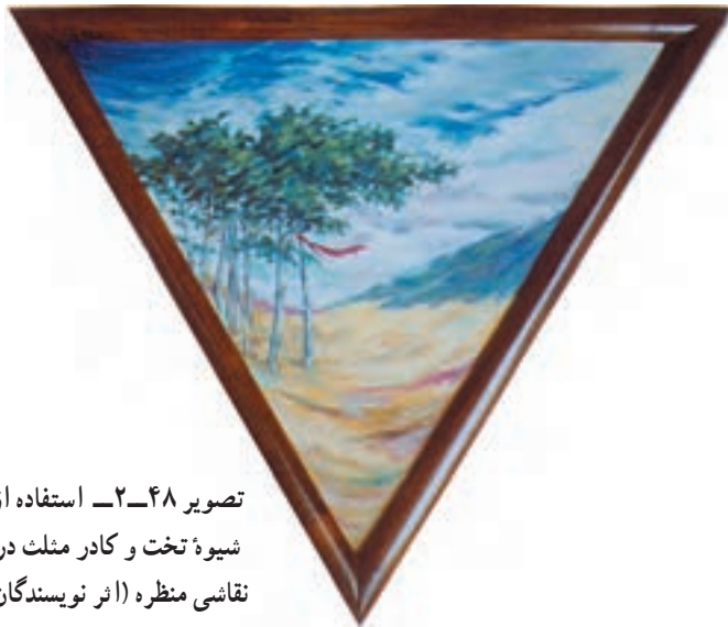
تصویر ۲-۴۸ - استفاده از شیوه تخت و کادر مثلث در نقاشی منظره (اثر نویسندگان)

شیوه تخت یا هندسی: در این شیوه، ترکیب‌بندی مناسبی را از طبیعت انتخاب کرده، اشکال آن را ساده می‌کنیم. باید سعی شود، سایه‌روشن‌ها و رنگمایه‌ها به صورتی تفکیک شده، کنار هم قرار گیرند.