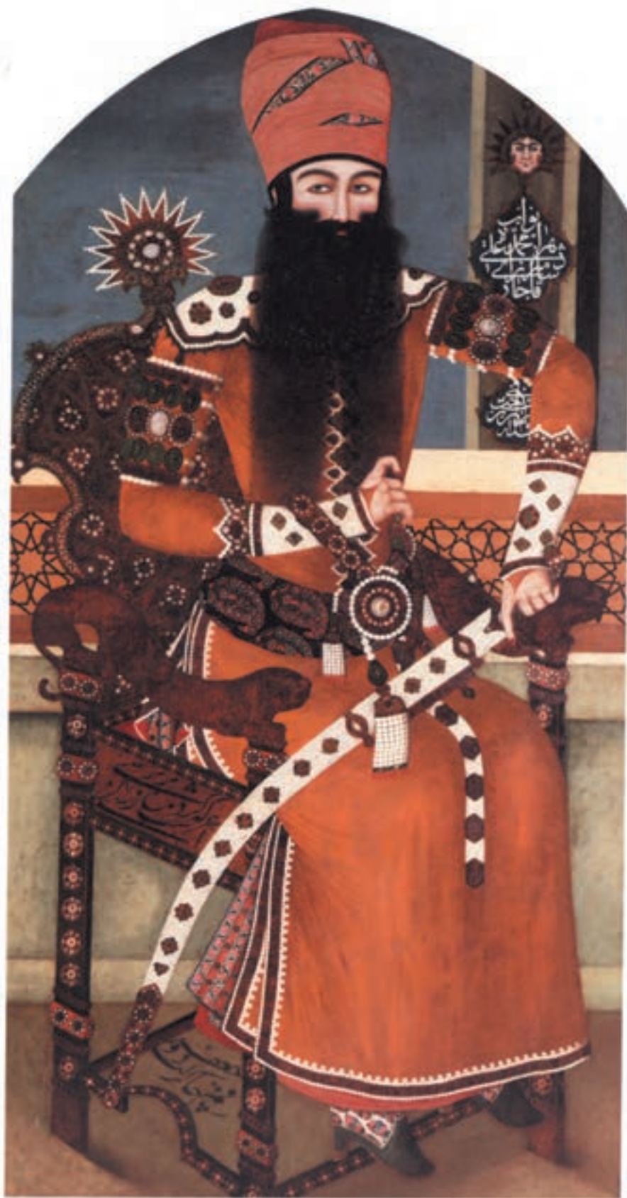
تصویر ۵-۳- محمدعلی میرزا - ۱۲۳۶ - (۱۸۲۰) رنگ و روغن روی بوم ۲۰۸×۱۰۷