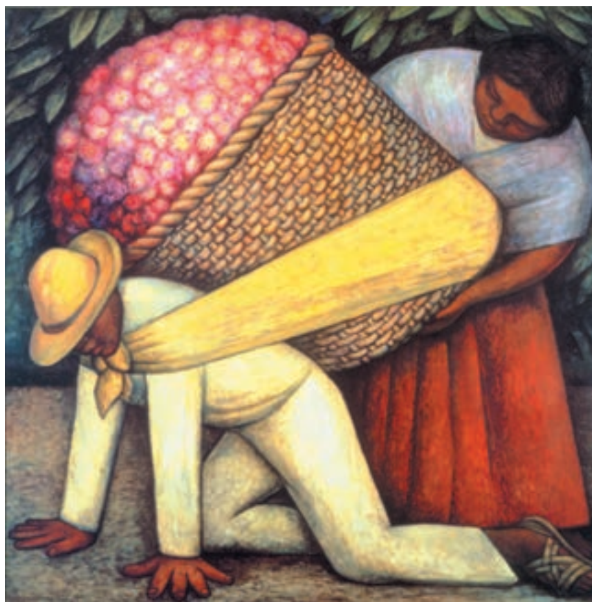
تصویر ۲۴-۳- دیگو ریورا - حمل کننده گل - ۱۹۳۵ - رنگ و روغن و تمپرا ۱۲۱×۱۲۲ سانتی متر