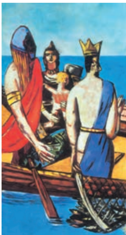
تصویر ۲۳-۳- ماکس بکمان - عزیمت - بخشی از قاب سه لوحی - ۳۲ - ۱۹۳۰ - رنگ و روغن روی بوم ۲/۲×۱۱۵ سانتی متر