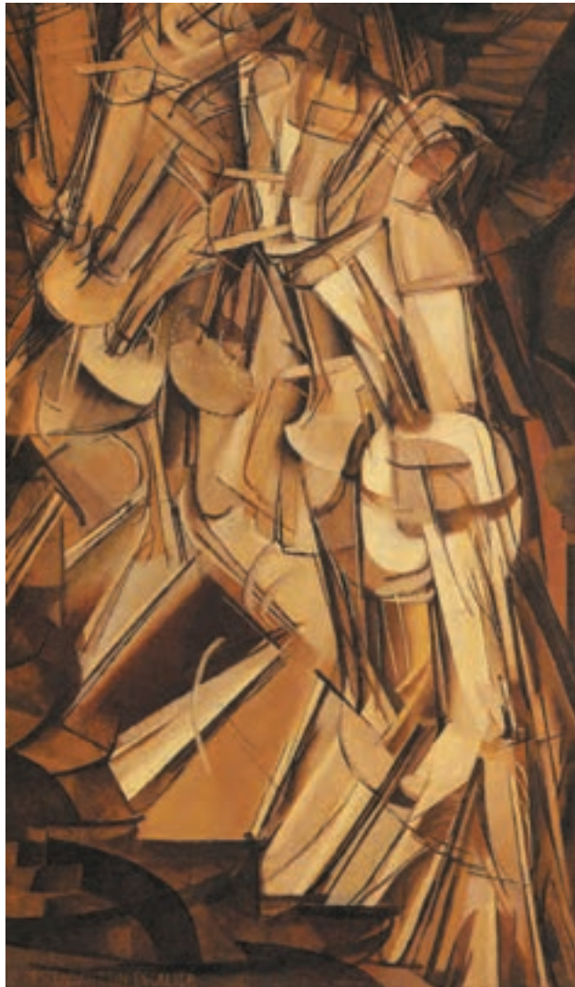
تصویر ۱۸-۳- مارسل دوشان - زنی از پلکان پایین می آید - رنگ و روغن روی بوم ۱۹۱۲