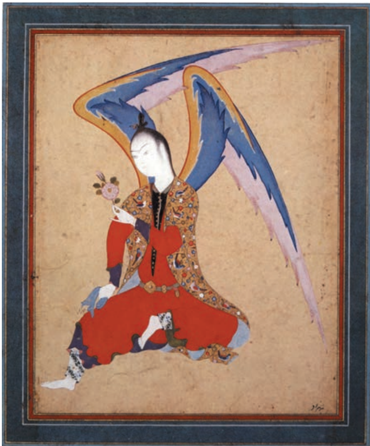
تصویر ۴-۳- فرشته نشسته - مکتب تبریز - آبرنگ و طلا روی کاغذ ۱۱×۱۳ سانتی متر