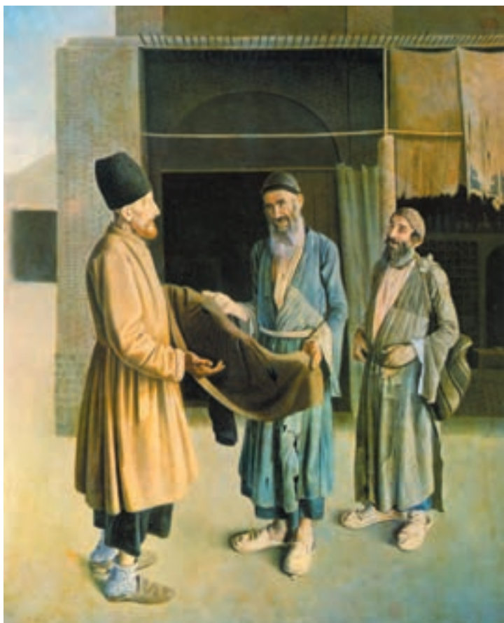
تصویر ۶-۳- کمال الملک شبیهه عمو صادق شیرازی با کهنه فروشها - رنگ و روغن روی بوم - ۱۳۰۸ ه.ق - ۶۹/۵ × ۵۳ سانتی متر