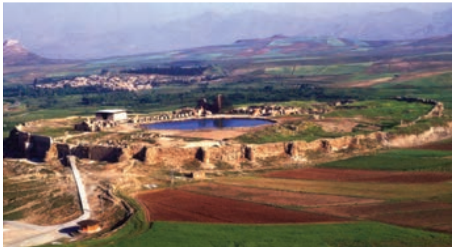
▲ شکل ۸-۱ چشم انداز کلی، تخت سلیمان، آذربایجان غربی

(شکل ۷-۱) و بناهای دیگر از جمله رصدخانه مراغه و قصر ایلخانی در تخت سلیمان (شکل ۸-۱) را نام برد. همچنین بارزترین تزینات معماری را می‌توان در محراب‌سازی مسجد جامع اصفهان دید (شکل ۹-۱). اما تحول دیگر در زمینه کاشی معرق است که جایگزین آجرکاری‌ها و تلفیق آن با کاشی بنایی شده است.