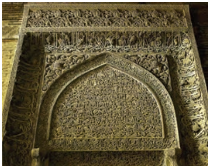
▲ شکل ۹-۱ محراب مسجد جامع اصفهان

میراث هنری دیگری که در این دوره به حد شکوفایی خود می‌رسد، نگارگری است. در این دوره تحریم نگارگری تا اندازه‌ای شکسته شد و جنبه همگانی‌تری یافت. این زمان با بهره‌گیری از تأثیرات هنری پیشین، نگارگری ناب ایرانی پدید آمد.