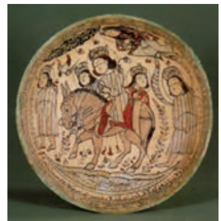
▲ شکل ۱۸-۱۰ - ظرف سفالین، کاشان

سفالگری در این دوره نیز مورد توجه بوده است و از مهم‌ترین مراکز تولید سفال کاشان، ری و سلطان‌آباد است. سفالگران کاشانی به دلیل دارا بودن امکانات منطقه‌ای رشد قابل ملاحظه‌ای در سفالگری داشتند. آنها توانستند در این دوره نوشته‌های برجسته‌ای را به نقاشی بیفزایند و فن مشبک‌سازی ظروف سفالین را به کمال برسانند. همچنین در تزیین از طراحی و خطاطی و شیوه نگارگری بهره بردند (شکل ۱۸-۱۰). از مناطق رقیب کاشان بایستی به ری اشاره کرد که غالباً بر روی سفالینه‌ها موضوعاتی از جمله مجالس شکار یا چوگان را بر زمینه سفید یا لاجوردی به همراه نقش ترنج‌های زیبا و پرکار استفاده می‌کردند (شکل ۱۹-۱۰). همزمان شیوه سلطان‌آباد با نوعی ترنج چهارپر که درون آن را با تصاویر بسیار زنده از جمله گوزن و آهو پر می‌کردند به شیوه‌ای خاص و بدیع مبدل شد. در آن طرح شکوفه‌هایی با خط‌های باریک آبی روی زمینه‌های تاریک اجرا می‌شد (شکل ۲۰-۱۰ الف و ب).