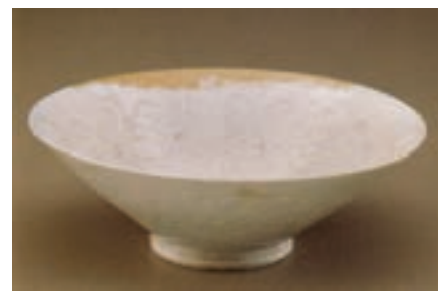
▲ شکل ۱۶-۹ ظرف سفید، طرح چینی

موضوع این نقاشی‌های روی ظروف، مجالس بزم و رزم و گاه موضوعات داستانی برگرفته از ادبیات فارسی است (شکل ۹-۱۷).