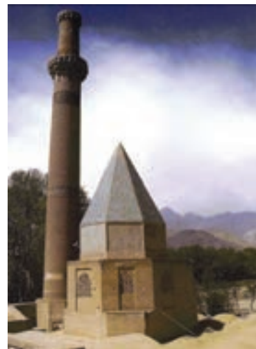
▲ شکل ۷-۱ آرامگاه شیخ عبدالصمد، نطنز