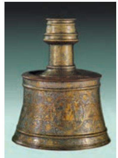
▲ شکل ۲۱-۱۰- پایه شمعدان فلزی، شیراز