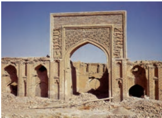
▲ شکل ۱۰-۹- رباط شرف، خراسان

توجه به معماری‌های غیرمذهبی بنا به ضرورت و نیاز فرمانروایان این دوره در شکل کاخ‌ها (شکل ۹-۹) و دیگر بناهای مرتبط با تجارت، بازرگانی و سفر از جمله رباط‌ها و کاروانسراها (شکل ۹-۱۰) به ظهور رسیده است. در تمامی بناهای این دوره از مصالح و فنون ساخت عالی، طاقسازی، گنبد و عناصر مختلف معماری به خوبی بهره‌برداری شده است. همچنین کتیبه‌نگاری در تمامی بخش‌های بنا به کار رفته و توانسته ضمن نقش تزئینی، جنبه‌های کاربردی آن نیز مورد توجه باشد.