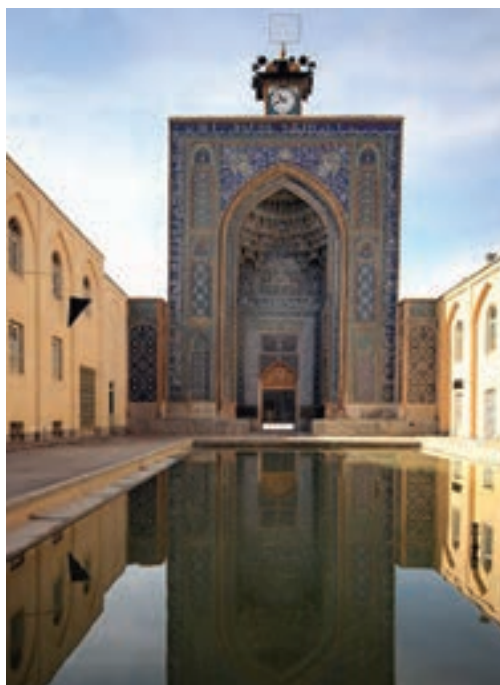
▲ شکل ۵-۱ مسجد جامع کرمان