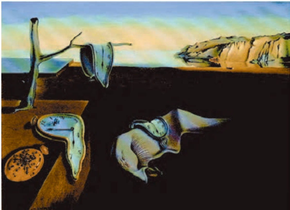
شکل ۱۴-۵- سالوادور دالی- پایداری حافظه، ۱۹۳۱ م. رنگ روغنی روی بوم، (۲۴/۱ × ۳۳ سانتی‌متر)؛ در آثار نقاشان سوررئالیست ایجاد فضای وهمی بر اساس خواب‌ها و تصورات ضمیر ناخودآگاه صورت می‌گیرد.