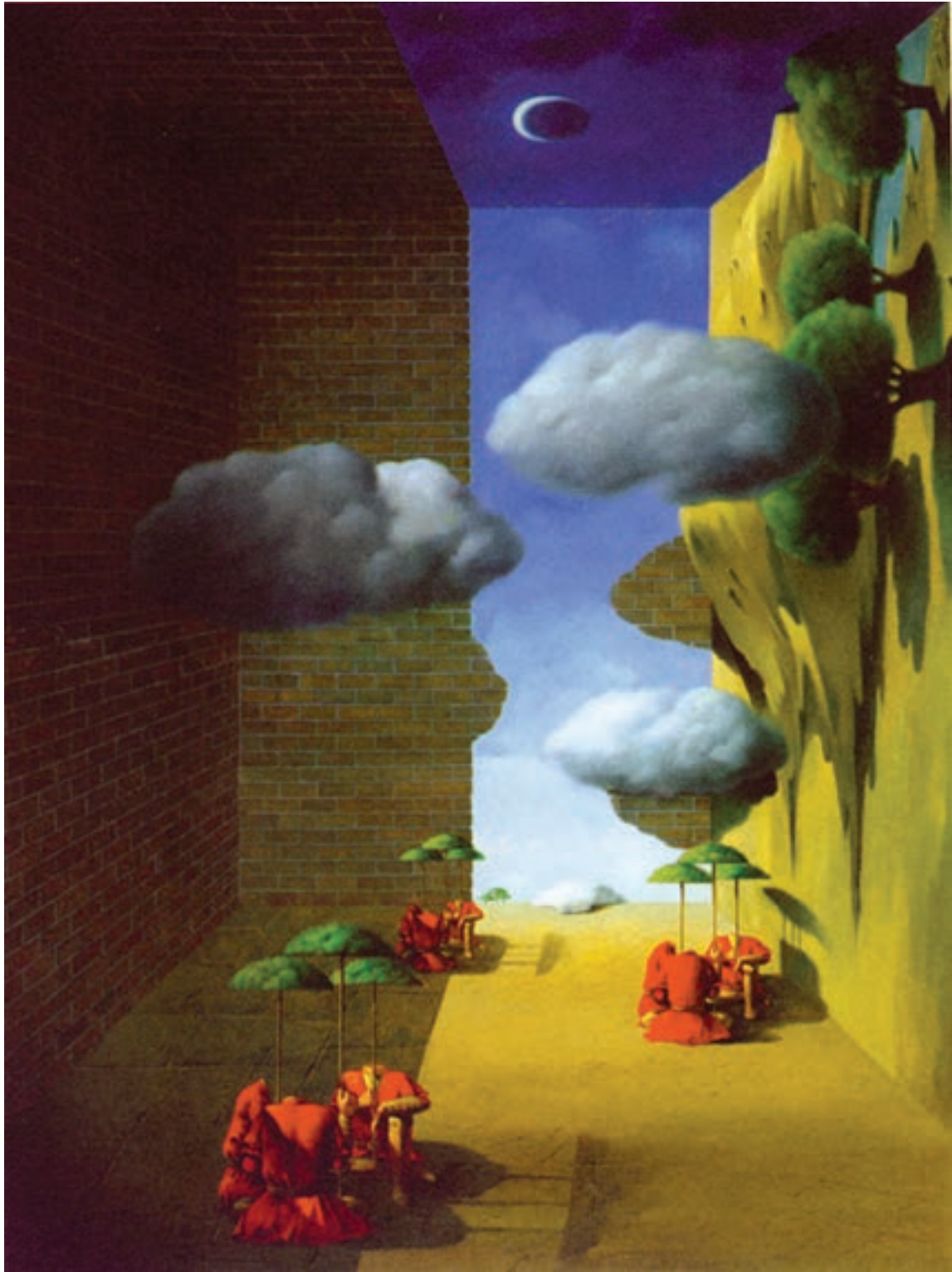
شکل ۱۵-۵- صادقی، علی اکبر؛ مأخذ: کتاب نمایشگاه، نگاه معنوی، ایجاد فضای وهمی در اثر تلفیق فضاها و عناصر نامأنوس با یکدیگر