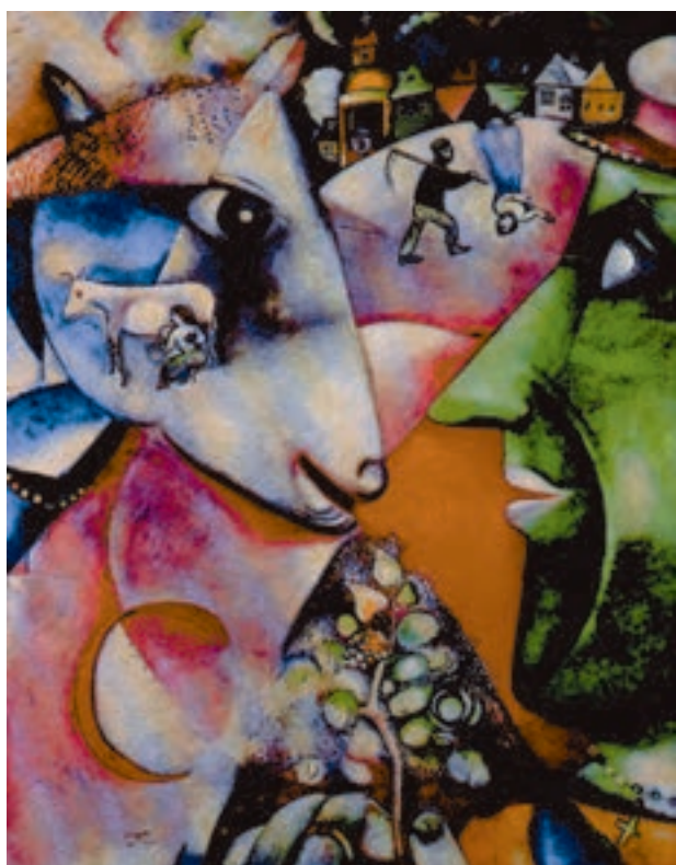
شکل ۹-۵- مارک شاکال - من و دهکده ام، ۱۹۱۱م. رنگ روغنی روی بوم (۱۵۱/۴ × ۱۹۲/۱ سانتی متر)؛ نمایش همزمان مکان‌های مختلف و اتفاقاتی که به طور موازی رخ می‌دهد فضایی گسترده‌تر از فضای واقع‌نما ایجاد می‌کند.

ج) فضای همزمان (تلفیقی): در برخی از آثار نمایش فضای تجسمی به صورت تلفیقی از فضا سازی واقع‌نما و دو بُعد نما صورت می‌گیرد. در این روش هنرمند بدون رعایت قواعد واقع‌نمایی در کل اثر، ساختار ترکیب خود را از مکان‌های مختلف به صورت موازی و به‌طور همزمان شکل می‌دهد. در عین حال سعی می‌کند با نمایش همزمان رویدادها در مکان‌های مختلف تلفیقی از فضا های داخلی و بیرونی به وجود آورد. به این ترتیب فضای تجسمی گسترش می‌یابد. در آثار نقاشی قدیم ایران این نحو از نمایش فضا به ایجاد یک فضای تجسمی گسترده برای روایت‌گری موضوعات داستانی کمک می‌کند. در هنر مدرن نیز نقاشان کوبیست کوشیدند با به نمایش گذاشتن اشیاء و مکان‌ها از چند زاویه دید مختلف زمان را در آثار خود به نمایش بگذارند. اما آن‌ها به این نگرش و شکستن شکل‌های واقع‌نما برای گریز از واقع‌نمایی، موضوع و روایت‌گری را تا حد زیادی در آثار نقاشان از میان بردند (شکل‌های ۹-۵ تا ۱۱-۵).