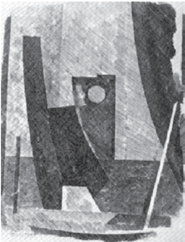
شکل ۵-۵- جیرانی کرمپای، محل ساختمان کشتی ۱۹۵۸ م.: تغییر تیرگی برای ایجاد عمق فضایی در سطح