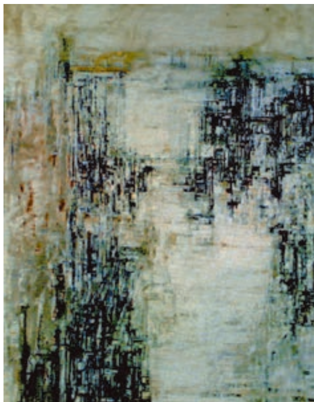
شکل ۷-۵- ماریا هلنا ویرا دوسیلوا، کارخانه برق، ۱۹۲۰م؛ تغییر وضوح و بافت شکل‌ها جهت ایجاد عمق فضایی