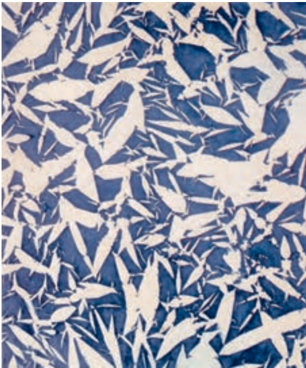
شکل ۴-۵- سیمون هانتایی، ترکیب؛ تغییر اندازه شکل‌های مشابه منجر به ایجاد عمق فضا در تصویر دو بُعدی شده است.

۳- تغییر وضوح: معمولاً هر چه اشیا از ما دورتر می‌شوند وضوح خود را بیشتر از دست می‌دهند و ما دیگر آن‌ها را به روشنی مشاهده نمی‌کنیم. در این صورت عمق فضایی با تغییر وضوح از اشکال واضح به اشکال ناواضح تعیین می‌شود (شکل ۳-۵).