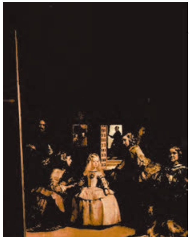
شکل ۳-۵- دیگو ولاسکز - ندیمه‌ها، ایجاد عمق فضایی با استفاده از تغییر وضوح