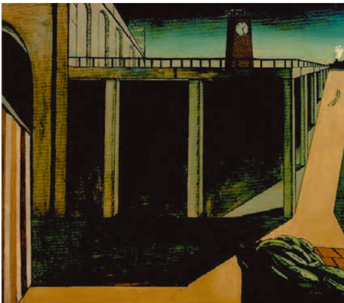
شکل ۱۲-۵- جورجو دکریکو، ایستگاه راه‌آهن مون پاراناس، ۱۹۱۴م. رنگ روغنی روی بوم، (۱۸۴/۵ × ۱۴۰ سانتی‌متر)؛ ایجاد فضای وهمی با استفاده از تمهیدات بصری مثل اغراق در نمایش عمق فضای بصری و نشان دادن ارتباط‌های نامأنوس میان اشیا در آثار دکریکو دیده می‌شود.

بسیار دیده می‌شود. نمایش این فضاها که جنبه‌ای خیالی و ذهنی دارد اگرچه توسط قوه‌ی خیال قابل تجسم است، اما در واقعیت و به‌طور طبیعی نمی‌تواند اتفاق بیفتد یا وجود داشته باشد. مثل ساعت‌هایی که ذوب شده و لخت هستند یا قطاری که از یک مکان خیالی و ناشناخته می‌گذرد، یا شیر و موجود درنده‌ای که بر خلاف طبیعت خود هیچ وحشت و اضطرابی ایجاد نمی‌کند (شکل‌های ۱۲-۵ تا ۱۵-۵).