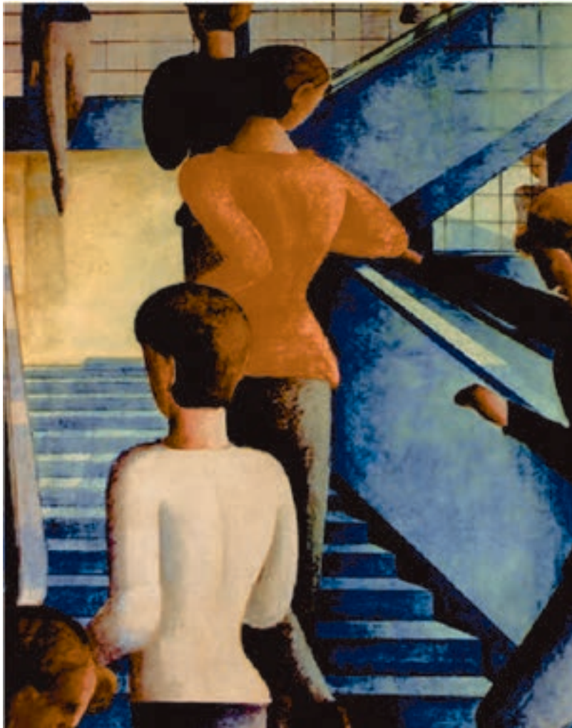
شکل ۱-۵- اُسکار شلمر، راه پله مدرسه باوهاوس، ۱۹۳۲ م.، رنگ روغنی روی بوم (۱۱۴/۳ × ۱۶۲/۳ سانتی‌متر)؛ نمایش فضای سه بُعدی روی سطح دو بُعدی از طریق تغییر اندازه