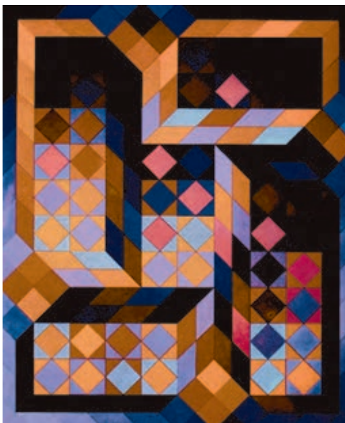
شکل ۸-۵- ویکتور وازارلی، ترکیب سه بُعدی. ترسیم شکل چهارگوش از زوایای مختلف در فضای بصری اثر ایجاد عمق کرده است.