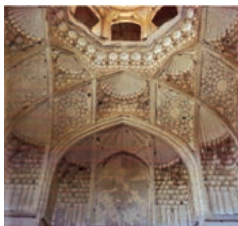
▲ شکل ۱۱-۳- الف- نمای داخلی مدرسه غیانیه