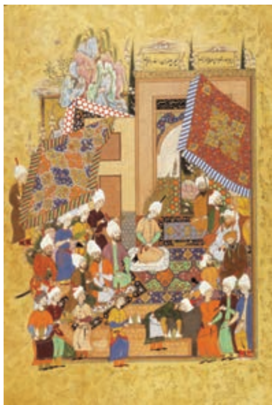
▲ شکل ۶-۱۲- برگي از كتاب هفت اورنگ جامي

نگارگری از نوعی ترکیب‌بندی حلزونی پیروی می‌کرد که شاخص آن را می‌توان در نسخه شاهنامه نفیس این دوران دید (شکل ۵-۱۲). پس از تبریز، برای مدت زمان کوتاهی، مکتبی هنری در مشهد (در نیمه دوم سده دهم هجری) ظهور کرد که در آن ویژگی‌های مکتب تبریز با عناصر محلی ادغام و روش جدیدی پدید آمد. در این مکتب بیشترین توجه به موضوعات عادی و ترسیم درخت کهنسال با تنه و شاخه گره‌دار و استفاده از رنگ سفید خودنمایی می‌کند. حاصل این تجربه هنری را می‌توان در کتاب هفت اورنگ جامی دید (شکل ۶-۱۲).