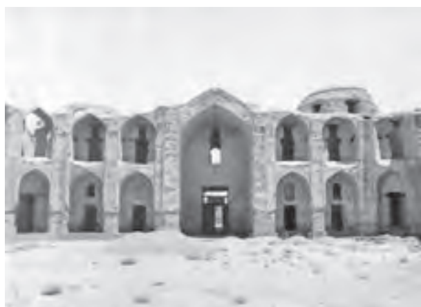
▲ شکل ۱۱-۳- ب- مدرسه غیانیه، خرگرد، خراسان