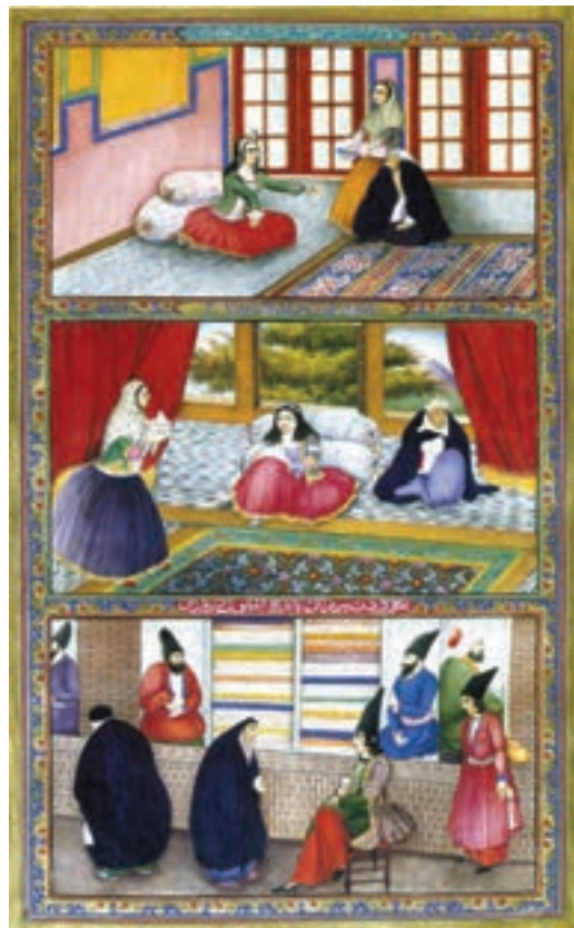
▲ شکل ۱۲-۱۳- الف- برگی از کتاب هزار و یک شب، صنیع الملک، دوره قاجاریه