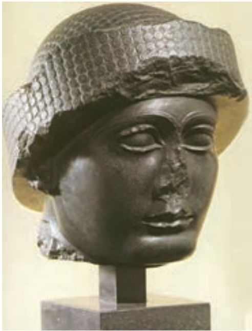
تصویر ۱۰- سر گودا، از سنگ دیوریت، از شهر لاگاش، حدود ۲۱۵۰ پیش از میلاد، موزه بغداد

از زیباترین آنها سردیسی است که هنرمند تلاش کرده، حالت روحانی وی را نشان دهد (تصویر ۱۰). تندیس‌های گودا، مظهر نیایشگری است که با خلوص در مقابل معبود خود قرار گرفته است. تداوم هنر بین‌النهرین از سردیس ملکه اوروک تا سردیس حاکم اکدی و سردیس گودا ادامه دارد.