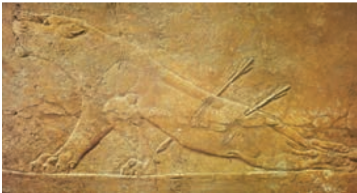
تصویر ۱۱- شیر زخمی در صحنه شکار، حجاری روی سنگ، کاخ آشور بانیپال، نینوا، حدود ۶۵۰ پیش از میلاد، موزه بریتانیا

هنر آشوری پس از مدت‌ها اقتباس و تجربه از هنر بابلی و اقوام دیگر ۱ آسیای صغیر (ترکیه امروزی) که در نقش برجسته‌سازی توانا بودند، سبکی را بنیان گذاشت که منشأ موفقیت‌های حجاران گردید ۲ و در زمان آشور نصیر پال دوم تبدیل به هماهنگی بین معماری و هنر تصویری شد. هنر آشوری در زمان آشور نصیر پال و آشور بانیپال در معماری کاخ‌ها و نقش برجسته‌های دیواری تجلی یافت. نقش برجسته‌ها اغلب به صحنه‌های جنگ، شکار، محاصره شهرها و قلعه‌ها و مراسم مذهبی اختصاص داشت و شاه همچون قهرمان در همه جا حضور داشت. هنرمندان