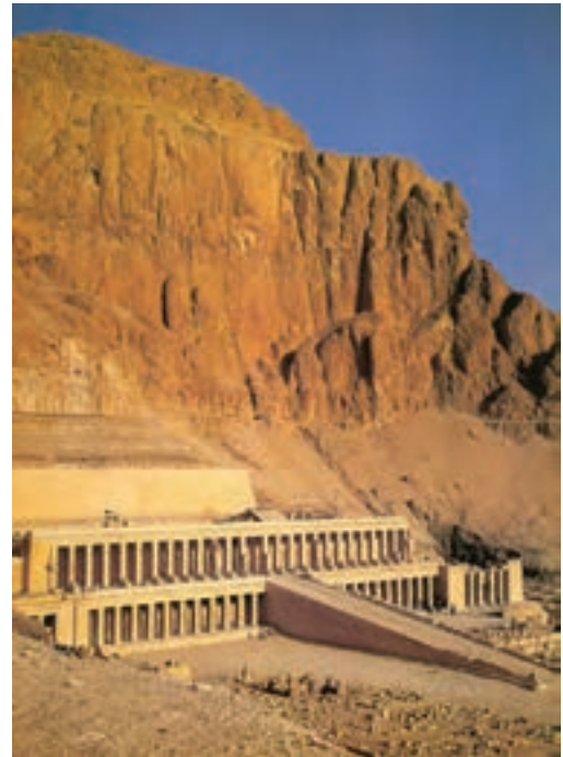
تصویر ۹- معبد حت شپ سوت در دیرالبحری، حدود ۱۴۸۰ پیش از میلاد

دو تن از حاکمان این دوره، اخناتون ۲ و توت عنخ آمون ۳ بسیار مشهور هستند. اخناتون تلاش می‌کرد از محدودیت‌های سنتی بکاهد و در پی این تلاش، هنرمندان نیز از آزادی محدودی برخوردار شدند و آثاری را خلق کردند که در آنها واقع‌گرایی و طبیعت‌گرایی به چشم می‌خورد که نمونه آن سر اخناتون است (تصویر ۱۰). اما شهرت توت عنخ آمون به دلیل مقبره اوست که دست نخورده کشف شد. در ماسک طلایی روی صورت او آزادی حرکت و حالت به چشم می‌خورد (تصویر ۱۱). از دیگر آثار سلسله‌های جدید، نقاشی‌های دیواری درون مقبره هاست. نقاشی‌های دیواری، نقوش و نوشته‌های روی کاغذ پاپیروس ۴ و بدنه تابوت، مراحل زندگی بعد از مرگ را