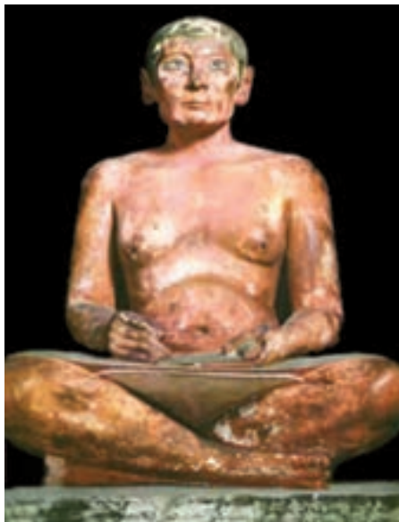
تصویر ۶- کاتب نشسته، سنگ آهک، بلندی ۵۳ سانتیمتر، دوره پادشاهی قدیم، حدود ۲۵۰۰ پیش از میلاد، موزه لوور، پاریس

نقش برجسته‌ها و نقاشی‌های مصری به صورت ترکیب نیم رخ و تمام رخ اجرا می‌شدند (تصویر ۷). هنرمندان مصری مانند میانرودانی‌ها در جانورنگاری از طبیعت‌گرایی پیروی می‌کردند که نمونه برجسته آن غازهای میدم ۱ است (تصویر ۸).