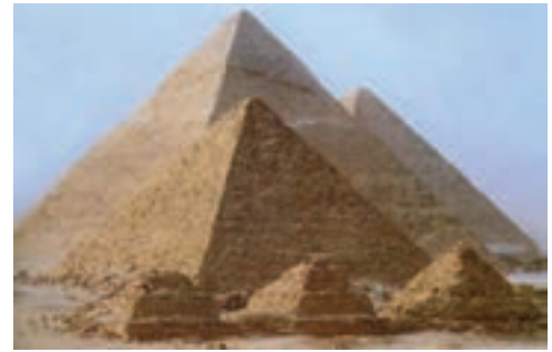
تصویر ۳- اهرام ثلاثه، جیزه، بین ۲۵۷۰ تا ۲۵۰۰ پیش از میلاد

هنر این دوره حالتی حماسی و شاعرانه دارد و در کلیه زمینه‌ها به اوج می‌رسد. آثار هنری بر اساس یک طرح از پیش تعیین شده ساخته شده و قواعد هندسی به دقت در آن رعایت می‌شد.