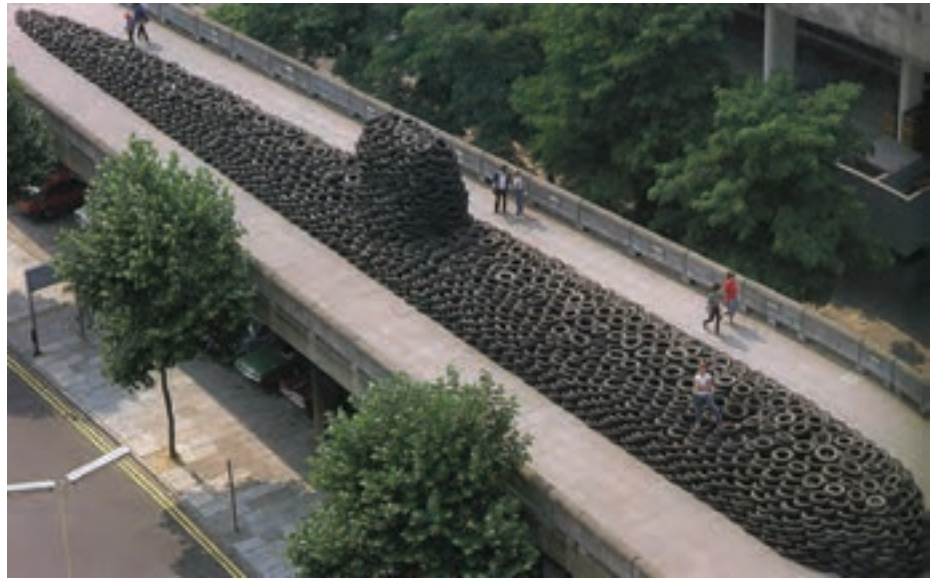
تصویر ۱۷- هنر چیدمان، اثر دیوید ماچ، لاستیک‌های فرسوده، نمایش در گالری هاروارد لندن، تخریب پس از نمایش

نام جوم پایک ۱ هنرمندی است که با چیدمان وسایل بصری، حجم‌های جالبی را ایجاد می‌کند و با نگاه طنز یا انتقادی خود، تسلط وسایل ارتباط جمعی را بر زندگی انسان نشان می‌دهد (تصویر ۱۸). در هنر معاصر، عکاسی جایگاه ویژه‌ای یافته است و هم ارزش با سایر رشته‌های هنری قرار گرفته است. به کمک امکانات کامپیوتری بین هنر عکاسی و دیگر شکل‌ها حد و مرزی وجود ندارد. دو رسانه ویدئو و عکاسی به دلیل جذابیت مردمی و جنبه سرگرمی و سهولت نقل و انتقال آن مورد استقبال هنر جدید قرار گرفته است. یکی از هنرمندان پُست مدرن در عکاسی، دوکادنه ۲ است که عکس‌های رادیولوژی را با توجه به ویژگی‌های شخصی افراد رنگ می‌زند و ترکیبی از عکاسی و نقاشی به وجود آورده است. (تصویر ۱۹).