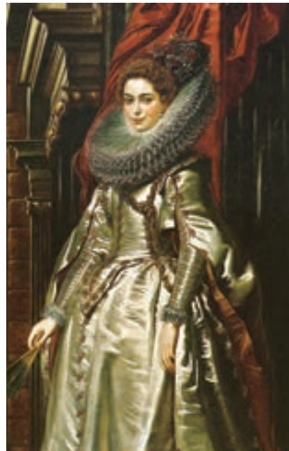
تصویر ۳- مارکزا، اثر روبنس، رنگ و روغن، سال ۱۶۰۶ میلادی، گالری هنر واشنگتن