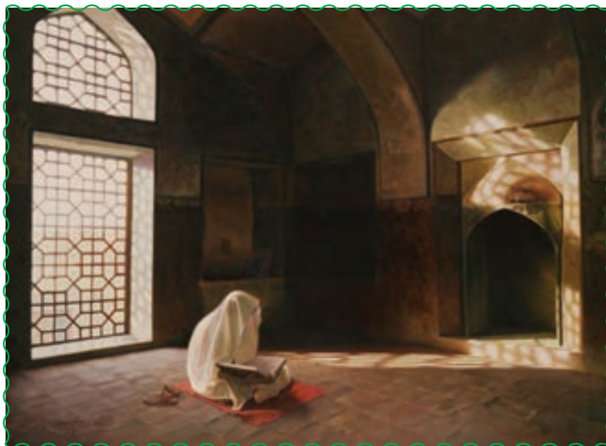
دانش‌آموزان خود را به خواندن روزانه‌ی قرآن کریم تشویق کنیم.

در خانه، کلمات و عبارات درس را برای اعضای خانواده‌ی خود با صدای بلند بخوانند.