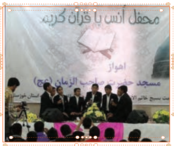
انس با قرآن کریم در استان خوزستان

با راهنمایی آموزگار خود پس از آوردن قرآن کریم از دفتر مدرسه، آن را به صورت تصادفی باز کنید و از روی آن بخوانید.