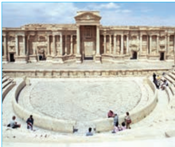
آثار باستانی تدمر (پالمیرا) پیش از تخریب توسط گروه داعش

در جریان فتوحات، مسلمانان هنگامی که به سپاه دشمن برخورد می‌کردند و یا به آبادی و شهری می‌رسیدند، طبق تعالیم اسلام و سنت پیامبر، سه پیشنهاد به آنان ارائه می‌دادند: اول، اسلام بیاورید؛ دوم، تسلیم شوید و جزیه پرداخت نمایید و سوم، بجنگید. پذیرش هر یک از این پیشنهادها وضعیت متفاوتی را به وجود می‌آورد. چنانچه پیشنهاد اول مورد قبول قرار می‌گرفت و طرف مقابل اسلام می‌آورد، آنان از حقوقی برابر با دیگر مسلمانان برخوردار می‌شدند، اموال و دارایی‌هایشان محفوظ می‌ماند و همچون سایر پیروان اسلام ملزم بودند که زکات بپردازند. اگر پیشنهاد دوم مورد قبول طرف مقابل قرار می‌گرفت و راضی به پرداخت جزیه می‌شدند، مسلمانان نیز امنیت جان و مال آنان را تضمین می‌کردند و به آنان اجازه می‌دادند که بر دین خویش باقی بمانند و آداب و مناسک مذهبی خود را به جا آورند. همچنین امنیت و احترام پرستشگاه‌های آنها مانند کلیساها و آتشکده‌ها ضمانت می‌گردید. البته پیشنهاد دوم فقط از پیروان کتاب‌های آسمانی مانند یهودیان، مسیحیان و زرتشتیان پذیرفته می‌شد که به آنان اهل ذمه هم می‌گفتند. در صورتی که کار به جنگ می‌کشید، نتیجه جنگ، تکلیف دو طرف را مشخص می‌کرد.