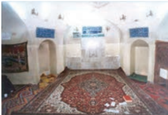
تصویر منزل منسوب امام علی رضی الله عنه در کوفه

پس از عثمان، مردم در مدینه به اصرار از علی رضی الله عنه خواستند که خلافت را بپذیرد و با آن حضرت بیعت کردند. امام مصمم بود که مطابق کتاب