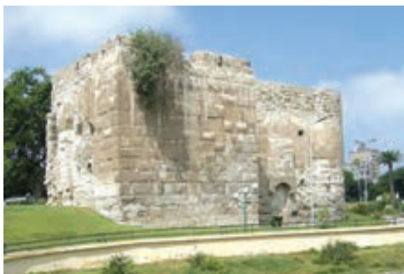
بقایای بخشی از باروی اسکندریه

مصر نیز همچون شام، به هنگام ظهور اسلام، بخشی از قلمرو امپراتوری روم شرقی بود. اسکندریه ۱ در شمال مصر، یکی از مراکز مهم نیروی دریایی آن امپراتوری به شمار می‌رفت. تسلط رومیان بر مصر، موقعیت مسلمانان را در شام و حتی در شبه‌جزیرهٔ عربستان در معرض خطر جدی قرار می‌داد. از این رو، مسلمانان بعد از فتح شام درصدد برآمدند که مصر را نیز تسخیر کنند. عمرو عاص ۲ که آبادانی و ثروت فراوان آن سرزمین را از نزدیک مشاهده نموده و تا اندازه‌ای با وضعیت سیاسی و اجتماعی آن‌جا آشنا بود، فرماندهی سپاه اعراب مسلمان را در حمله به مصر به عهده گرفت.