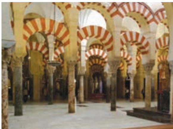
مسجد جامع قرطبه

شکوفایی معماری: اندلس اسلامی در عرصه معماری نیز بسیار شکوفا بود. مسجد جامع قرطبه و کاخ الحمراء غرناطه، دو شاهکار معماری جهان اسلام به شمار می‌روند که سالانه میلیون‌ها گردشگر را از اقصی نقاط جهان جلب می‌کنند. نمونه‌های شگفت‌انگیز دیگری از معماری شکوهمند مسلمانان اندلسی بر جای مانده است.