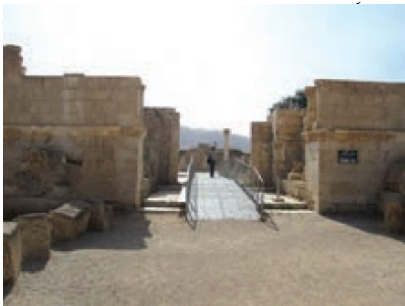
بقایای کاخ هشام بن عبدالملک در اریحا

درباره ارتباط میان عدم مشروعیت و مقبولیت نداشتن حکومت‌ها با توسل آنها به زور و خشونت گفت‌وگو نمایید.