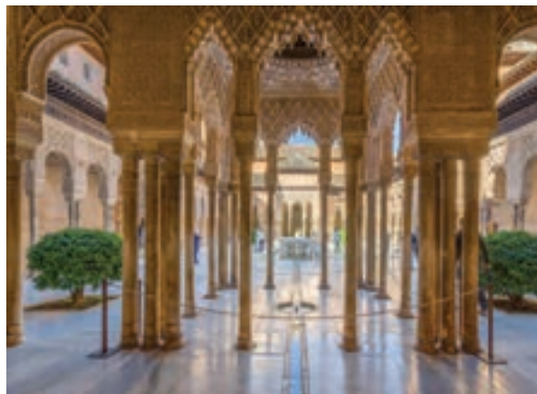
کاخ الحمراء - غرناطه