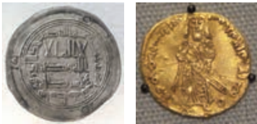
نمونه‌ای از سکه‌های دوره امویان

خلفای اموی بیت‌المال مسلمانان را همچون خزانه شخصی تلقی می‌کردند و در توزیع درآمدهای عمومی، بیشتر منافع شخصی، خاندانی، قبیله‌ای و قومی خود را در نظر داشتند. برای مثال، امویان شیوه توزیع مساوی عطایا میان مسلمانان را که علی علیه السلام بنا نهاده بود، تغییر دادند و سهم به مراتب کمتری برای مسلمانان غیرعرب یا موالی در نظر گرفتند. همچنین در زمان برخی از خلفای اموی برای جبران کمبود مالی، برخلاف تأکید صریح اسلام از نومسلمانان در خراسان و مناطق دیگر جزیه گرفته شد.