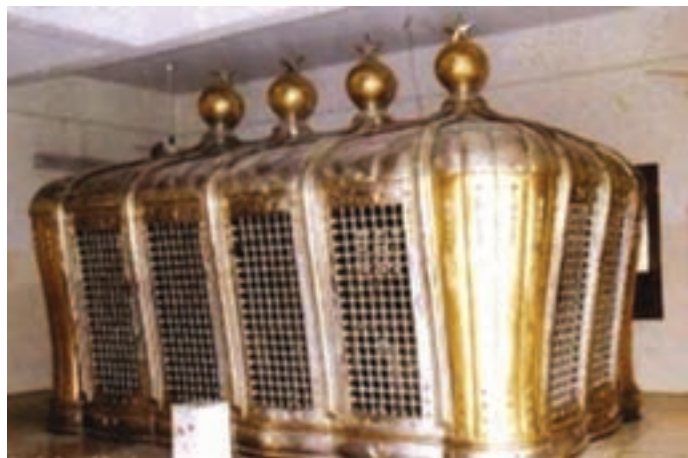
بارگاه و ضریح امامان شیعه در قبرستان بقیع پیش از تخریب