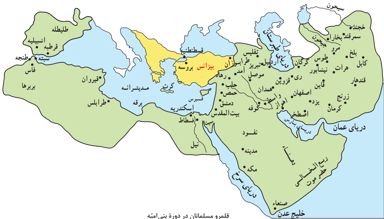
قلمرو مسلمانان در دوره بنی امیه