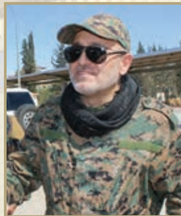
شهید مصطفی بدرالدین از حزب الله لبنان