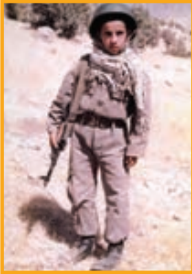
شهید مرحمت بالا زاده