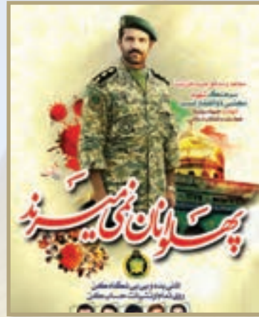
شهید مجتبی ذوالفقار نسب فرمانده تکاواران ارتش جمهوری اسلامی