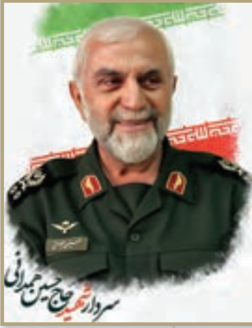
شهید حاج حسین همدانی مستشار ارشد سپاه پاسداران انقلاب اسلامی