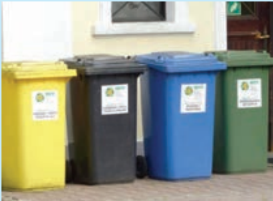
سطل‌های تفکیک زباله در حیاط خانه‌ها - آلمان

آلمان رتبه نخست را در بازیافت زباله در جهان کسب کرده است و بیش از ۶۵ درصد زباله‌های تولیدشده در این کشور بازیافت می‌شود. ● شهرداری به هر خانه چند سطل با رنگ‌های متفاوت داده است. افرادی که خانه‌های ویلایی دارند، سطل‌ها را در حیاط خانه قرار می‌دهند. به مجتمع‌های آپارتمانی سطل‌های بزرگ داده می‌شود. سپس با توجه به حجم زباله و تعداد اعضای خانواده برنامه‌ای تنظیم می‌شود و در روزهای معینی از هفته کارکنان پسماند به خانه‌ها مراجعه و سطل‌هایشان را در ماشین‌های مخصوص حمل خالی می‌کنند. خانواده‌ها باید زباله‌های خود را تفکیک کنند و شیشه،