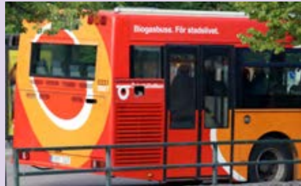
اتوبوس و قطاری که با انرژی زیست‌گاز (بیوگاز) کار می‌کند - سوئد

در برخی کشورها مانند ژاپن، سنگاپور و کره جنوبی، ریختن و پرت کردن آشغال در خیابان و محیط، جریمه زیادی دارد. در سنگاپور میزان این جریمه ۱۰۰۰ دلار و حتی زندان است.