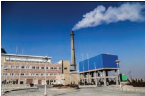
اولین نیروگاه زباله‌سوز تولیدکننده برق در کشور ما، نیروگاه آرادکوه کهریزک در تهران است که در سال ۱۳۹۳ به بهره‌برداری رسید و ظرفیت تولید کنونی آن ۳ تا ۵ مگاوات برق ساعت از ۲۰۰ تن زباله است.