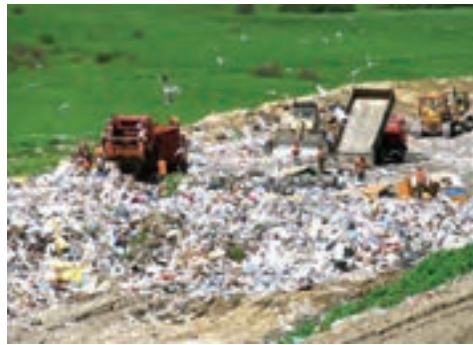
یک گورستان زباله در لهستان - زباله‌ها در اینجا تخلیه شده‌اند تا به طور بهداشتی دفن شوند.