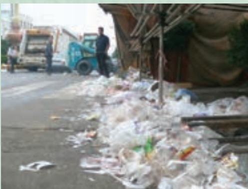
بخش ظروف یک‌بار مصرف در خیابان