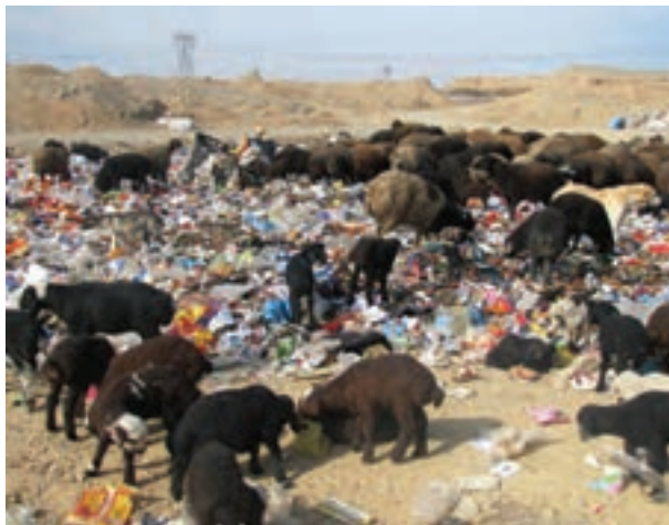
پراکنده شدن زباله‌ها در محیط، موجب ورود آلودگی‌ها به چرخه غذایی می‌شود.

همچنین نیروگاه‌های زیست‌گاز (بیوگاز) با استفاده از گاز حاصل از زباله‌هایی که منشأ زیستی دارند، برق و گرما تولید می‌کنند. در ایران، نیروگاه‌های زیست‌گاز شیراز و مشهد نمونه‌ای از این نیروگاه‌هاست.