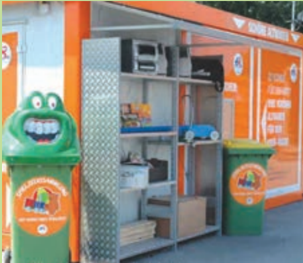
در وین بازارهای اجناس دست دوم برپا می‌شود. روی تابلوی این بازارها شعار «کهنه است ولی هنوز خوب است» نوشته شده است.

کشور اتریش پس از آلمان رتبه مهمی در بازیافت زباله در جهان دارد. وین در سال ۲۰۱۱ برنده جایزه مدیریت پسماند پایدار شد. در این شهر مراکز متعدد جمع‌آوری زباله‌هایی جدا شده برای بازیافت وجود دارد. ۱۱۲ ایستگاه سیار و ثابت، زباله‌های خطرناک را از مردم تحویل می‌گیرند. مدیریت پسماند وین اقداماتی مهم برای کاهش زباله توسط مردم انجام داده است. تولیدکنندگان و مصرف‌کنندگان با شعار «هرچه طبیعی‌تر، زباله کمتر» به استفاده از روش‌های تولید و مصرف کالاهای طبیعی و بسته‌بندی کمتر، تشویق می‌شوند.