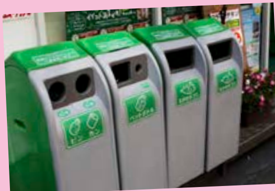
ژاپن به بازیافت اهمیت می‌دهد، زیرا بازیافت زباله‌هایی مانند بطری‌های پلاستیکی نیاز این کشور را به واردات نفت کاهش می‌دهد.