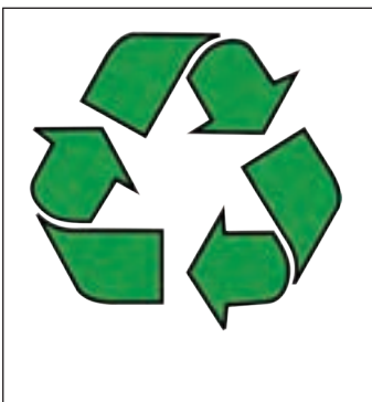
نماد بین‌المللی بازیافت

در کارخانه‌های بازیافت، کاغذهای مصرف‌شده را به خمیر تبدیل می‌کنند و دوباره از آن کاغذ درست می‌کنند. شیشه‌ها، قوطی‌های آلومینیومی، ظروف پلاستیکی و بطری‌های آب و شیر و مانند آن را در کوره‌های بسیار داغ ذوب می‌کنند و در قالب می‌ریزند و یا به ورقه‌هایی تبدیل می‌کنند و سپس از آنها محصولات جدیدی می‌سازند.