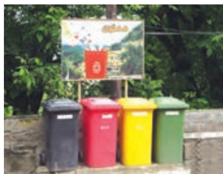
طرح سطل‌های تفکیک زباله در یک شهر، ماسوله