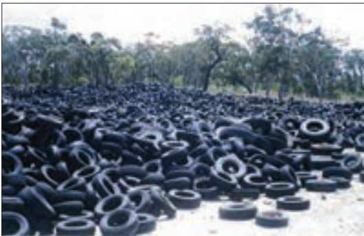
لاستیک‌های فرسوده - استرالیا

زباله، فقط مشکل کشور ما نیست. موضوع دفع زباله‌ها در دنیای امروز یک مسئله بسیار مهم زیست‌محیطی جهانی است که کل سیاره زمین را به‌عنوان تنها سکونتگاه بشر در معرض مخاطره قرار داده است. همه کشورهای اعم از کشورهای پیشرفته صنعتی و کشورهای در حال صنعتی شدن با این مشکل روبه‌رو هستند.