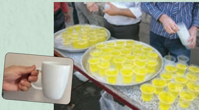
بهبتر است از لیوان‌های یک‌بار مصرف استفاده نکنیم و در ایام ویژه، لیوانی همراه خود داشته باشیم و بخواهیم شربت نذری را در لیوان بریزند.