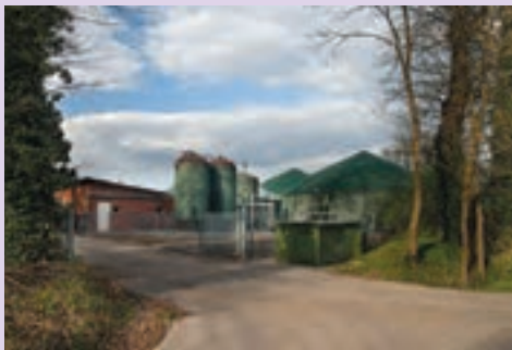
واحد تولید بیوگاز در یک روستا که برق تولید می‌کند. - آلمان

کشور اتریش پس از آلمان رتبه مهمی در بازیافت زباله در جهان دارد. وین در سال ۲۰۱۱ برنده جایزه مدیریت پسماند پایدار شد. در این شهر مراکز متعدد جمع‌آوری زباله‌هایی جدا شده برای بازیافت وجود دارد. ۱۱۲ ایستگاه سیار و ثابت، زباله‌های خطرناک را از مردم تحویل می‌گیرند. مدیریت پسماند وین اقداماتی مهم برای کاهش زباله توسط مردم انجام داده است. تولیدکنندگان و مصرف‌کنندگان با شعار «هرچه طبیعی‌تر، زباله کمتر» به استفاده از روش‌های تولید و مصرف کالاهای طبیعی و بسته‌بندی کمتر، تشویق می‌شوند.