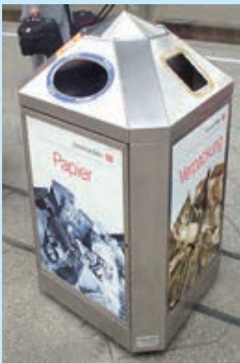
یک سطل زباله سه‌وجهی در ایستگاه قطار در آلمان، هر بخش مخصوص یک نوع زباله است.

آلمان رتبه نخست را در بازیافت زباله در جهان کسب کرده است و بیش از ۶۵ درصد زباله‌های تولیدشده در این کشور بازیافت می‌شود. ● شهرداری به هر خانه چند سطل با رنگ‌های متفاوت داده است. افرادی که خانه‌های ویلایی دارند، سطل‌ها را در حیاط خانه قرار می‌دهند. به مجتمع‌های آپارتمانی سطل‌های بزرگ داده می‌شود. سپس با توجه به حجم زباله و تعداد اعضای خانواده برنامه‌ای تنظیم می‌شود و در روزهای معینی از هفته کارکنان پسماند به خانه‌ها مراجعه و سطل‌هایشان را در ماشین‌های مخصوص حمل خالی می‌کنند. خانواده‌ها باید زباله‌های خود را تفکیک کنند و شیشه،