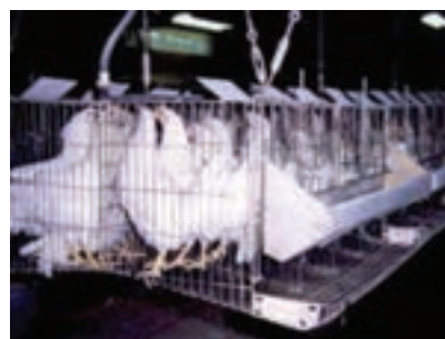
تصویر ۴-۲- قفس مرغ تخم‌گذار