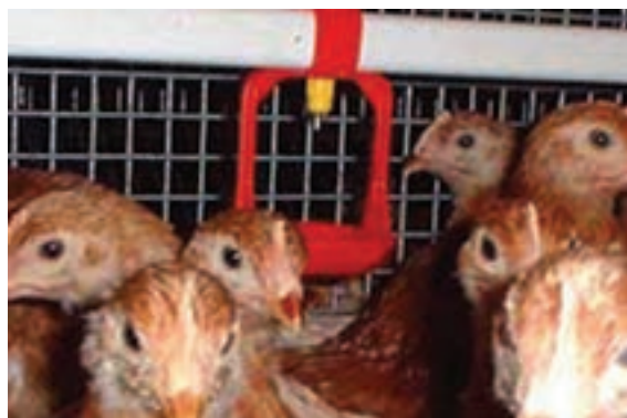
تصویر ۱۰-۴- انواع آب‌خوری چکه‌ای