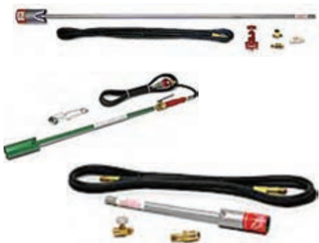
تصویر ۴-۶ - انواع لوله‌ی حامل افشانک و افشانک

افشانک: ریز و پخش کردن سم وظیفه‌ی اصلی افشانک است. افشانک قسمت مهم دستگاه‌های سم پاش محسوب می‌شود و از چهار قسمت اصلی بدنه، درپوش، نُک و صافی تشکیل می‌شود. نُک قابل تعویض است و سم را با ظرفیت‌های متفاوتی و با اشکال گوناگون پخش می‌کند. (تصاویر ۴-۶ و ۵-۶)