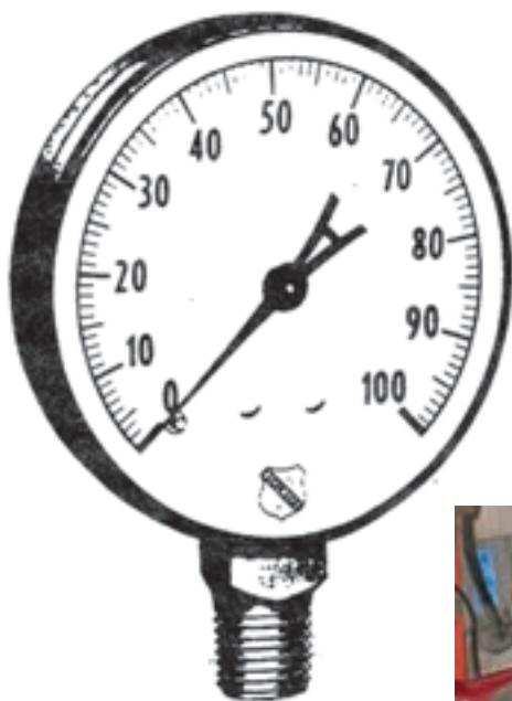
تصویر ۳-۶- فشارسنج

لوله های فلزی و لاستیکی انتقال: این لوله ها سم را در دستگاه سم پاش انتقال می دهند. در انتخاب لوله ها دقت کنید. زیرا فشار سم در قسمت های مختلف دستگاه متفاوت است و آن ها باید به اندازه ای قوی باشند که بتوانند در مقابل فشار زیاد مقاومت کنند.