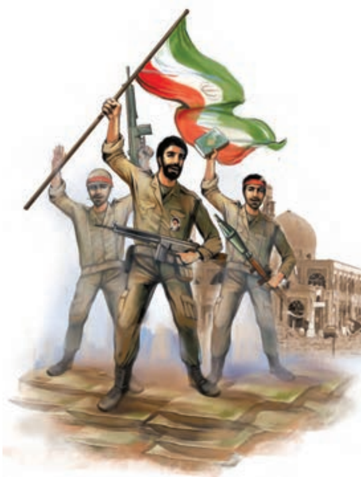
آزاد سازی خرمشهر

با توجه به این دو تصویر درباره‌ی یاری رساندن خداوند به رزمندگان اسلام، گفت و گو کنید.