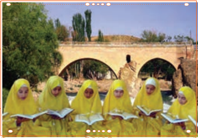
انس با قرآن کریم در استان چهارمحال و بختیاری

با راهنمایی آموزگار خود پس از آوردن قرآن کریم از دفتر مدرسه، آن را به صورت تصادفی باز کنید و از روی آن بخوانید.