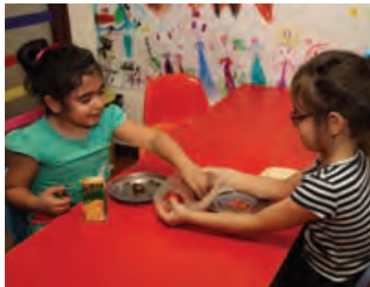
شکل ۲- مهارت‌های اجتماعی کودک

فعالیت ۶: در گروه‌های کلاسی در مورد پیام‌های شکل ۲ و عوامل مؤثر در ارتباط کودک با کودک گفت‌وگو کنید و نتیجه را در کلاس ارائه دهید.