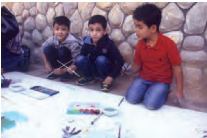
شکل ۱۲- نقاشی گروهی کودکان

۸ گردش علمی: این روش برای مهارت‌های مربوط به شناخت محیط مؤثر است. در این روش علاوه بر شناخت محیط، با افراد گوناگون آشنا می‌شود و راه‌هایی برای برقراری ارتباط مناسب با دیگران می‌آموزد. در این زمینه می‌توانید گردش‌های علمی زیر را برای کودکان تدارک ببینید (شکل ۱۳):