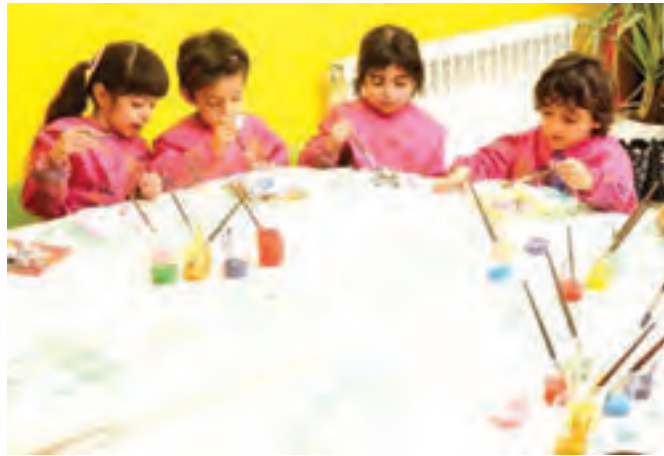
شکل ۱۸- مشارکت در انجام یک فعالیت گروهی

فعالیت ۲۶: به نظر شما برای موفقیت در والیبال هنرستان هرکدام از بازیکنان برای مشارکت گروهی مطلوب چه اصولی را باید رعایت کنند؟ با دوستان خود در این مورد گفت‌وگو کنید و نتیجه را در کلاس ارائه دهید.