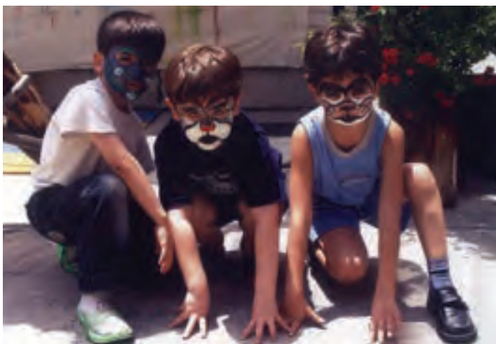
شکل ۸- نمایش کودکان