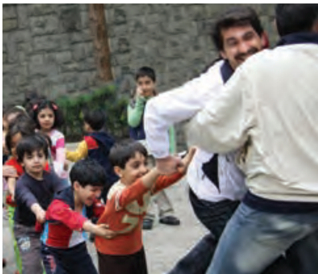
شکل ۱۳- گردش علمی کودکان به همراه والدین و مربیان