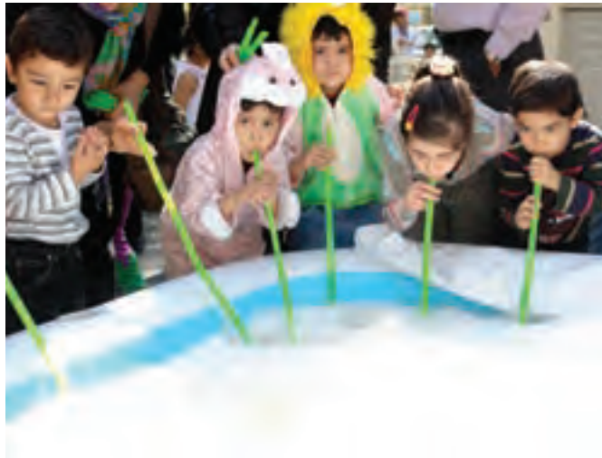
شکل ۱۶- مشارکت کودکان با یکدیگر

بسیاری از کارشناسان و اندیشمندان و متفکران کشورمان به این نتیجه رسیده‌اند که حل بسیاری از معضلات جامعه جهانی با مشارکت سازمان‌ها و جوامع امکان‌پذیر است.