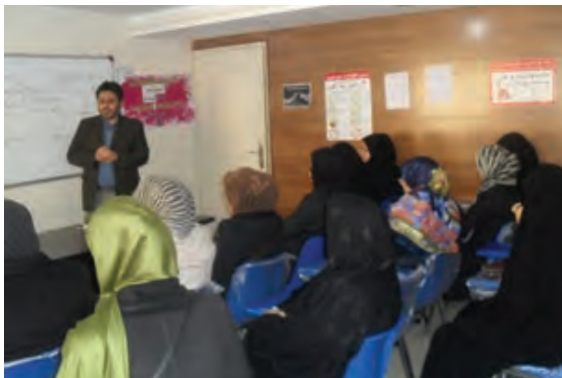
شکل ۲۱- برگزاری کارگاه آموزشی والدین