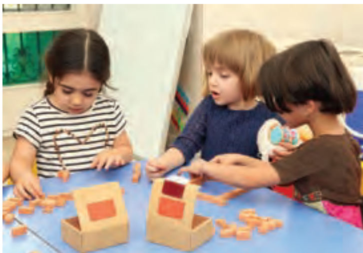
شکل ۱۴- مشارکت کودکان