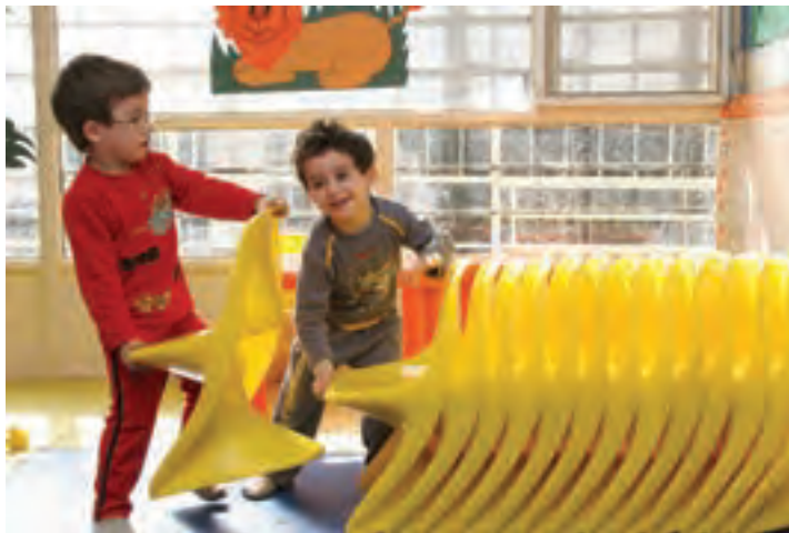
شکل ۴- پیام‌های مهارت‌های اجتماعی

فعالیت ۸: در گروه‌های کلاسی با توجه به تصویر بالا به سؤالات زیر پاسخ دهید و نتیجه را در کلاس ارائه دهید: