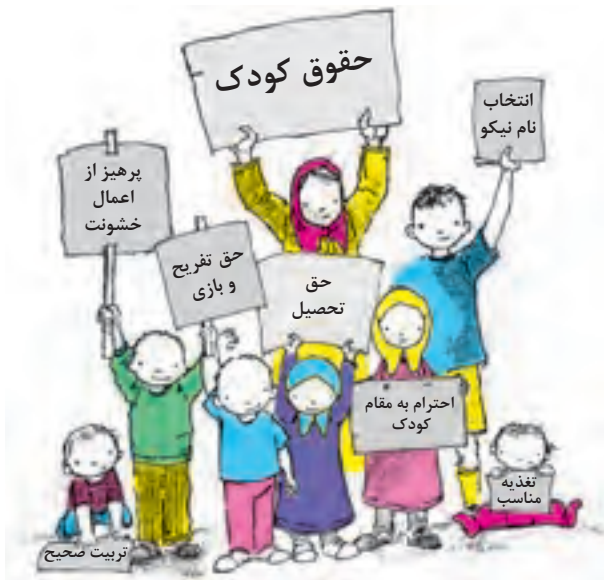
شکل ۲۰- حقوق کودکان در اسلام

اسلام، بیش از مکتب‌های دیگر، برای کودکان، حقوق قائل شده است، زیرا با رعایت این حقوق، آینده کشور با وجود انسان‌های شایسته، تضمین خواهد شد. در آموزه‌های آسمانی اسلام، همه کودکان از دختر و پسر، حقوق و مزایای معینی دارند و همگان از اعمال هرگونه خشونت و بی‌رحمی در حق آنان باز داشته شده‌اند. جالب اینکه این حمایت‌ها از حقوق کودکان، زمانی مطرح شده که هیچ نهاد، سازمان یا کنوانسیون بین‌المللی برای دفاع از حقوق کودکان وجود نداشته است. اسلام با در نظر گرفتن همه نیازهای اولیه جسمی، روحی و روانی کودکان و دفاع از آن، زمینه را برای رشد و پیشرفت آنان در همه جنبه‌ها فراهم آورده است (شکل ۲۰) از جمله این حقوق می‌توان به موارد زیر اشاره کرد: