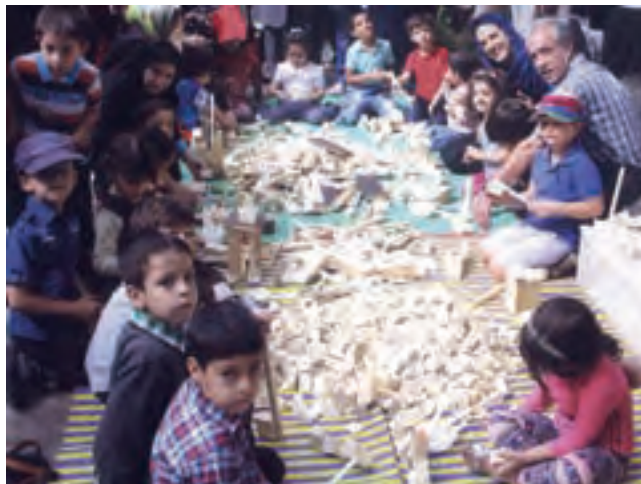
شکل ۱۷- فعالیت مشارکتی

۶ ت: تعادل در تقسیم کار: با تقسیم کار بین کودکان برای انجام فعالیت مشارکتی، شرح وظایف کودکان مشخص‌تر و تخصصی‌تر می‌شود، تداخل کاری به وجود نمی‌آید و توازن کار بین کودکان ایجاد می‌شود (شکل ۱۷).