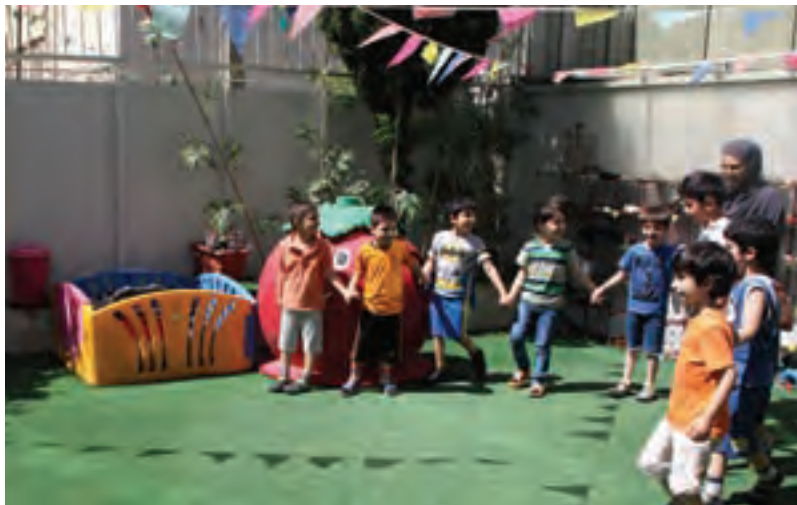
شکل ۶- مهارت‌های بین فردی کودکان

فعالیت ۱۱: علی کودکی ۵ ساله است و ویژگی‌های رفتاری زیر را دارد: