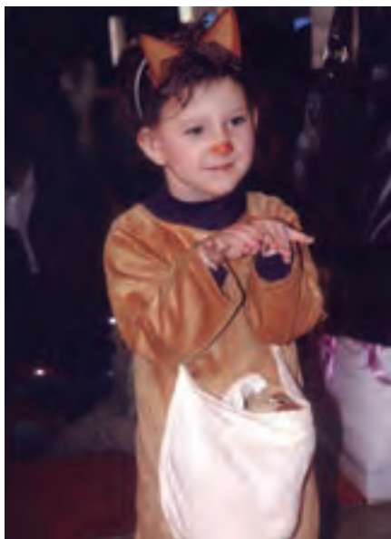
شکل ۹- شعرخوانی کودک

۵ بازی: از طریق بازی می‌توان مهارت‌هایی مانند فعالیت گروهی، تعاون، رعایت نوبت، مشارکت در وسایل بازی و پیروی از مقررات را به کودکان آموخت و از این طریق ارتباطی مؤثر با کودک برقرار کرد. فعالیت‌های پیشنهادی زیر در این زمینه می‌تواند مؤثر باشد (شکل ۱۰):