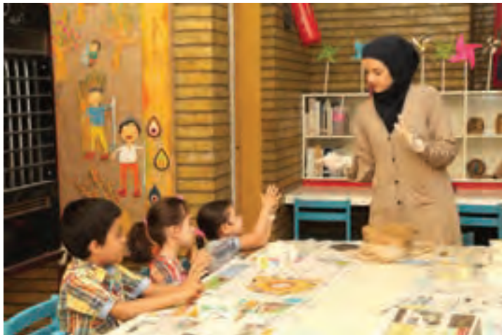
شکل ۱۹- فعالیت مشارکتی مربی با کودکان

۶ برنامه‌ریزی برای کودکان در انجام امور مرکز یا کلاس: دادن فرصت به کودکان در انجام امور مختلف کلاس می‌تواند باعث برانگیختن آنها برای مشارکت در فعالیت‌های آموزشی شود (شکل ۱۹).