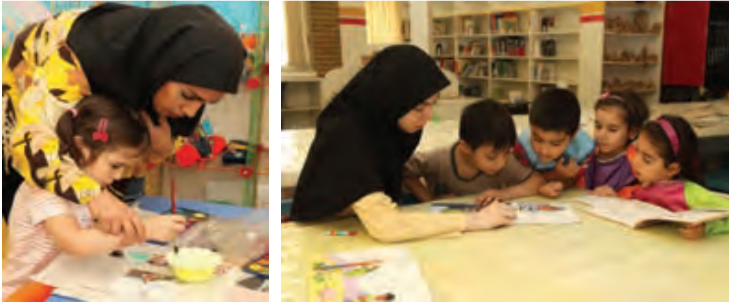
شکل ۱- ارتباط مربی با کودک

فعالیت ۱: در گروه‌های کلاسی با توجه به تصاویر بالا در مورد نقش ارتباط مربی با کودکان گفت‌وگو کنید و نتیجه را در کلاس ارائه دهید.