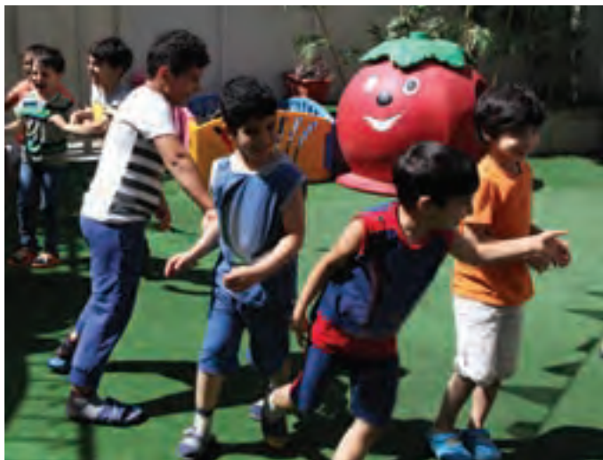
شکل ۱۰- بازی کودکان با یکدیگر