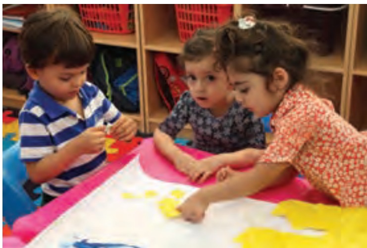
شکل ۱۱- درست کردن کار دستی