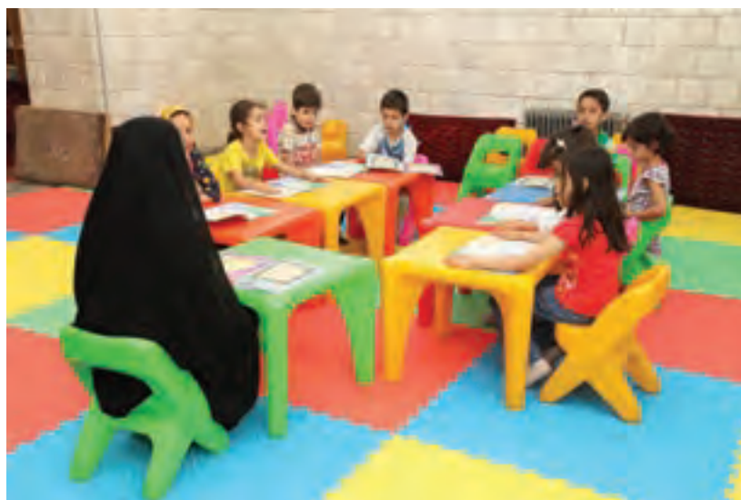
شکل ۷- فراهم کردن فرصت برای سخن گفتن کودک

■ به جای پاسخ «بله» یا «خیر»، با جملات بلند احساسات خود را به مربی یا مراقب بگویند. (شکل ۷)