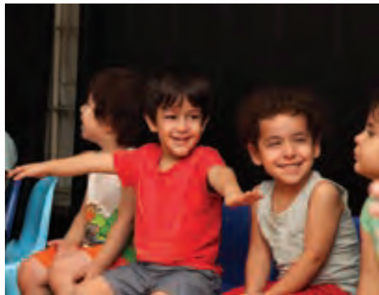
شکل ۱۵- بازی مشارکتی کودکان

فعالیت ۱۹: در گروه‌های کلاسی، هر کدام یک نمونه از فعالیت مشارکتی را که در گذشته تجربه کرده‌اید بیان کنید و دلایل رضایت و یا نارضایتی خود را از این فعالیت مشارکتی، در کلاس ارائه دهید.