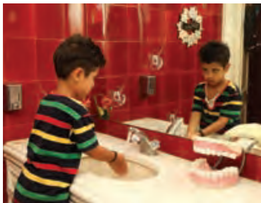
شکل ۳- مهارت‌های اجتماعی