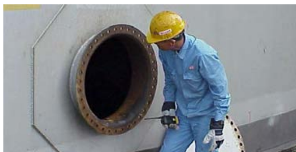
شکل ۱۹-۴- دریچه آدم رو مخزن

دریچه آدم رو: هر مخزن ذخیره می‌بایست دارای دریچه آدم‌رو باشد تا برای پاک‌سازی و تعمیرات از طریق آن وارد مخزن شد (شکل ۱۹-۴). تعداد این دریچه‌ها برای بدنه و سقف به قطر مخزن بستگی دارد؛ به عنوان مثال، یک دریچه آدم‌رو در سقف برای مخازن تا قطر ۲۰ متر، و دو دریچه برای قطر بالاتر از ۲۰ متر الزامی است.