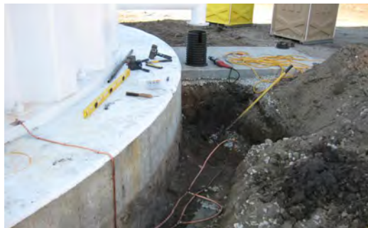
شکل ۴-۲۳ تخلیه الکتریسیته ساکن بدنه مخزن به زمین

خطر الکتریسیته ساکن در مخزن: هنگام انتقال مواد نفتی و قابل احتراق، اصطکاک مایعات هنگام جریان در خط لوله و پخش شدن مایعات به قطرات کوچک، باعث بارور شدن مخزن می‌گردند. در این حالت، حتی جرقه کوچکی در حضور بخارات نفتی و هوای موجود درون مخزن باعث ایجاد انفجار و آتش‌سوزی می‌شود. به همین علت می‌بایست مخزن‌ها با سیم به زمین متصل گردد تا بار الکتریسیته ساکن از مخزن به زمین هدایت شود (شکل ۴-۲۲).