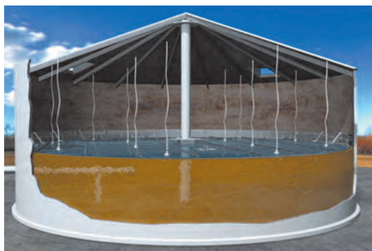
۴-۱۸ مخازن سقف شناور درونی

در مخازن سقف شناور بیرونی، سقف در معرض هوای آزاد قرار دارد و در صورت بارش باران و برف، روی سقف قرار می‌گیرند. در این حالت می‌بایست مسیر تخلیه روی سقف تعبیه گردد تا آب باران و همچنین آبی که برای شست‌وشوی سقف استفاده می‌شود، از طریق لوله‌هایی به روی زمین هدایت گردد.