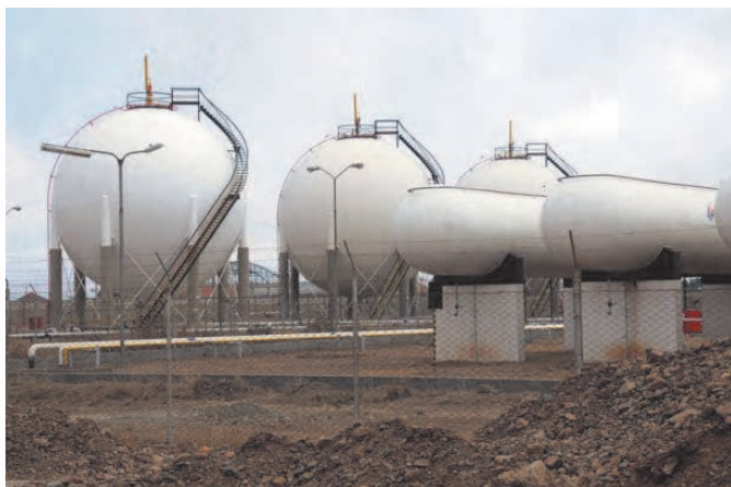
۴-۱۵ مخازن تحت فشار

می‌شوند که تحت فشار مایع قرار دارند. (شکل ۱۵-۴).