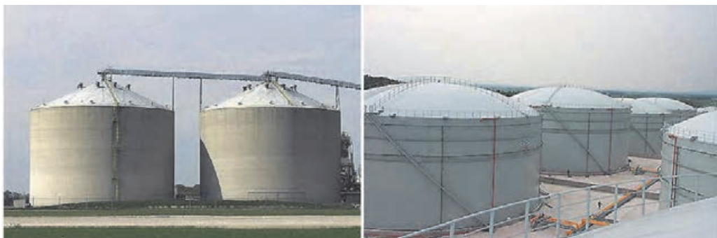
۴-۱۶ مخازن سقف ثابت، سمت راست: سقف گنبدی. سمت چپ: سقف مخروطی

انتخاب قطر و ارتفاع این مخازن به ظرفیت مورد نیاز برای ذخیره‌سازی و میزان فضای در دسترس برای نصب، بستگی دارد.