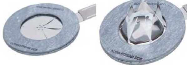
شکل ۲۱-۴ دیسک شکست

دیسک شکست ۳ : دیسک شکست قسمتی از سقف مخزن است که ضعیف‌تر از سایر قسمت‌های سقف ساخته می‌شود. اگر به هر دلیلی فشار مخزن ذخیره‌سازی بالا یا پایین رود و شیر اطمینان عمل نکند، دیسک شکست پاره شده و فشار درون مخزن به حالت عادی برمی‌گردد (شکل ۲۱-۴).