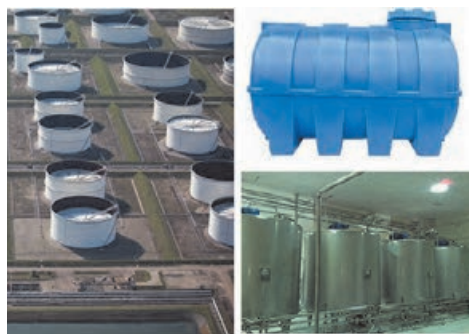
شکل ۱۴-۴ مخازن استوانه‌ای کم فشار

برای دسته‌بندی مخازن معیارهای مختلفی وجود دارد از قبیل شکل هندسی (استوانه‌ای یا کروی)، نوع سیال (مایع یا گاز) و فشار بخار ماده. مخازن به صورت روباز و سقف‌دار ساخته می‌شوند. مخازن بدون سقف در صورتی استفاده می‌شوند که امکان ذخیره‌سازی ماده‌ای، مانند آب، در آن وجود داشته باشد. (شکل ۱۳-۴).