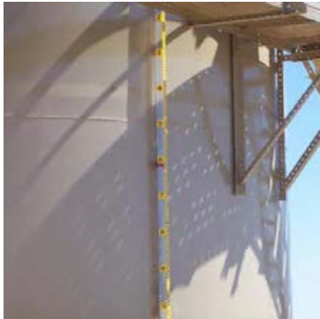
شکل ۲۰-۴ ارتفاع سنج مغناطیسی روی مخزن

هنگام ورود به مخزن، مطمئن باشید که جریان هوا درون مخزن برقرار است، به عنوان مثال باید چند دریچه آدم رو باز باشد تا هوا درون مخزن جریان یابد. تا هنگام فعالیت درون مخزن با مشکلات تنفسی مواجه نشوید.