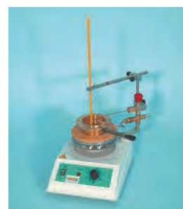
ج) دستگاه روباز