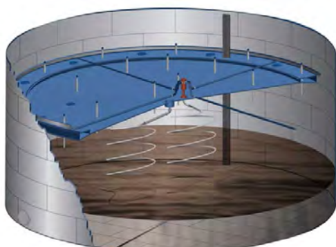
۴-۱۷ مخازن سقف شناور بیرونی

این نوع مخازن برای ترکیباتی که دارای نقطه اشتعال پایین یا فشار بخار بالا هستند، مثل بنزین، کاربرد دارند. این نوع مخازن به دو صورت مخازن سقف شناور بیرونی (شکل ۴-۱۷) و سقف شناور درونی (شکل ۴-۱۷) استفاده می‌شوند.