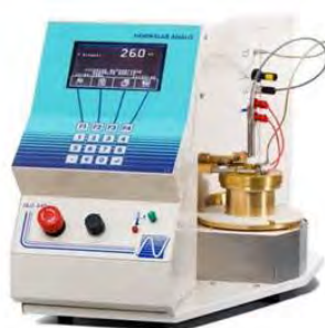
ب) دستگاه (اتوماتیک) روباز