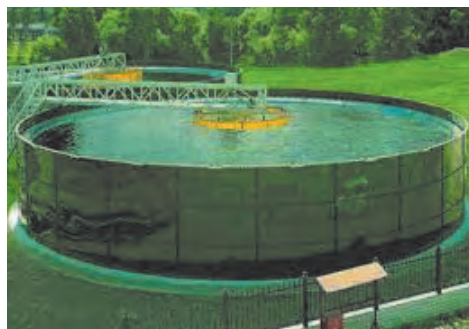
شکل ۱۳-۴ مخزن ذخیره‌سازی بدون سقف