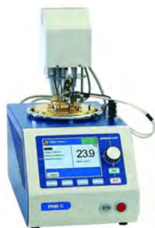
الف) ظرف سربسته