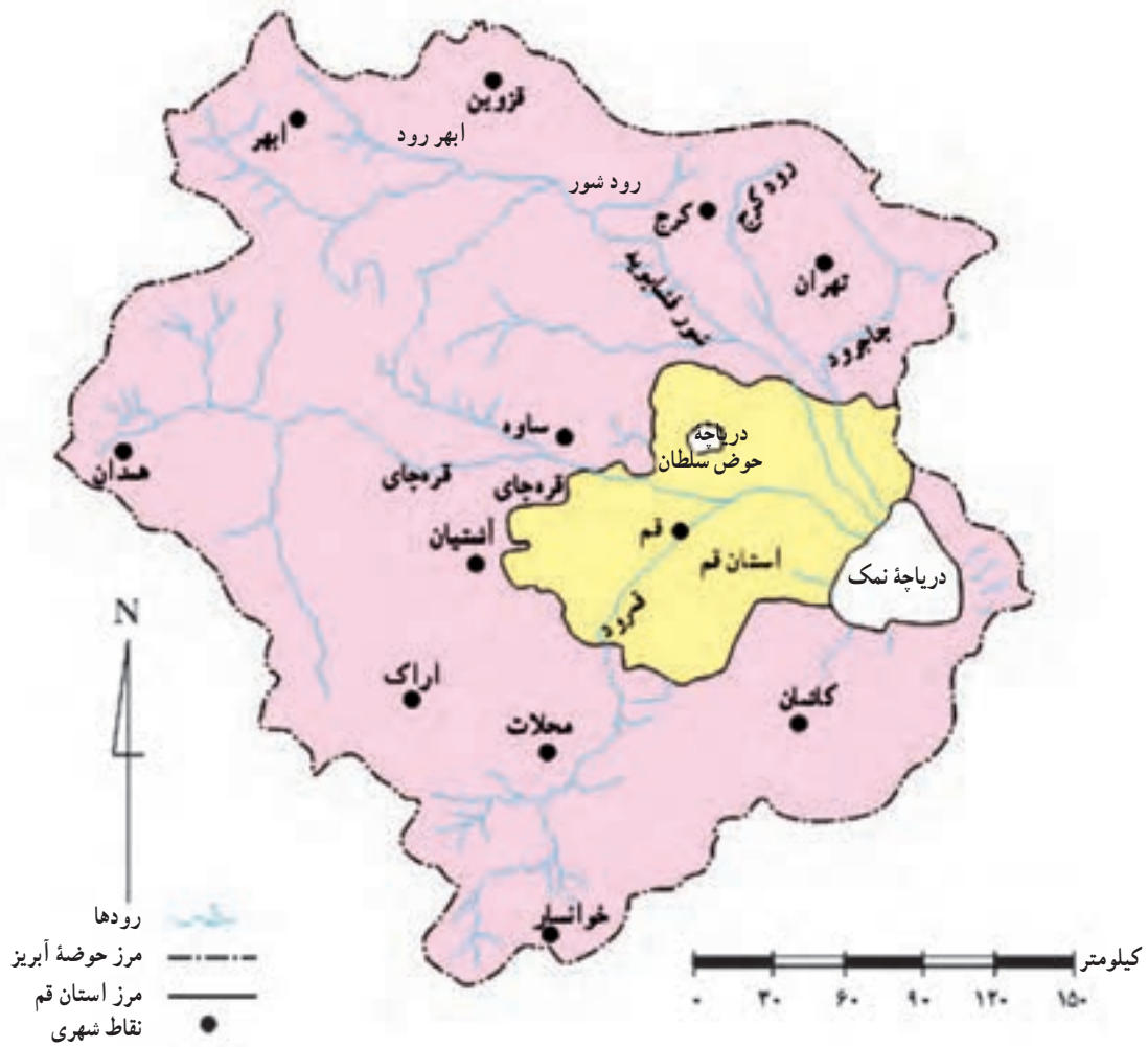
شکل ۱۲-۱- نقشه حوضه آبریز دریاچه نمک

به شکل ۱۲-۱ توجه کنید. در استان قم، دو رود اصلی قمرود و قره‌چای و چندین رود فرعی جریان دارد. رودهای فرعی به طور مستقیم یا غیرمستقیم به رودهای اصلی استان وارد می‌شوند. در اینجا به بررسی رودهای اصلی می‌پردازیم: