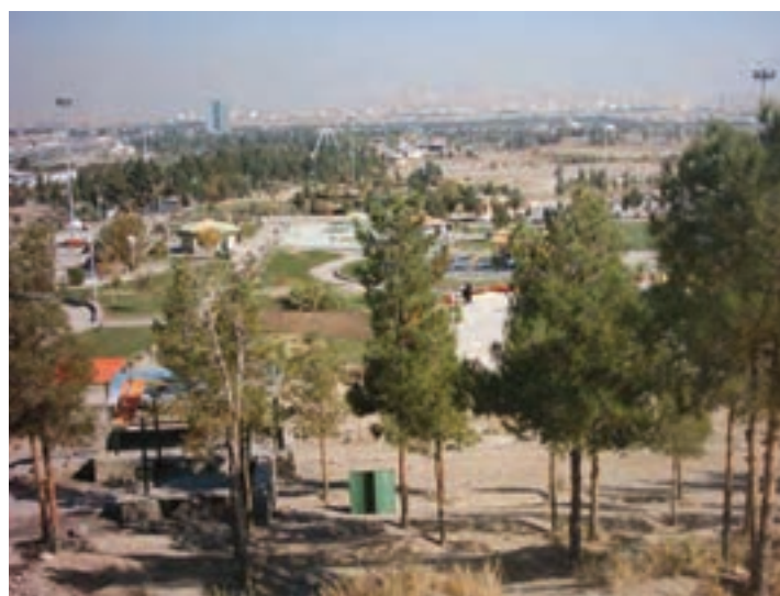
شکل ۱۹-۱- پارک جنگلی علوی

۱- جنگل‌های دست کاشت: جنگل‌هایی اند که منشأ طبیعی نداشته و به دست انسان ایجاد شده‌اند. مساحت جنگل‌های دست کاشت در استان قم ۴۱۳۶ هکتار است. جنگل‌های دست کاشت شامل پارک‌های جنگلی دست کاشت و تاغزارهای استان می‌باشند. الف) پارک‌های جنگلی دست کاشت: به مناطقی گفته می‌شود که با جمع‌آوری گونه‌های گیاهی متنوع و مناسب و به منظور بازسازی محیط‌های تخریب شده و با ایجاد محیط‌های جنگلی تحت مدیریت تفریحی قرار می‌گیرد. مهم‌ترین پارک‌های جنگلی استان قم عبارت‌اند از: ۱- پارک جنگلی علوی (کیلومتر ۵ جاده قم - نيزار) پارک جنگلی غدیر (کیلومتر ۱۰ جاده قم - نيزار) و پارک جنگلی اسلام‌آباد (کیلومتر ۱۰ جاده قم - سلفچگان)