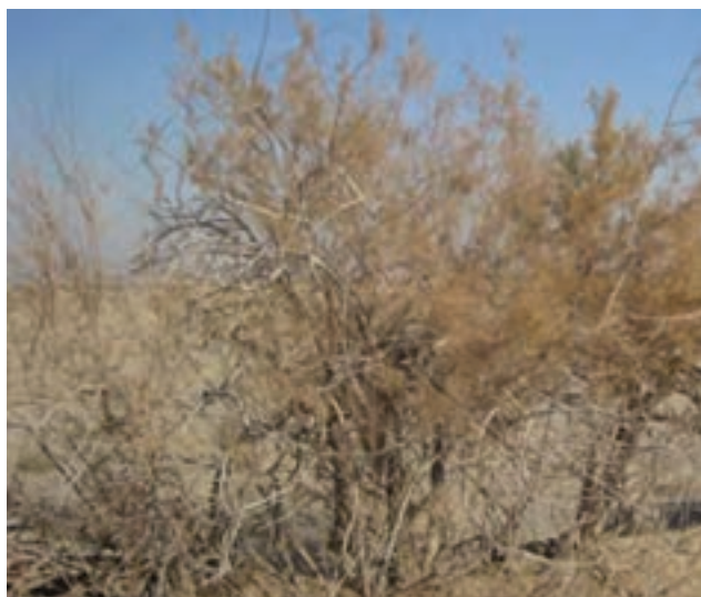
شکل ۲۱-۱- درختچه گز در بستر رود قمرود

۲- بیشه‌زارها و درختچه‌زارها: این مناطق با وسعت ۹۱۲۵ هکتار در سطح استان پراکنده‌اند و شامل رویش‌گاه طبیعی گز است. درختچه‌های گز بیشتر در منطقه مسیله و اطراف رودخانه قره‌چای و رود شور قرار دارند.