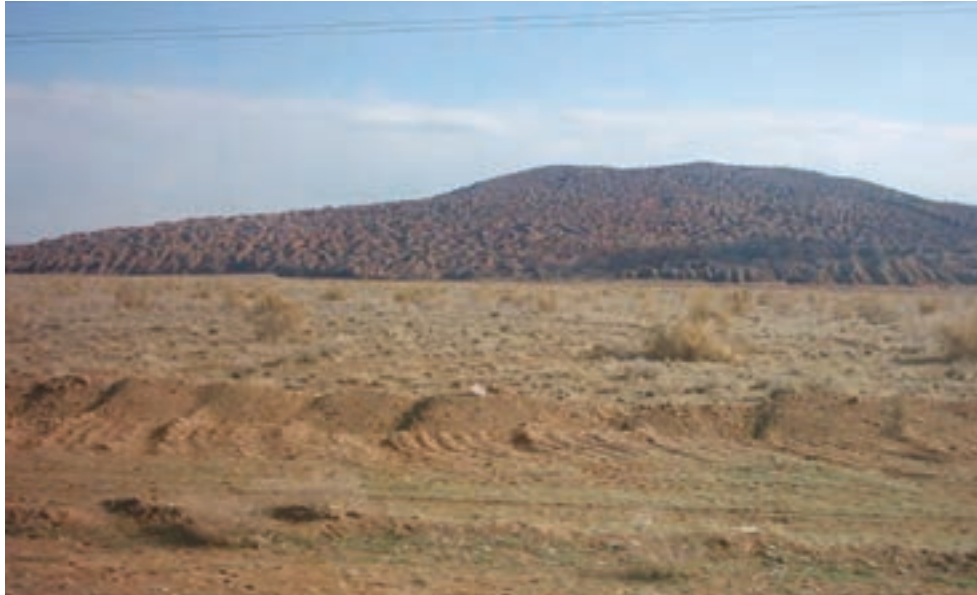
شکل ۳۵-۱- منطقه بیابانی کوه نمک

روش‌های مبارزه با بیابان‌زایی در استان قم