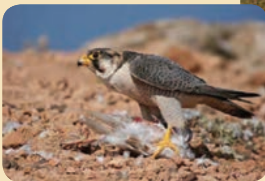
شکل ۲۷-۱- شاهین نماد محیط زیست استان قم