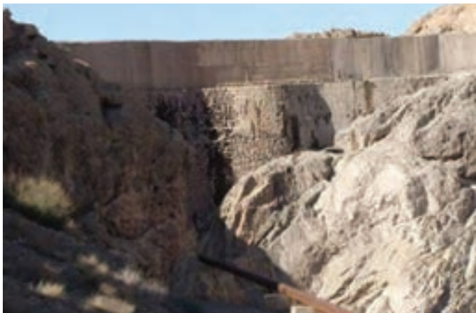
شکل ۱۶-۱- سد کبار

سد کبار در ۲۸ کیلومتری جنوب قم روی رود بیرقان احداث شده و با قدمتی حدود ۷۰۰ سال، قدیمی‌ترین سد قوسی جهان است (شکل ۱۶-۱).