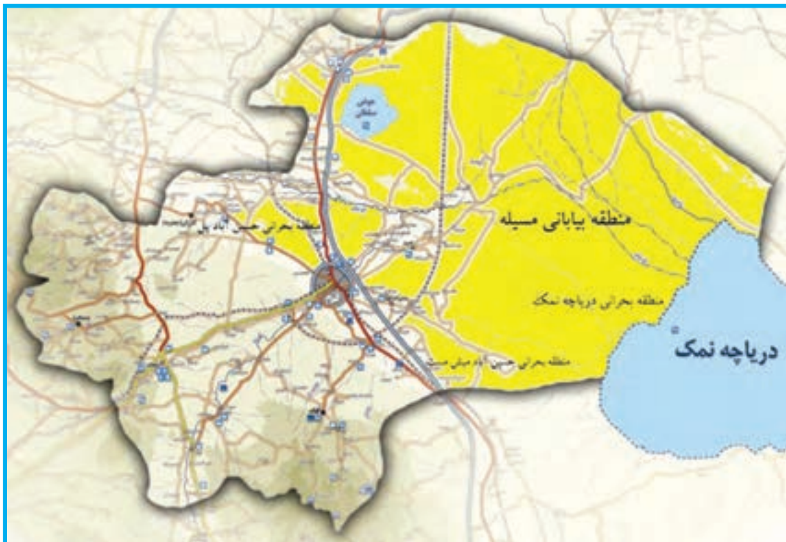
شکل ۱-۳۴- پراکنندگی جغرافیایی مناطق بیابانی استان