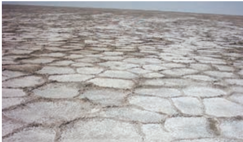
شکل ۱۷-۱- سطح دریاچه نمک قم در فصل تابستان

۱- دریاچه نمک (قم) : دریاچه نمک از نظر موقعیت جغرافیایی در شرق استان قم و در بین سه استان قم، سمنان و اصفهان قرار دارد. تبخیر زیاد سبب شوری شدید آب و ایجاد لایه ضخیمی از نمک در دریاچه شده است. قسمت غرب و شمال غرب دریاچه نمک که رود کرج و جاجرود به آن وارد می‌شود، باتلاقی است. مساحت این دریاچه در حدود ۱۸۰۶ کیلومتر مربع است.