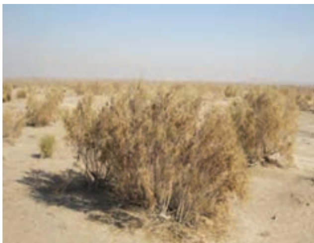
شکل ۲۰-۱- تاغزارهای اطراف حسین‌آباد میش مست

ب) تاغزارها: به منظور جلوگیری از حرکت ماسه‌های روان در منطقه شرق استان قم اقدام به کاشت گونه‌های گیاهی تاغ شده است که بیشتر در اطراف روستای حسین‌آباد میش مست قرار دارند.