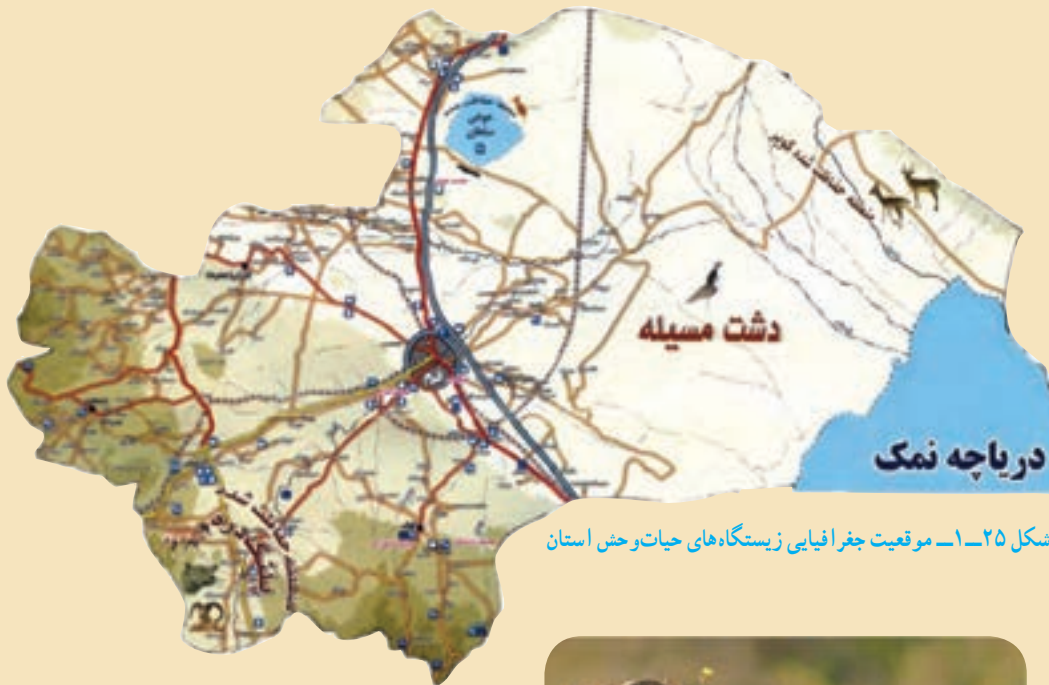
شکل ۲۵-۱- موقعیت جغرافیایی زیستگاه‌های حیات وحش استان

۴- تالاب شکار ممنوع حوض سلطان: این تالاب در شمال استان واقع شده و گونه‌های گیاهی و حیوانی متنوعی دارد. در شورابه‌های این تالاب نوعی میگو به نام «آرمیا» دیده می‌شود.