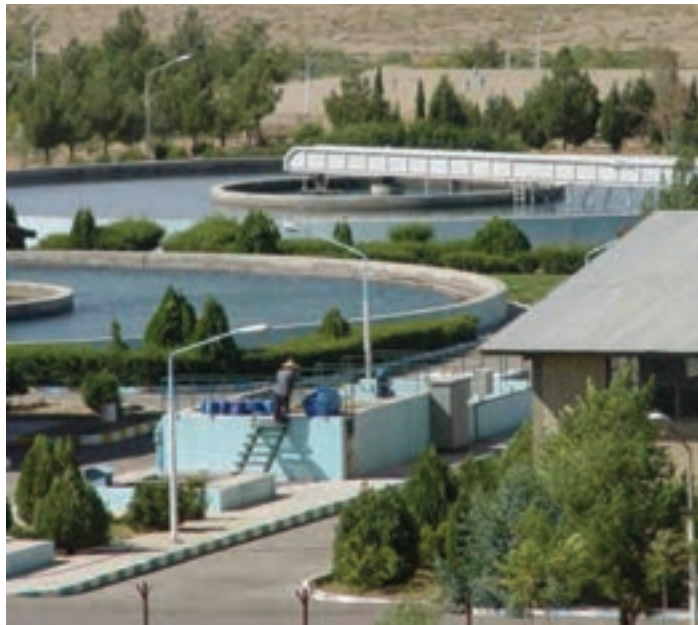
شکل ۳۲-۱- تصفیه‌خانه سد ۱۵ خرداد

«دودهک» احداث شده است. آب تصفیه‌خانه قم از سد ۱۵ خرداد تأمین و توسط لوله به تصفیه‌خانه منتقل می‌شود. در این تصفیه‌خانه، سالانه حدود ۷۰ میلیون مترمکعب آب تصفیه شده به شهر قم منتقل می‌شود (شکل ۳۲-۱).