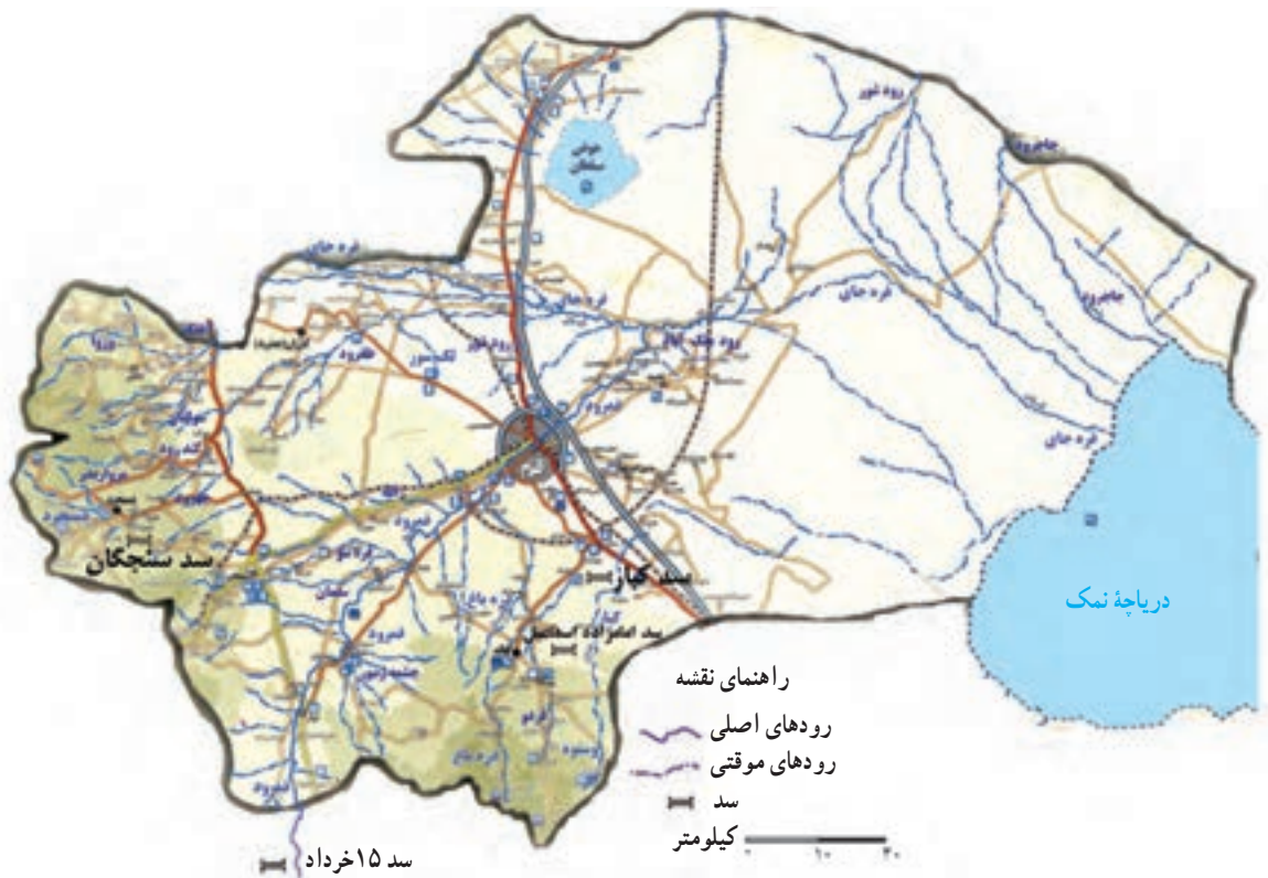
شکل ۱۴-۱- نقشه پراکندگی دریاچه‌ها، سدها و رودهای استان قم