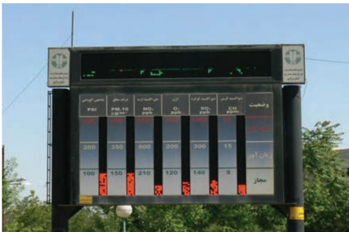
شکل ۳۸-۱- دستگاه نمایش دهنده آلودگی هوا در یکی از میدانی شهر اراک