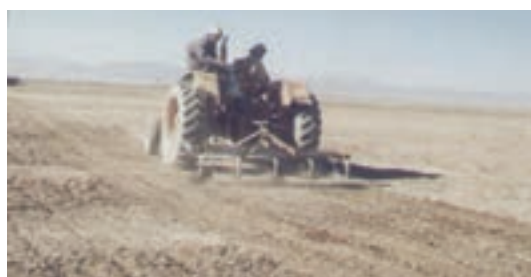
شکل ۲۹-۱- بذرکاری برای احیای مناطق بیابانی و کویری