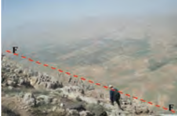
شکل ۱-۶۶- گسل سالوک از گسل‌های فعال استان

آخرین فعالیت گسل‌های استان مربوط به گسل امین آباد، در شمال غرب شهر اسفراین است که منجر به زمین لرزه‌ای با قدرت ۴/۵ درجه در مقیاس ریشتر شد. این زمین لرزه در نیمه شب جمعه ۱۸ آذرماه ۱۳۹۰ بر اثر فعال شدن قسمت شمال غربی این گسل رخ داد. این زلزله خسارات مالی و جانی نداشت ولی سبب ترس و وحشت مردم شد.