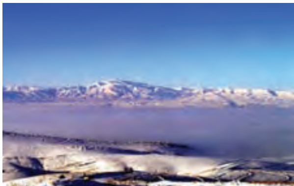
شکل ۱-۷۴- پدیده وارونگی دما در دشت بجنورد

جغرافیایی و محصور شدن برخی از شهرهای استان در میان کوه‌ها و پدیده وارونگی دما، باعث آلودگی هوای استان شده‌اند. در حال حاضر بیش از ۳۰۰ واحد صنعتی در استان مشغول فعالیت هستند. فعالیت این واحدها و شرایط طبیعی برخی از شهرهای استان سبب شده است این شهرها با مشکل آلودگی هوا مواجه شوند.