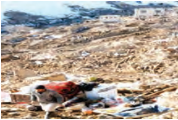
شکل ۱-۶۳- روستای ناوه پس از زلزله

زلزله: زلزله مخرب‌ترین پدیده طبیعی است که همه ساله خسارت‌های جانی و مالی زیادی به انسان‌ها وارد می‌کند. خراسان شمالی از استان‌های زلزله خیز کشور است. به علت فراوانی و طول زیاد گسل‌ها و جوان بودن چین‌خوردگی‌ها در استان، تاکنون زلزله‌های بسیاری در این استان به وقوع پیوسته است. از مخرب‌ترین آنها می‌توان به زمین لرزه‌های سال ۱۳۵۲ دهنه اجاق در شهرستان اسفراین و زلزله ۱۹ بهمن سال ۱۳۷۵ روستای ناوه در شهرستان بجنورد اشاره نمود. هر چند، زلزله‌ها، سبب تخریب ساختمان‌ها می‌شوند ولی رعایت نکات ایمنی در ساختمان سازی می‌تواند تا حدودی از خسارات آن بکاهد. تأثیر این نکته را در مقایسه شکل‌های (۱-۶۲) و (۱-۶۳) می‌توانید به خوبی مشاهده کنید.