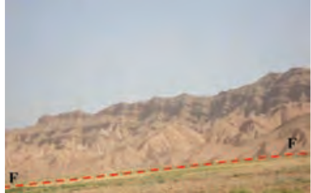
شکل ۱-۶۵- گسل امین آباد از گسل‌های فعال استان

سیل: بعد از زلزله، سیل مخرب‌ترین خطر طبیعی استان به حساب می‌آید. خراسان شمالی از نظر وقوع سیلاب در بین استان‌های کشور جایگاه دوم را دارد.