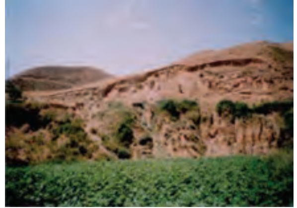
شکل ۷۰-۱- لغزش چرخشی در روستای اترآباد علیای بجنورد

سرمازدگی: به علت قرارگیری استان در مسیر اصلی ورود توده هوای سرد و خشک سیبری، در بعضی از سال‌ها، تشدید فعالیت زبانه این توده هوا در اوایل پاییز (سرمازدگی زودرس) و اوایل بهار (سرمازدگی دیررس)، سبب سرمازدگی ناگهانی محصولات باغی و زراعی شده و خسارات زیادی را به کشاورزان استان وارد می‌کند.