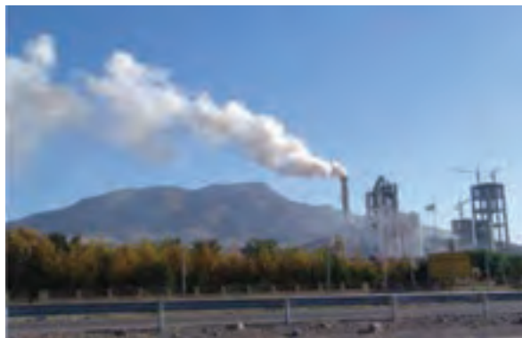
شکل ۱-۷۳- صنایع استان یکی از منابع آلودگی هوا

مسئولیت نظارت بر آلودگی هوا در استان بر عهده سازمان محیط زیست است. این سازمان جهت کاهش آلودگی هوا اقداماتی انجام داده است که از مهم‌ترین آنها می‌توان به موارد زیر اشاره نمود: