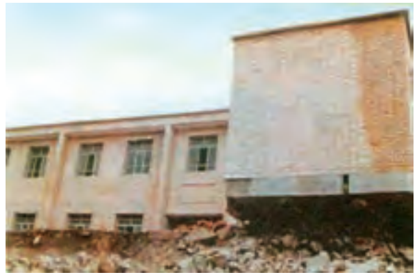
شکل ۱-۶۲- ساختمان دبستان روستای ناوه پس از زلزله