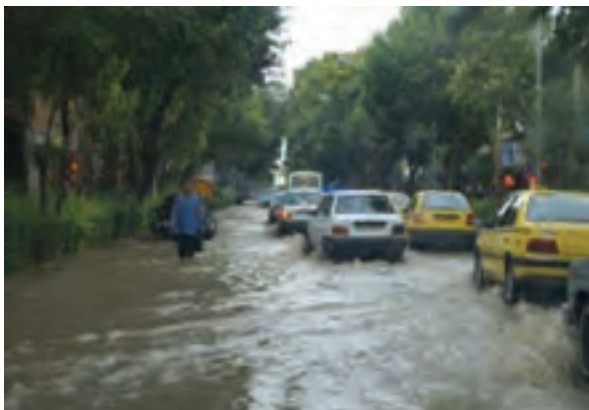
شکل ۱-۶۸- آب‌گرفتگی خیابان‌های شهر بجنورد در سیلاب سال ۱۳۸۷

علل وقوع سیلاب در استان منشأ طبیعی و انسانی دارد. از مهم‌ترین دلایل طبیعی آن می‌توان به ذوب ناگهانی برف و یخ در کوهستان‌ها، بارش‌های رگباری، کم شدن پوشش گیاهی و شیب زمین و از مهم‌ترین عوامل انسانی می‌توان به عدم اعمال مدیریت صحیح در حوضه‌های آبخیز، برداشت غیر اصولی مصالح رودخانه‌ای، تجاوز به حریم رودخانه‌ها، توسعه شهرها و روستاها در عرصه‌های سیل‌گیر اشاره نمود.