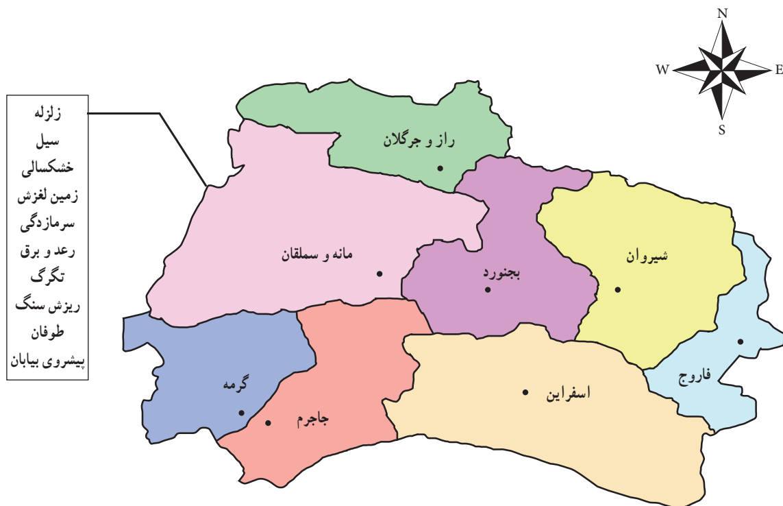
شکل ۶۱-۱- تقسیمات سیاسی استان (۱۳۹۲)