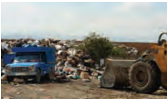
شکل ۷۶-۱- شیوه‌های نامناسب جمع‌آوری، انتقال و دفن زباله در استان