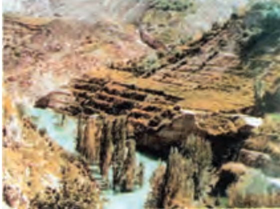
شکل ۷۱-۱- زمین لغزش در روستای اسطرخی شیروان