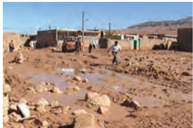
شکل ۱-۶۷- ورود سیلاب‌ها به مناطق مسکونی روستای فرتان اسفراین