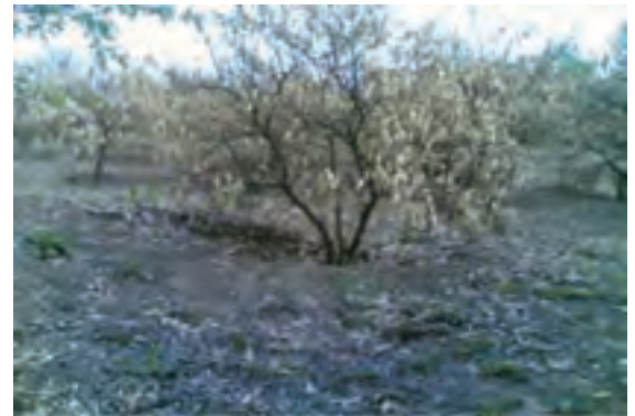
شکل ۷۲-۱- آمار سرمازدگی در باغات استان