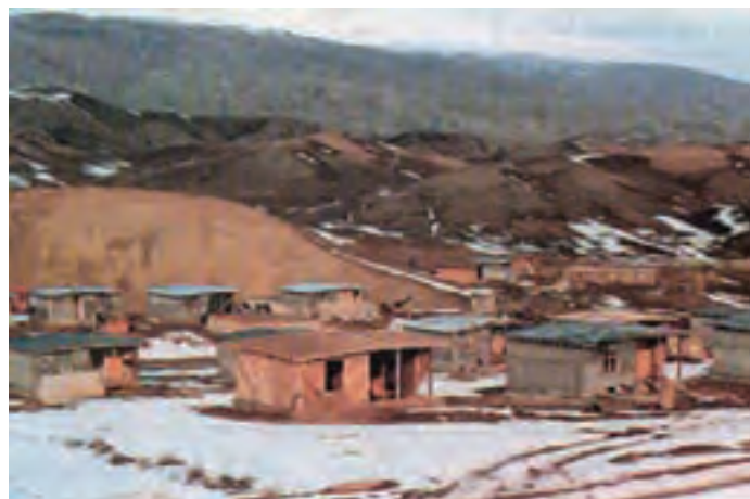
شکل ۱-۶۴- بازسازی روستای زلزله زده توب چنار شهرستان مانه و سملقان با استفاده از اسکلت زوگالی (چوبی)