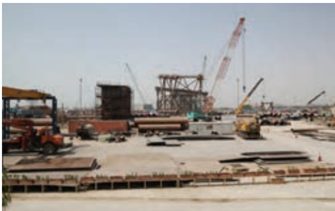
شکل ۷-۸- نمایی از بندر دیر

بندر بوشهر: بوشهر بندری است شبه جزیره‌ای در بخش مرکزی شهرستان بوشهر که از سمت شمال غرب و جنوب به خلیج فارس محدود شده است. این بندر در منطقه ساحلی خلیج فارس واقع شده و به خاطر عواملی مانند صیادی، وجود نیروگاه اتمی، کشتی‌سازی و صادرات رونق اقتصادی دارد.