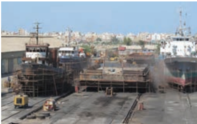
شکل ۷-۷- نمایی از بندر بوشهر

قدیمی ترین نشانه‌های به دست آمده از سکونت انسان در سرزمین بوشهر به دوران حکومت ایلامی‌ها و تمدن بین النهرین برمی‌گردد. منطقه تجاری بوشهر در آن زمان دهکده‌ای به نام لیان بود. از دوره هخامنشیان نیز آثار با ارزشی در شهرستان دشتستان کشف شده است. در زمان اردشیر بابکان شهر رام اردشیر در دو فرسنگی شهر بوشهر بنا گذاشته شد که اکنون به نام ریشهر معروف است. نحوه شکل‌گیری مراکز شهری استان بیانگر استقرار جمعیت و فعالیت‌های اقتصادی وابسته به منابع آب و فعالیت‌های مرتبط با دریا در ساحل می‌باشد. شکل‌گیری این مراکز از شمالی‌ترین نقطه استان تا جنوبی‌ترین آن که عمدتاً بر روی نوار ساحلی، دشت‌ها و کوهپایه‌ها بوده که نشانگر توزیع مناسب آنها از نظر استقرار و فاصله بین این مراکز است. شهر بوشهر به عنوان مرکز استان و دیگر شهرهای ساحلی از دیرباز مراکز تجارت و فعالیت‌های بندری بوده‌اند.