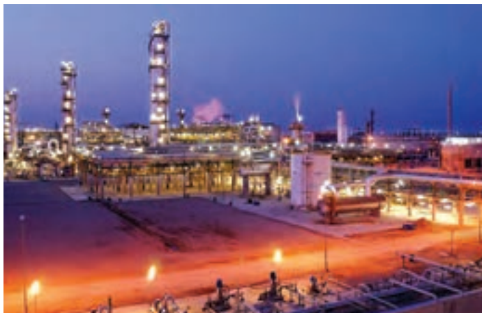
شکل ۹-۷- نمای از بندر عسلویه

بندر عسلویه: این بندر از توابع شهرستان کنگان می‌باشد. عسلویه یک منطقه عظیم صنعتی از توابع استان بوشهر در جنوب ایران است و مهم‌ترین پایگاه اقتصادی ایران و بزرگ‌ترین منطقه تولید انرژی جهان است.