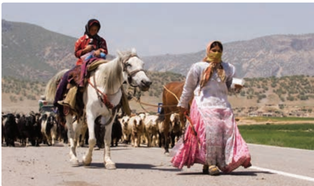
شکل ۱-۷- کوچ عشایر در استان بوشهر

همچنین گستره وسیعی از استان بوشهر قلمرو زیست و محل اسکان دائمی و فعالیت عشایر است. اگرچه جمعیت عشایری نسبت کمی از جمعیت استان را در بر می‌گیرد، ولی به اقتضای شیوه زیست این گروه، بخش عظیمی از خاک استان قلمرو زیست طوایف مختلف ایل قشقایی است. شهرستان دشتستان بیشترین جمعیت عشایری استان را در خود جای داده است.