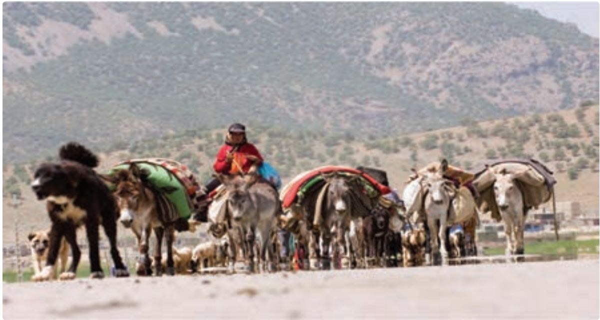
شکل ۲-۷- کوچ عشایر استان

شغل اصلی عشایر علاوه بر دامداری، تولید صنایع دستی، زراعت و باغداری می‌باشد. مناطق استقرار عشایر در استان به ترتیب جمعیت، شهرستان‌های دشتستان - دشتی - تنگستان - دیروجم را در بر می‌گیرد. مناطق بیلاقی عشایر استان بوشهر در استان فارس شهرستان‌های اقلید، صغاد، بهمن، مرودشت و شیراز، در استان اصفهان سمیرم و شهرضا و در استان چهارمحال و بختیاری بروجن و بلداجی است.