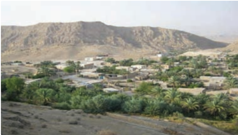
شکل ۵-۷- روستای کوهستانی سرمک

— خاک : وجود خاک‌های شور در بیشتر نقاط استان مانع جدی در استقرار روستاهای استان بوده است. دشت‌های دامنه‌ای به دلیل نداشتن محدودیت‌های خاک نواحی کوهستانی و دشت‌های پست از شرایط مساعد و مناسب طبیعی برخوردار و امکان استقرار جمعیت را فراهم آورده‌اند.