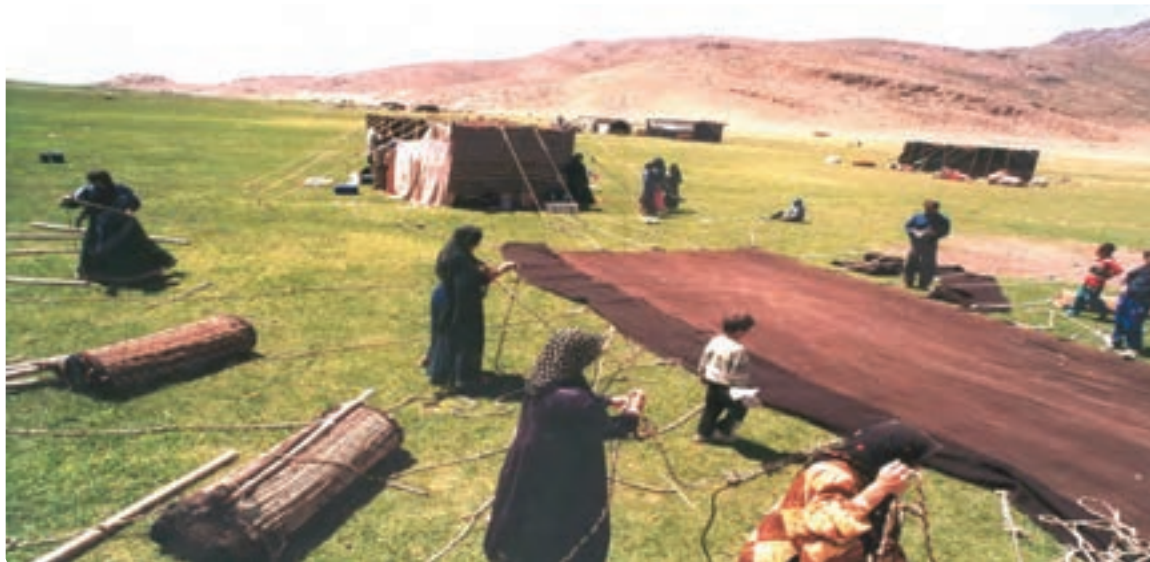
شکل ۴-۷- سیاه جادر از صنایع دستی عشایر قشقایی