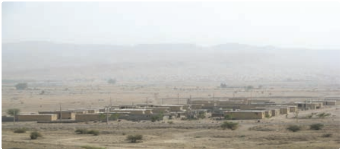
شکل ۳-۷- اسکان عشایر در ایل شهر بوشکان

شغل اصلی عشایر علاوه بر دامداری، تولید صنایع دستی، زراعت و باغداری می‌باشد. مناطق استقرار عشایر در استان به ترتیب جمعیت، شهرستان‌های دشتستان - دشتی - تنگستان - دیروجم را در بر می‌گیرد. مناطق بیلاقی عشایر استان بوشهر در استان فارس شهرستان‌های اقلید، صغاد، بهمن، مرودشت و شیراز، در استان اصفهان سمیرم و شهرضا و در استان چهارمحال و بختیاری بروجن و بلداجی است.