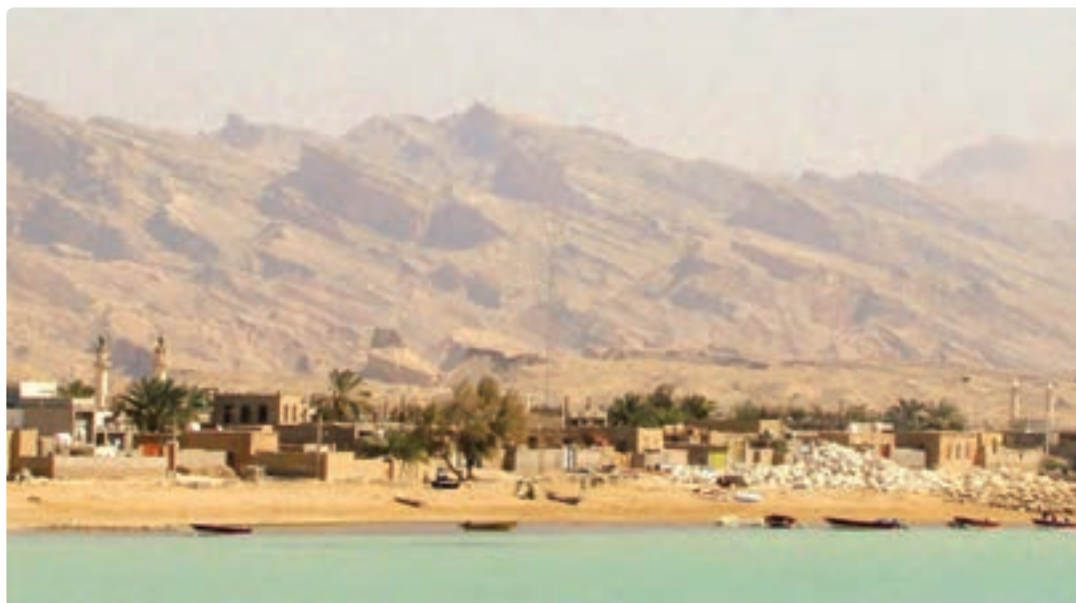
شکل ۶-۷- تصویری از روستای ساحلی خورشهاب

— راه ارتباطی : بیشتر روستاها به موازات شبکه خطوط ارتباطی اصلی در سطح استان شکل گرفته‌اند، به طوری که حیات روستاهای جاده‌ای به رفت و آمد در راه‌های ارتباطی موجود وابسته‌اند و فعالیت‌های خدماتی نقش اساسی در توسعه و رونق این روستاها دارد.