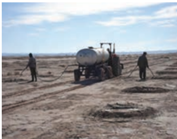
شکل ۳-۵- نهال کاری در بیابان‌های استان خراسان جنوبی

شما چه راهکارهایی برای جلوگیری از حرکت ماسه‌های روان و ایجاد طوفان‌های گرد و خاک پیشنهاد می‌کنید؟