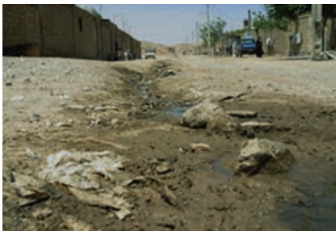
شکل ۵-۹- آلودگی آب ها و رهایی فاضلاب های شهری در معابر