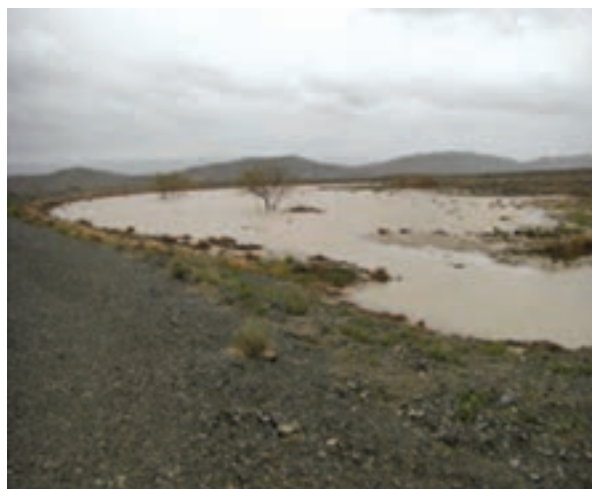
شکل ۵-۷- اجرای طرح های آبخوان داری در استان خراسان جنوبی