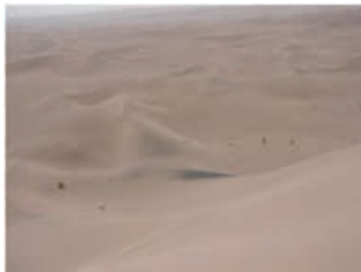
شکل ۵-۱- چشم‌اندازی از بیابان‌های استان خراسان جنوبی (تپه‌های ماسه‌ای برخان و سیف)