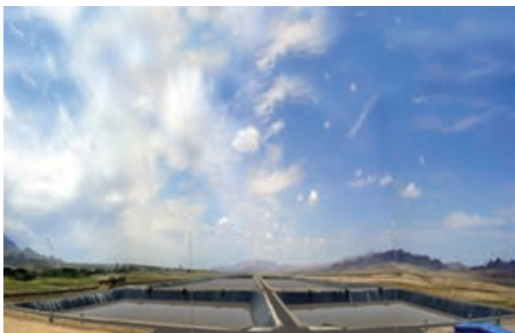
شکل ۱۶-۵- تصفیه‌خانه فاضلاب شهر بیرجند