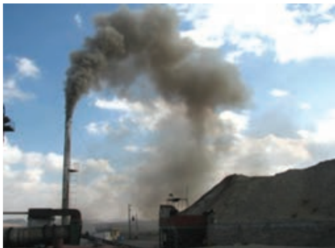
شکل ۱۲-۵- آلودگی هوای استان

ب) منابع آلاینده متحرک : وسایل نقلیه موتوری ج) وزش بادهای شدید همراه با ماسه به دلیل مجاورت با دشت لوت و کویر نمک