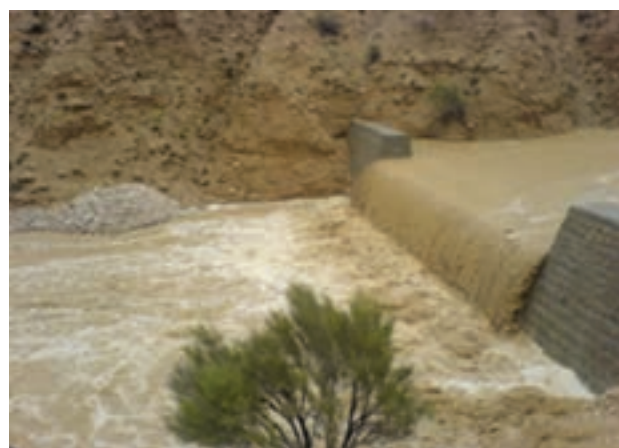
شکل ۵-۶- اجرای طرح‌های آبخیزداری در استان

آبخیزداری: یکی از مهم‌ترین راهکارهای علمی و عملی جهت مقابله با سیل، خشکسالی و بیابان‌زایی است. آبخیزداری در نواحی بالادست (بالا تراز خط تلاقی کوه و دشت) با انجام عملیات مناسب مانع ایجاد سیلاب‌های مخرب می‌شود و آب را به درون زمین نفوذ می‌دهد تا در فصول خشک، به مرور زمان از طریق چشمه‌ها، قنات و چاه‌های عمیق و نیمه عمیق در اختیار