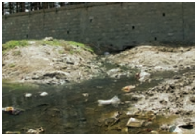
شکل ۱۳-۵- فاضلاب‌های شهری و خانگی عامل مؤثر در آلودگی آب‌ها

یکی دیگر از مشکلات زیست محیطی استان آلودگی آب‌هاست. به تصویر زیر نگاه کنید.