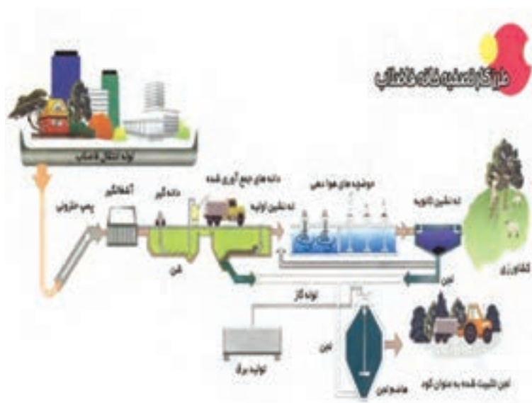
شکل ۱۵-۵- فرایند تصفیه فاضلاب‌ها

تصفیه‌خانه فاضلاب شهر بیرجند با هدف جلوگیری از آلودگی منابع آب زیرزمینی، ارتقای سطح بهداشت عمومی و توسعه کشاورزی در اثر برگشت آب به چرخه طبیعت در غرب شهر بیرجند ایجاد شده است.