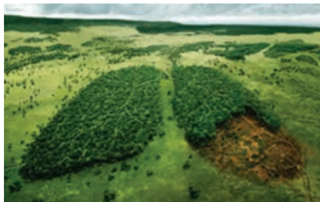
شکل ۸-۵- نمونه‌ای از مشکلات زیست محیطی