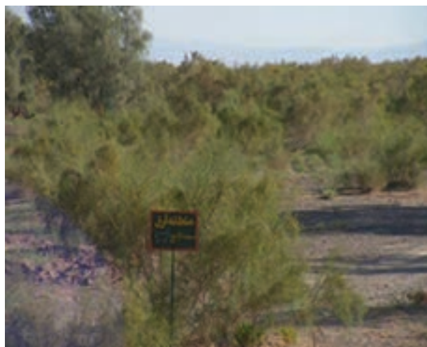
شکل ۵-۵- بادشکن عامل کاهش سرعت باد و مانعی در برابر فرسایش بادی