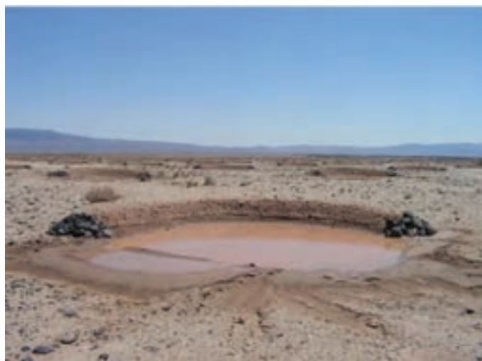
شکل ۴-۵- هلالی آبگیر عامل مهم در مهار هرز آب‌ها