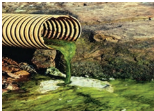
شکل ۱۴-۵- آلودگی آب‌ها در اثر پساب‌های صنعتی

الف) پساب‌های صنعتی: عمده‌ترین مشکل در بخش فاضلاب‌های صنعتی، مربوط به واحدهای فرآورده‌های لبنی، کشتارگاه‌های دام و طیور و واحدهای صنعتی کوچک استان است.