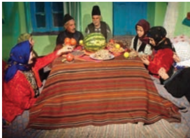
شکل ۳-۳- نمونه ای از مراسم شب چله در روستا

یلدا به عنوان طولانی ترین شب سال که به چله نیز معروف است، در استان زنجان هم مانند سایر استان ها از حال و هوای ویژه ای برخوردار است. به طوری که اهالی استان، برای پذیرایی و برگزاری مراسم خاص آن با خرید آجیل، هندوانه، و میوه های مختلف و شیرینی به استقبال این شب طولانی می روند. همچنین خانواده داماد برای عروس، با تهیه هدایایی همراه با خوراکی های این شب که در مجموعه ای به نام «خونچا» گردآوری کرده اند به دیدار خانواده عروس می روند. در این شب بزرگترها با شاهنامه خوانی و قصه های شیرین ایرانی اعضای خانواده را سرگرم کرده و این شب را گرمی می دارند.