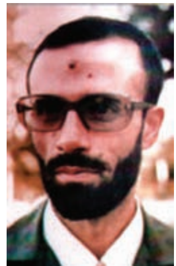
شکل ۸-۴- شهید کلاهدوز

شخصیت‌های برجسته‌ی زیادی را می‌توان از تهران نام برد که سنگرهای خود را در مجلس شورای اسلامی، مدرسه و ... ترک کردند و به جبهه‌ها شتافتند و به درجه رفیع شهادت نائل آمدند؛ از آن جمله می‌توان شهید مصطفی چمران را نام برد. همچنین از میان سرداران سپاه و ارتش نیز افراد برجسته‌ای بودند که با وجود مسئولیت‌های کلان کشوری، سنگرها را بر صندلی‌ها ترجیح دادند و همچون سایر رزمندگان به خطوط مقدم جبهه رفتند؛ از جمله تیمسار ولی... فلاحی، شهید ستاری، شهید حسن باقری، شهید کلاهدوز و شهید سید مرتضی آوینی (شهید اهل قلم) روایتگر «روایت فتح».