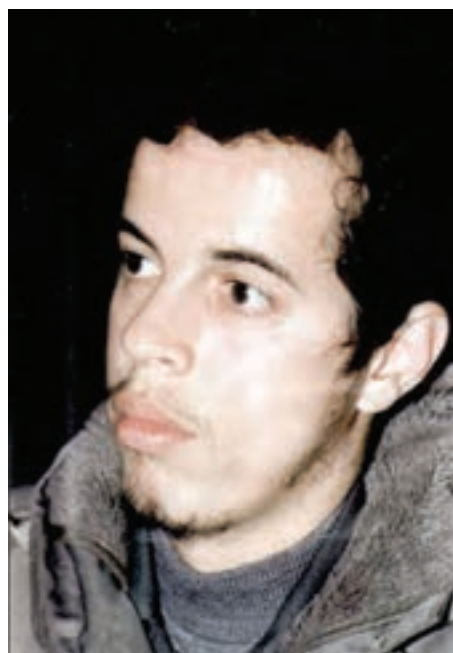
شکل ۱۲-۴- شهید حسن باقري

از روحانیان ممتاز می‌توان از مرحوم آیت‌الله طالقانی یاد کرد. او شکنجه‌های بسیاری در زندان طاغوت کشید و از یاران امام خمینی (ره) و اولین امام جمعه تهران پس از انقلاب بود. آیت‌الله طالقانی شاگردان بسیاری برای مبارزه با رژیم ستم‌شاهی تربیت کرد که شهید چمران یکی از کسانی بود که در مجالس درس ایشان شرکت می‌کرد.