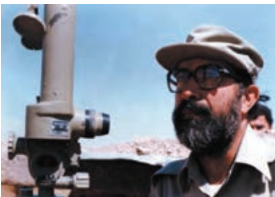
شکل ۱۱-۴- شهید دکتر مصطفی چمران