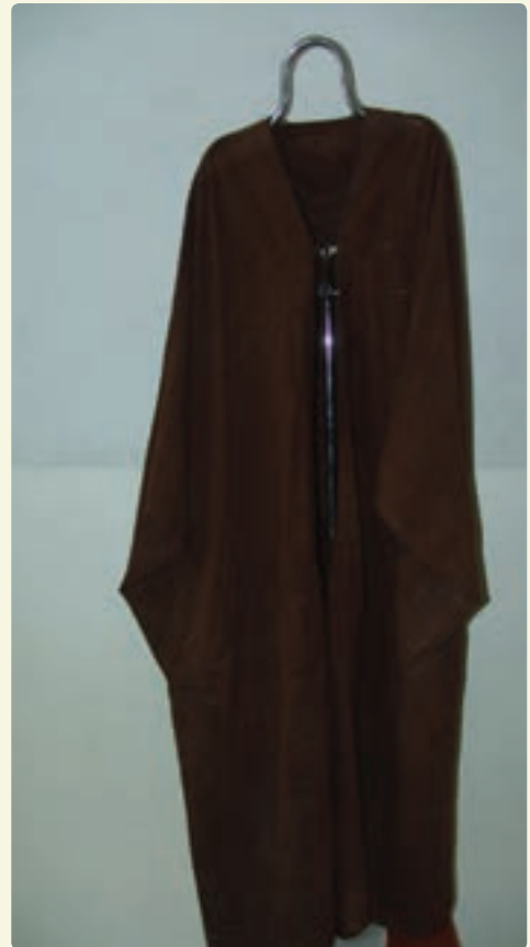
شکل ۴-۹- تصاویری از صنایع دستی استان بوشهر