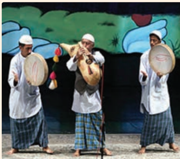
شکل ۱۶-۹- اجرای ساز نی امیان

البته موسیقی استان متقابلاً بر موسیقی ملی ایران تأثیر گذار بوده است، از جمله در ردیف موسیقی سنتی ایران، بسیاری از گوشه‌های آواز دشتی در ردیف سنتی متأثر از شروه و آوازهای رایج در منطقه دشتی، دشتستان و تنگستان و... می‌باشد.