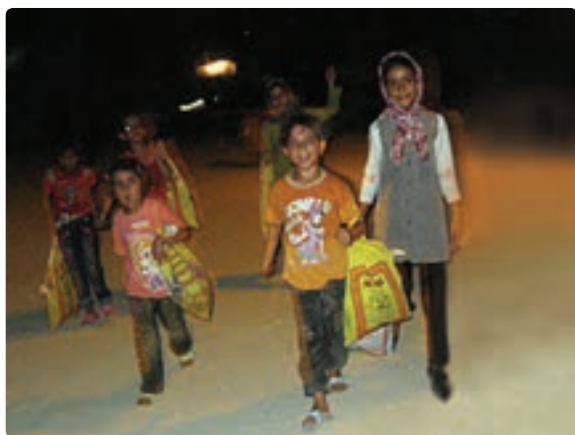
شکل ۱۱-۹- مراسم گره گشو در شهرستان دیر

به سبب آنکه این رسم در ماه مبارک رمضان صورت می گیرد می توان انجام آن را در اعتقادات مذهبی شیعیان جست و جو کرده و به روز تولد امام حسن مجتبی علیه السلام مربوط دانست.