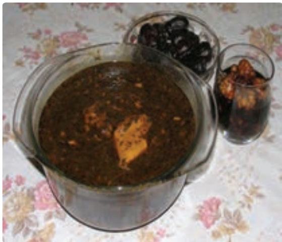
شکل ۹-۶ - قلیه ماهی

در استان بوشهر به دلیل نزدیکی به دریا اکثر غذاهای سنتی از آبریان تهیه می‌شود و مردم منطقه کوهستانی و دشت نشین از غذاهایی استفاده می‌نمایند که بیشتر در آنها گندم، لبنیات و خرما به کار رفته است. قلیه ماهی و میگو، تنداز ماهی، گمنه(للك)، رشته، لخ لاخ، عدس، مرغ شکم گرفته، ماهی شور، شکرپلو، قیمه، پهتی، برنجوش، دال عدس، کشکنه و... از انواع غذاهای استان است و رنگینک، حلوا خرمایی و... به عنوان پیش غذا در میان مردم استان رایج است.