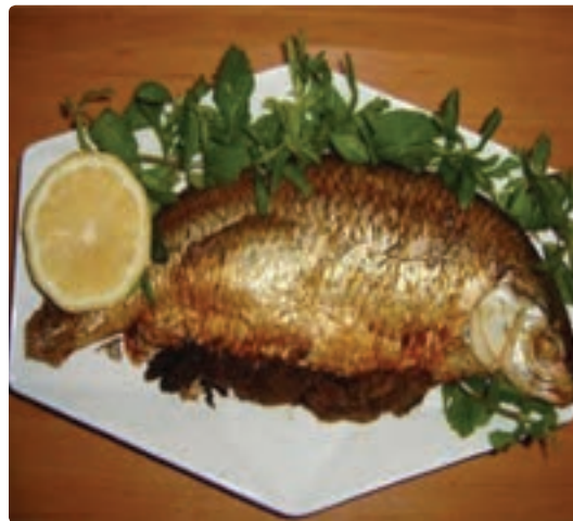
شکل ۹-۵ - ماهی شکم پر