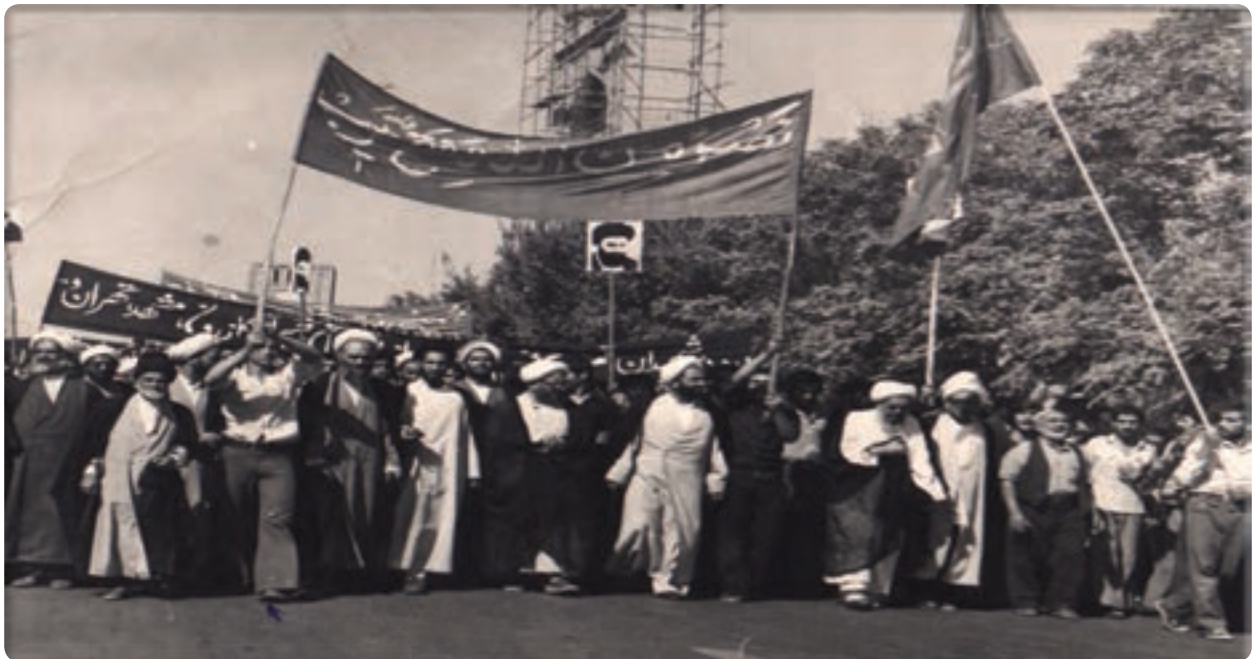
شکل ۳-۴- راهپیمایی مردم یزد علیه حکومت پهلوی به رهبری آیت الله شهید صدوقی