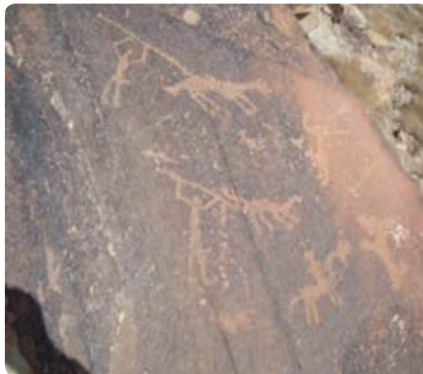
شکل ۱-۴- نقش سنگ نگاره‌های کوه ارنان

قبرهای خورشیدی در ارتفاعات کوه‌های بوهروک و نواحی جنوب غربی یزد که مربوط به دوران خورشید پرستی است و مربوط به سه تا شش هزار سال پیش است، نمونه‌های دیگری است. زراعت و مدنیت یزد، از مناطق مهریز و فهرج، یزد، رستاق، مید، اردکان و ابرکوه شروع شد اما کشاورزی در مهریز، فهرج و یزد در ابتدا وابسته به آب‌های سطحی ولی بعداً به دلیل کمبود ریزش‌های جوی و در کنار آن گرم شدن هوا مانند دیگر مناطق وابسته به آب‌های زیرزمینی، قنات (کاریز) شد.