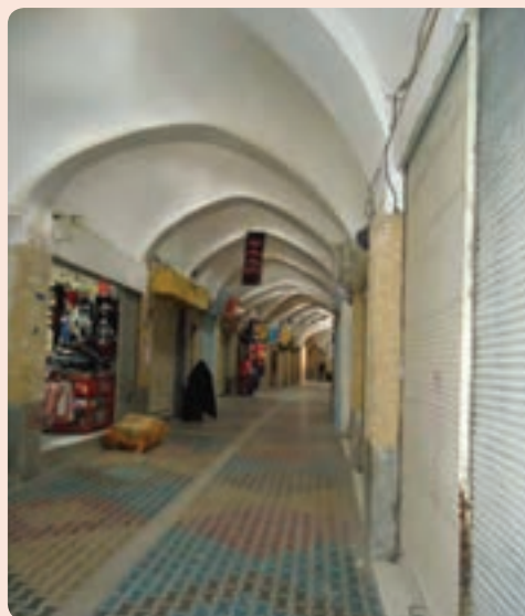
شکل ۴-۵- بازار سرپوشیده سمنان