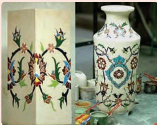
شکل ۳-۶ دو نمونه از صنایع دستی استان

مهم‌ترین و قدیمی‌ترین دست ساخته‌های بشر است. آثار سفالی برخلاف آثار یافته شده فلزی و چوبی در زیر خاک فاسد نمی‌شود و به خاطر این ویژگی به اطلاعات گویایی درباره صنایع دستی اقوام گذشته می‌توان پی برد. صنعت سفالگری در استان سمنان از قدمت بالایی برخوردار است. به‌طوری که دکتر اریک اشمیت هنگام حفاری در اطراف دامغان امیدوار به کشف شهر افسانه‌ای هکاتوم پلیس یا شهر صد دروازه بود، اگرچه موفق به کشف بقایای شهر مورد نظرش