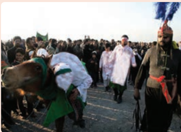
شکل ۱-۳- مراسم تعزیه خوانی ایام محرم در استان