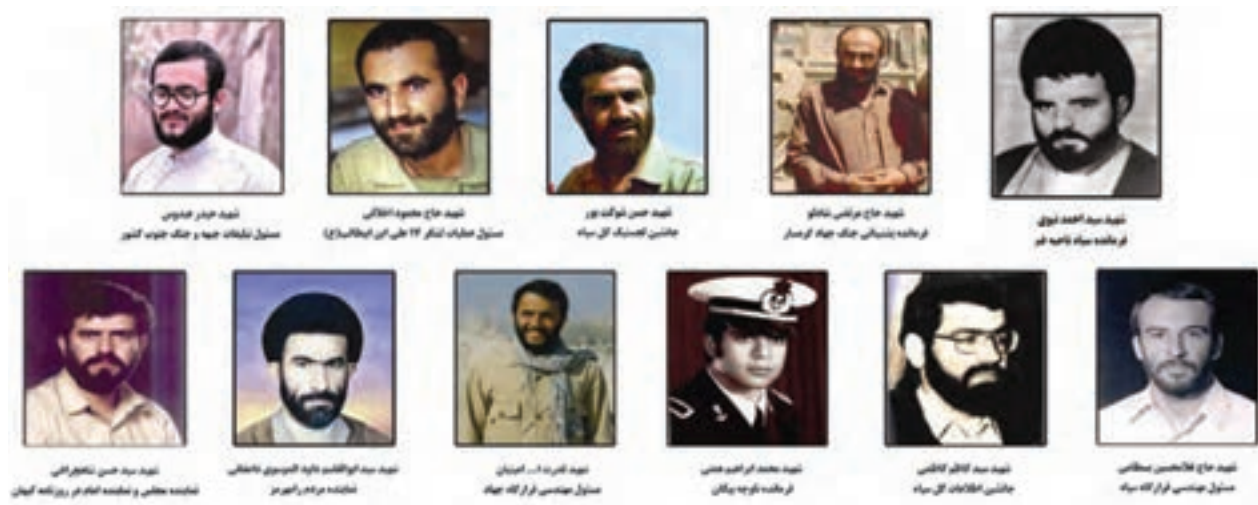
شکل ۹-۴. تعدادی از شهدای والامقام و شاخص استان در جنگ تحمیلی عراق علیه ایران

نتیجه این که رده استان را بین اول تا سوم کشور با اختلاف بسیار زیاد میانگین از کشور.