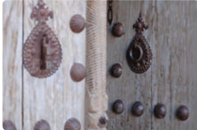
شکل ۳-۳- نقوش روی در و انواع کوبه

و رف‌های کوچک، اجرای انواع سقف به صورت گنبدی، مسطح، شیب‌دار و ... می‌توان برشمرد.