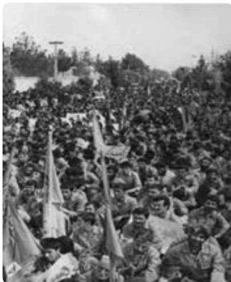
شکل ۴-۶- اعزام نیروهای مردمی از استان

روزنامه‌ها نوشتند: گروه کثیری از نیروهای تازه نفس رزمی طی یک اقدام سریع و فوق‌العاده از استان سمنان راهی جبهه‌های خون و شرف میهن اسلامی‌ان شدند.