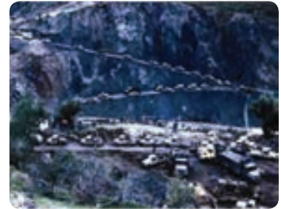
شکل ۷-۴- پشتیبانی جهاد سازندگی از جبهه‌های نبرد حق علیه باطل

احداث خاکریز، نصب پل، احداث جاده، بازسازی روستاها و شهرهای آسیب دیده به ویژه احداث جاده استراتژیک در عملیات طریق القدس در منطقه بستان و جاده سید الشهداء (ع) در جزیره مجنون از موارد مهم آن است. همچنین مدیریت قرارگاه حمزه سید الشهداء (ع) بر عهده جهاد استان بوده است که پذیرای ۱۲۰۰۰ نفر از رزمندگان جهادی استان و ۱۳۰۰۰ نفر از سایر استان‌ها بوده است. در مجموع تعداد ۱۱۳ نفر از رزمندگان جهاد سازندگی در طول ۸ سال دفاع مقدس به شهادت رسیدند.