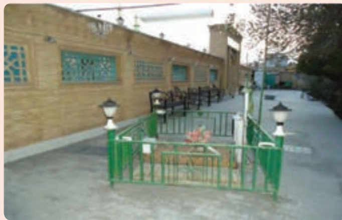
شکل ۱۳-۴- آرامگاه حاج ملا علی حکیم الهی در شهر سمنان

کربلا، نجف، تهران و اصفهان رفته و از محضر علمای مشهور کسب فیض کرد. پس از طی مدارج عالی علمی به زادگاه خویش مراجعت کردند و با تدریس و برگزاری مراسم نماز جماعت و جمعه مردم را هدایت می کردند. ایشان به لحاظ ساده زیستی و زهد و تقوا در میان عامه مردم جایگاه ویژه ای داشت و در علم و حکمت سرآمد روزگار خویش بود. در حکمت، نجوم، در علوم الهی و مسائل اجتماعی نظریه های بسیار روشنی را ابراز می کرد. این حکیم فرزانه ۲۵ اثر داشته که در پی وقوع سیل از بین رفته است. در سال ۱۳۳۳ هجری قمری در سمنان رحلت کرد. آرامگاه او در ضلع غربی میدان امام خمینی (ره) سمنان واقع شده است.