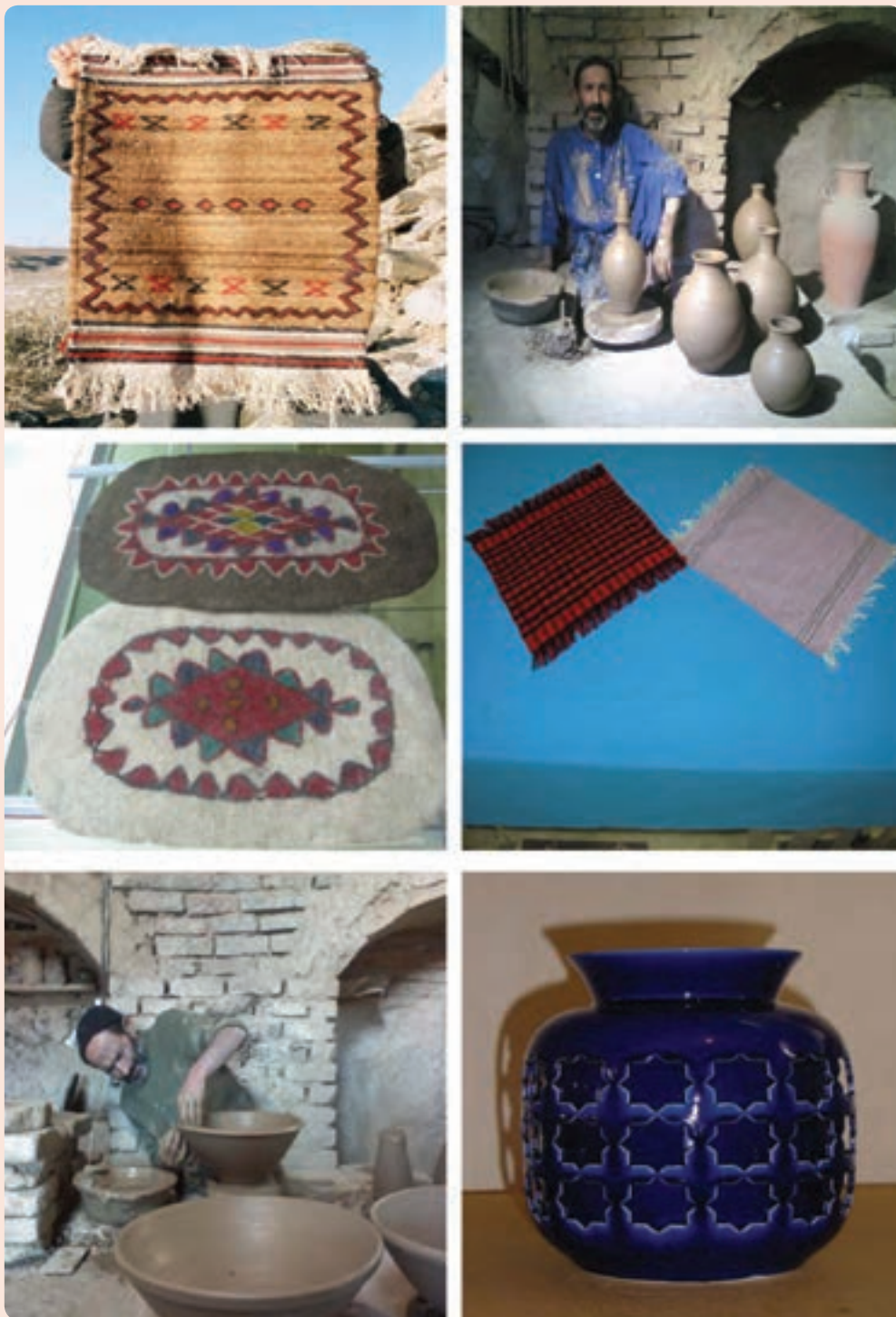
شکل ۷-۳- نمونه‌هایی از صنایع دستی استان سمنان