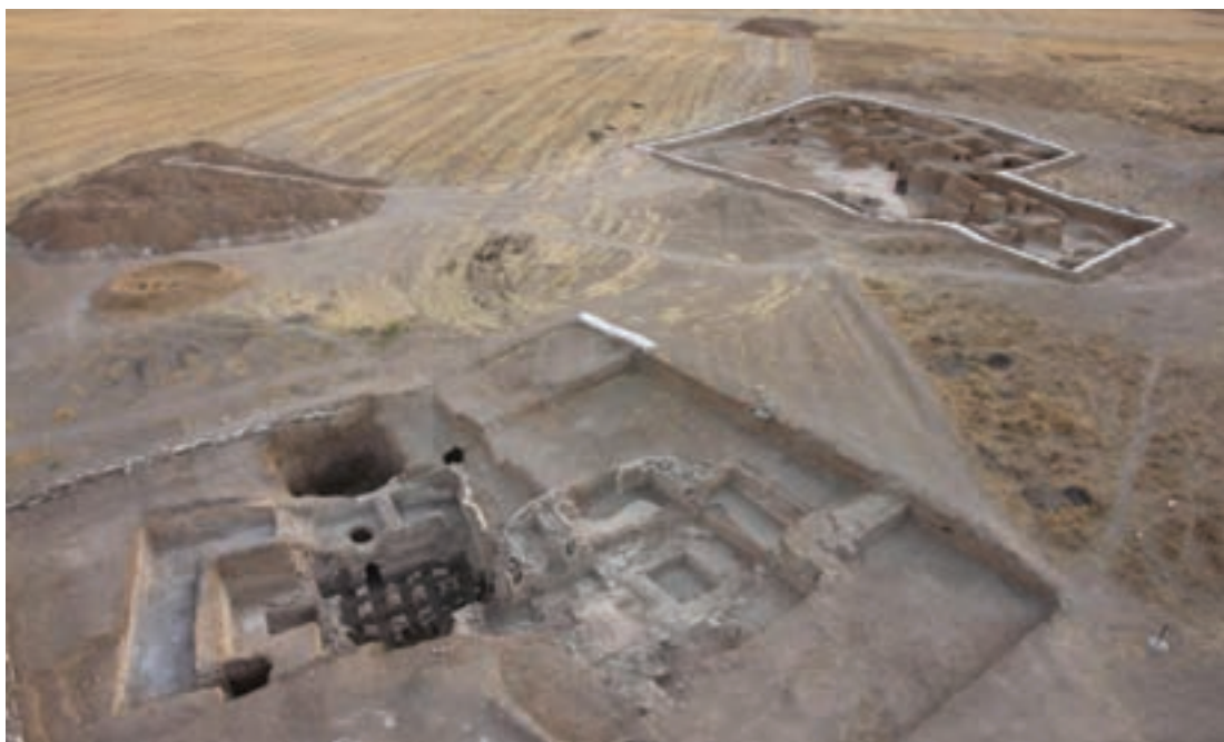
شکل ۱۴-۴- شهر تاریخی ذلف‌آباد فراهان مربوط به دوره ایلخانی