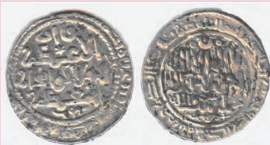
شکل ۹-۴- نمونه‌ای از سکه‌های یافت شده مربوط به دوره اسلامی در استان مرکزی

تا آغاز قرن سوم هجری در منابع تاریخی و جغرافیایی از این شهر کمتر یاد شده است. این امر شاید بدان علت باشد که این مکان در حد یک روستا بوده است؛ لیکن با شروع قرن سوم هجری، در دوره خلافت هارون الرشید (۱۹۳-۱۷۰ ه.ق) این منطقه (کرج) به اقطاع خاندان عربی تبار «ابودلف عجلی» واگذار شد. ابودلف قاسم بن عیسی عجلی در سال ۲۱۰ ه.ق به عنوان اولین نماینده رسمی خلیفه عباسی، شهر کرج را بازسازی و ابنیه جدیدی در آن بنا کرد و به آن رونق و آبادانی بخشید. پس از وی جانشینانش از ۲۲۶ تا ۲۸۵ ه.ق در این شهر حکمرانی کردند. همچنین علی بویه (عماد الدوله) در سال ۳۲۰ ه.ق از جانب مرداویج زیاری به فرمانروایی این منطقه انتخاب شد و به همراه او گروهی از افسران مورد اعتماد خود را نیز به این شهر اعزام کرد. دیری نگذشت که مرداویج نسبت به وفاداری سرداران دیلمی از جمله علی دچار تردید شد. به همین دلیل به برادرش «وشمگیر» و وزیرش حسین بن محمد ملقب به «عمید» نامه نوشت که از خروج سرداران دیلمی از ری جلوگیری کنند. عمید، نامه را از روی عمد و دیر بر وشمگیر خواند که در نتیجه آن علی از قلمرو ری خارج شده بود. بدین ترتیب با تسلط علی بن بویه بر کرج، پادشاهی طولانی مدت آل بویه بر این منطقه برقرار گردید.