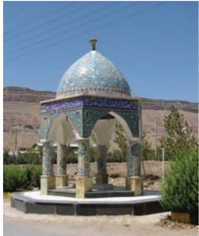
شکل ۲۳-۴- آرامگاه یک شهید گمنام (نراق)