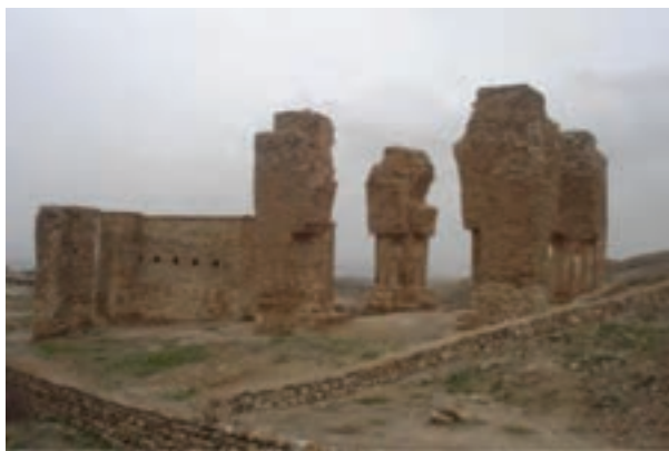
شکل ۴-۶- آتشکدهٔ آتشکوه تیمور مربوط به دورهٔ ساسانی

کاوش‌های باستان‌شناسی و مطالعات تاریخی حکایت از غنی بودن تاریخ این استان در عصر ساسانی دارند. از این دوره به جز تپه‌ها و اماکن باستانی، نمادهایی باقی مانده‌اند که در نوع خود جالب توجه‌اند؛ به‌طور نمونه آتشکدهٔ آتشکوه (نراق)، پل بند نیم‌ور، میل میلونه (محللات)، پل دختر و سمنق (رودبار تفرش)، قلعهٔ گبری خمین و بقایای آتشکدهٔ فردقان (کمیجان) از جمله آثار شاخص این دوره‌اند.