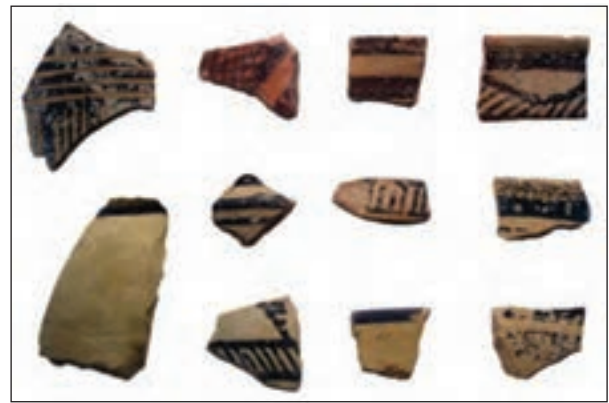
شکل ۴-۳- نمونه‌ای از سفال‌های منقوش مربوط به هزاره چهارم (ق.م)