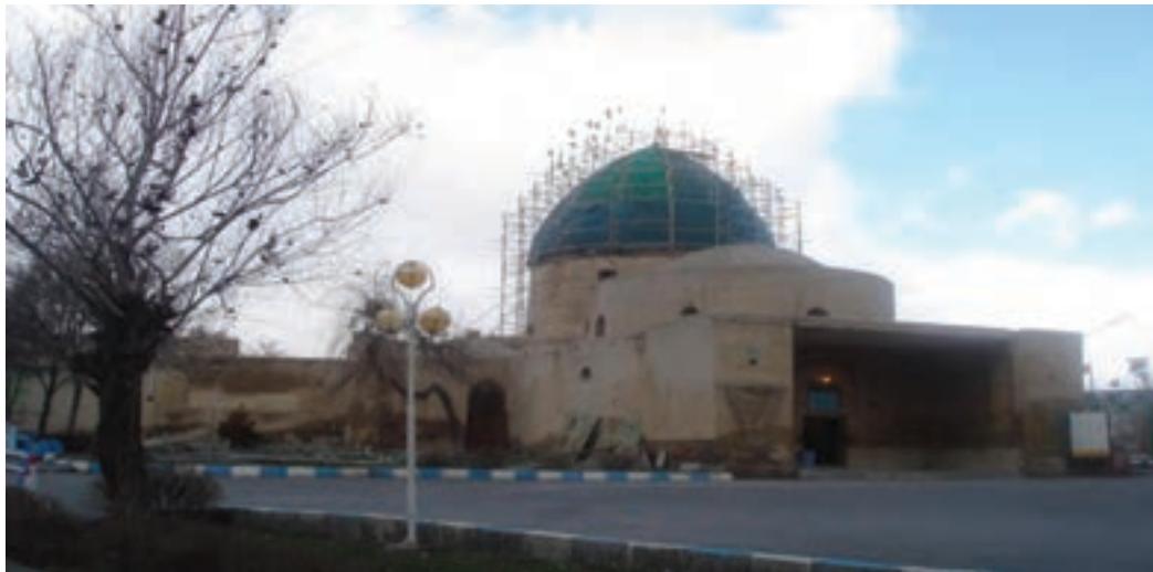
شکل ۱۳-۴- بقعه امامزاده سهل بن علی واقع در شهر آستانه (کرج ابودلف)

دوره زندیه: تاریخ استان مرکزی در دوره زندیه بیشتر با تاریخ حکومت‌های محلی به عنوان نمایندگان حکومت زند پیوند می‌خورد. از جمله اقدامات این حاکمان عمران روستاها و ایجاد بناهای عام المنفعه است. یکی از حکمرانان محلی این دوره کلبعلی خان خلج نام دارد که در خرقان و نوبران عمارات و بناهایی در خور توجه باقی گذاشته است.