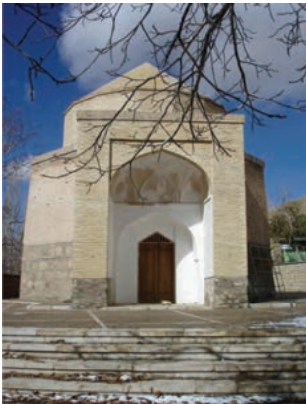
شکل ۱۲-۴- آرامگاه شاه‌قلندر از رهبران اسماعیلیه واقع در روستای انجدان اراک مربوط به دوره تیموری (مرمت آن در سال ۹۰۸ ه.ق. دوره صفویه انجام شده)

ایران پس از سیصد سال از انجدان به کهک (دلیجان)، شهر بابک کرمان و در نهایت به هندوستان منتقل شد. آرامگاه امامان اسماعیلی از جمله شاه قریب و شاه قلندر در انجدان مستندات بازمانده از این دوره اند. در این میان همچنین باید به سبک معماری تیموری در استان مرکزی اشاره کرد. برای نمونه می‌توان آثار باقی مانده از هنر معماری شهر تفرش (بقاع متبرکه) و خمین (امامزاده عبدالله در میشیجان) را نام برد.