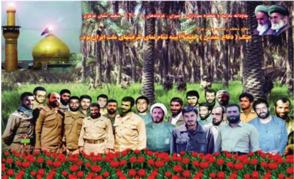
شکل ۲۰-۴- جمعی از سرداران و امیران شهید استان مرکزی