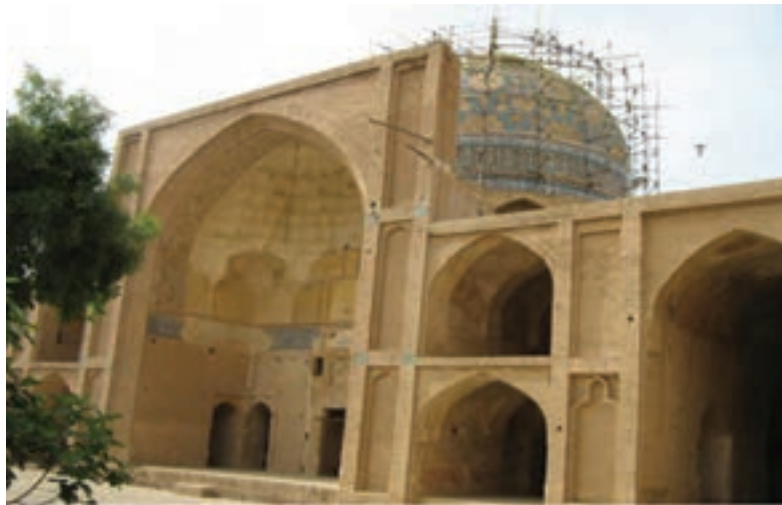
شکل ۱۱-۴- مسجد جامع ساوه مربوط به دوره سلجوقی