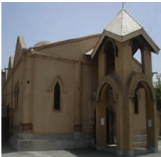
شکل ۱۶-۴- ساختمان کلیسای مسروپ مقدس واقع در اراک مربوط به دوره قاجار