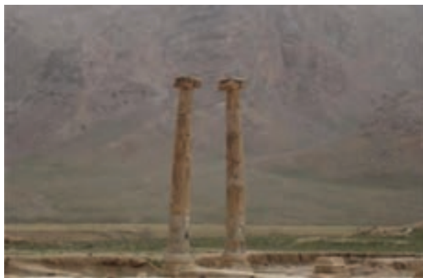
شکل ۴-۵- ستون‌های بر جای مانده واقع در خورمهٔ محللات مربوط به دورهٔ سلوکی - اشکانی