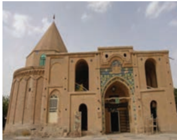
شکل ۴-۷- بقعهٔ امامزاده شاهزاده حسین نظام‌آباد فراهان مربوط به دورهٔ ایلخانی