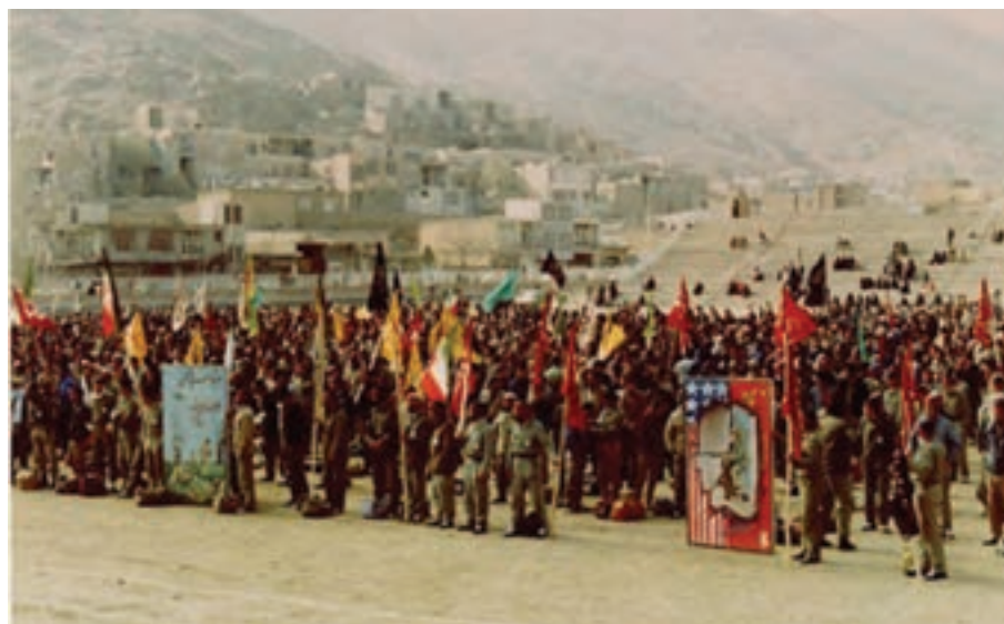
شکل ۱۹-۴- اعزام رزمندگان استان به مناطق جنگی