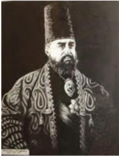
شکل ۱۷-۴- امیر کبیر

قائم مقام) رشد و نمو یافت. وی فن منشی‌گری را نزد قائم مقام آموخت. بعدها به مقام مستوفی‌گری نظام آذربایجان و عاقبت به صدارت رسید. در زمان صدارتش اصلاحات فراوانی در قوانین و سیاست کشور و جبران عقب ماندگی‌های تاریخی ایران کرد؛ اما سرانجام دشمنی امثال آقاخان نوری و مهدعلیا (مادر ناصرالدین شاه) در دربار و مخالفت‌های بیگانه از جمله روس و انگلیس و ناپختگی ناصرالدین شاه، باعث شد در ۲۰ محرم ۱۲۶۸ هـ. ق از صدارت معزول و به شهر کاشان تبعید شود. وی بعد از مدتی به فرمان ناصرالدین شاه به طرز فجیعی در حمام فین کاشان کشته شد و پیکر پاکش در سرزمین کربلا به خاک سپرده شد.