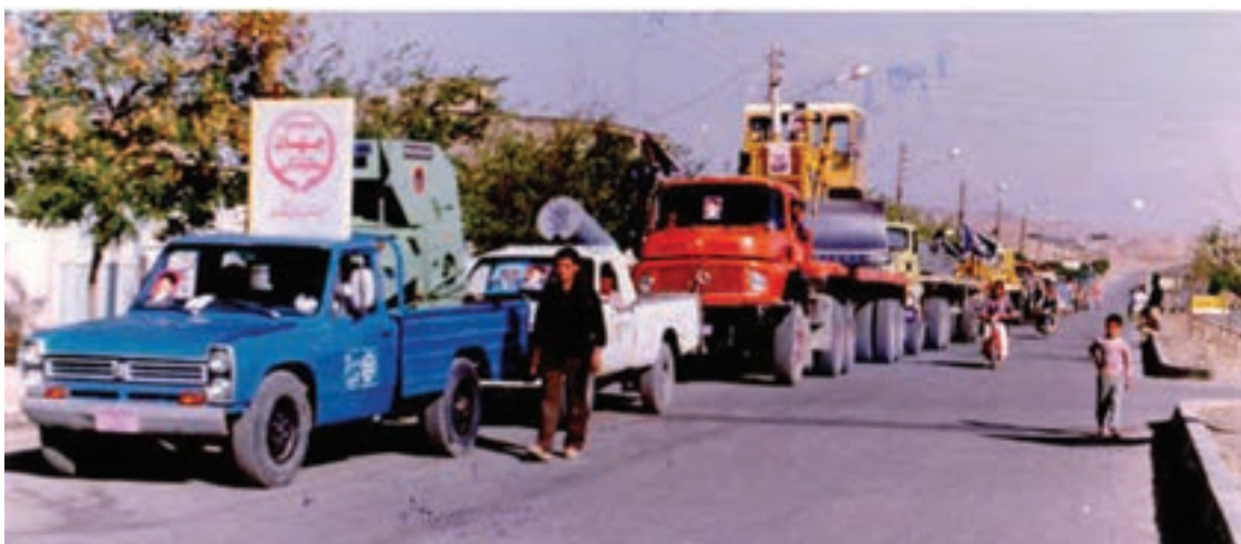
شکل ۲۱-۴- کمک‌های مردمی و ارگان‌های دولتی به جبهه‌های جنگ

دلسوزانه و شبانه‌روزی خود، نقش بسیار حساس و تعیین‌کننده‌ای در ساخت ماشین‌آلات جنگی، پل‌های شناور، مهمات و... داشته‌اند که این امر باعث توجه و حساسیت استکبار جهانی و رژیم بعث عراق به این استان شد. به همین علت به‌طور مکرر صنایع و مناطق مسکونی استان خصوصاً شهر اراک را بارها بمباران نمودند. طی این تجاوزهای هوایی چندین فروند هواپیمای دشمن در شهر اراک مورد اصابت پدافند هوایی قرار گرفتند و سرنگون شدند.