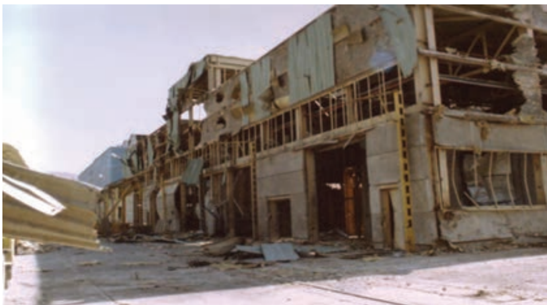
شکل ۲۲-۴- بمباران کارخانه آلومینیوم سازی اراک (۵ مردادماه ۱۳۶۵)

دلسوزانه و شبانه‌روزی خود، نقش بسیار حساس و تعیین‌کننده‌ای در ساخت ماشین‌آلات جنگی، پل‌های شناور، مهمات و... داشته‌اند که این امر باعث توجه و حساسیت استکبار جهانی و رژیم بعث عراق به این استان شد. به همین علت به‌طور مکرر صنایع و مناطق مسکونی استان خصوصاً شهر اراک را بارها بمباران نمودند. طی این تجاوزهای هوایی چندین فروند هواپیمای دشمن در شهر اراک مورد اصابت پدافند هوایی قرار گرفتند و سرنگون شدند.