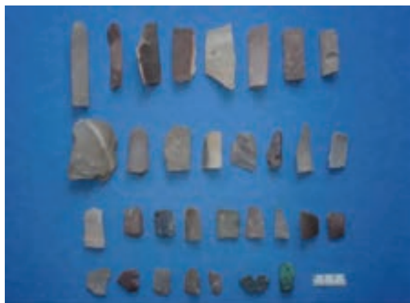
شکل ۲-۴ نمونه‌هایی از ابزارهای سنگی استفاده شده توسط بشر مربوط به هزاره چهارم ق.م (مس سنگی)

استان مرکزی با توجه به موقعیت جغرافیایی خود، در حد فاصل مرکز فلات ایران و زاگرس، همواره به عنوان یک منطقه بینابینی، در کنش و برهم کنش‌های فرهنگی در سه دوره پیش از تاریخ، تاریخی و اسلامی مطرح بوده است. به طور کلی بررسی سیر تحول جوامع بشری در استان مبتنی بر بررسی‌ها و کاوش‌های باستان‌شناسی از یک سو و اشارات متون تاریخی از سویی دیگر است. این استان از سویی در محدوده شهرستان‌های خمین، محلات، دلیمان، اراک، زرنده، آستیان و تفرش در دوره پیش از تاریخ تحت تأثیر فرهنگ‌های شکل گرفته در حوزه فلات و از سویی در شهرستان‌های خنداب، شازند و کمیجان در حاشیه زاگرس تحت تأثیر فرهنگ‌های شکل گرفته و نفوذ یافته در منطقه زاگرس میانی بوده است. قدیمی‌ترین شواهد شناخته شده از شکل‌گیری استقرارهای بشری در دوره پیش از تاریخ، سکونتگاه‌های انسانی است که بر اساس تکنیک‌های به کار رفته در ساخت ابزارها و مصنوعات سنگی (خراشنده‌ها، تیغه‌های سنگی و...) قابل بررسی و تمیز دادن از یکدیگرند. نمونه چنین استقرارهایی را می‌توان در شهرستان‌هایی چون دلیمان، زرنده و فراهان سراغ گرفت.