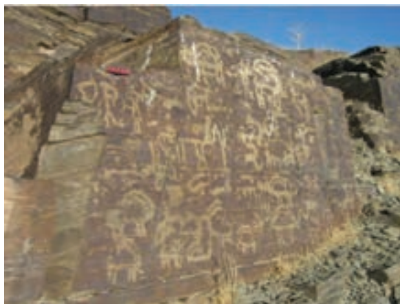
شکل ۱-۴ نمونه‌ای از سنگ نگاره‌های تیمره (خمین)