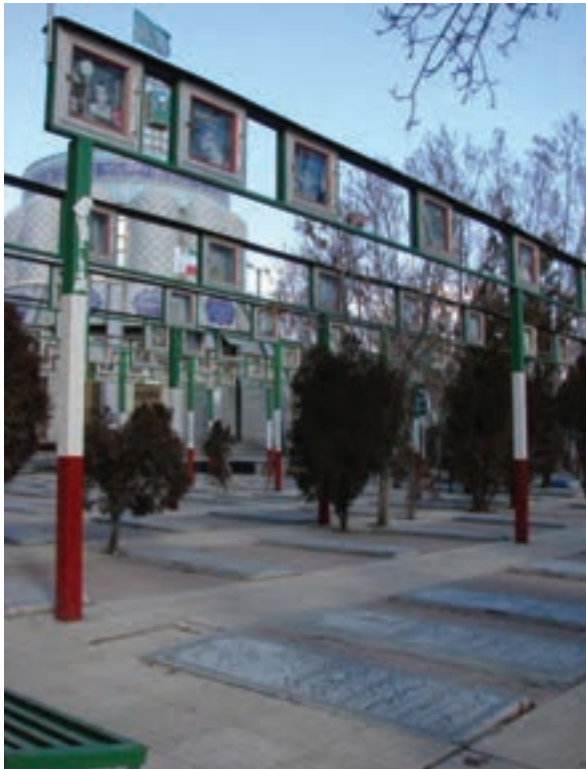
شکل ۲۴-۴- گلزار شهدای اراک

۴- اسکان جنگ زدگان : بعد از وقوع جنگ تحمیلی بسیاری از هموطنان ما در شهرهای جنوب و غرب کشور آواره شدند که تحت عنوان مهاجران جنگ تحمیلی به برخی از استان‌های کشور برای سکونت موقت انتقال داده شدند. استان مرکزی نیز به دلیل موقعیت خاص جغرافیایی و راه‌های ارتباطی مناسب، میزان تعداد زیادی از آنان بوده است و طرح اسکان موقت جنگ‌زدگان در خانه‌های مردم این استان، به مدت ۵ تا ۶ ماه به طول انجامید. پس از آن، مسئولیت ساماندهی و خدمات‌دهی به آنان را ستاد اسکان جنگ زدگان به عهده گرفت.