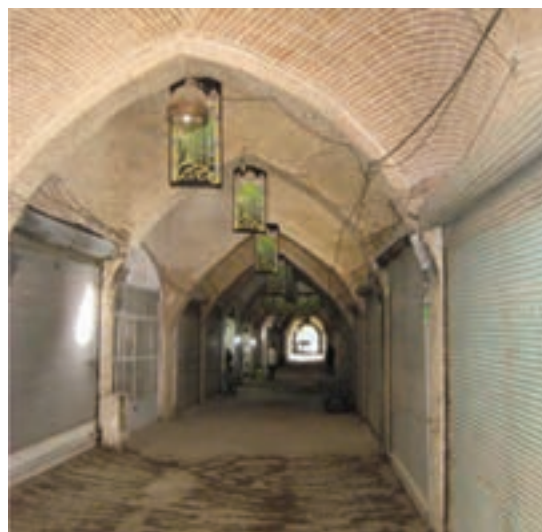
شکل ۱۵-۴- بازار اراک مربوط به دوره قاجار