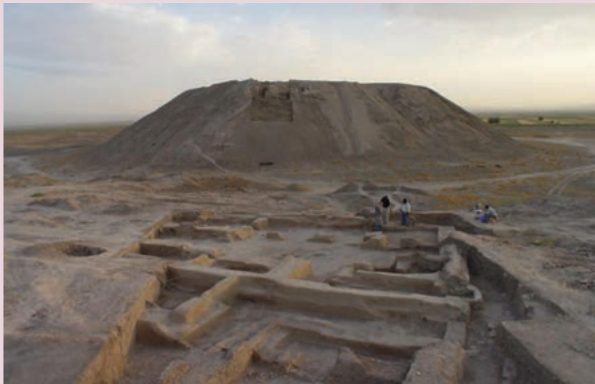
شکل ۱۰-۴- بخش‌ی از شهر تاریخی آوه که توسط حفاری‌های باستان شناسان به دست آمده است.

آوه پس از ورود سادات علوی و اهمیت بخشی از دولت روز یعنی آل بویه، از چنان جایگاهی برخوردار شد که به عنوان یک شهر شیعی بعد از قم شناخته شد. شیعه خواهی در مناطق شیعه مذهب، شکل گیری بناهای مذهبی چون امامزاده‌ها را باعث شد. مشاهد متبرکه آنان در آوه امروزه محل حاجت خواهی مؤمنان بسیاری است.