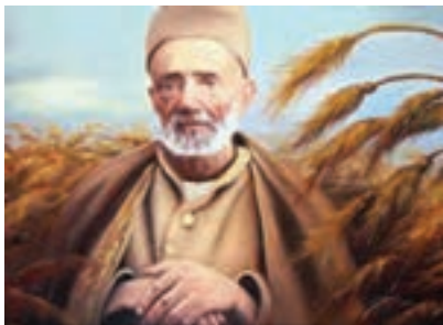
شکل ۱۸-۴- کربلایی کاظم ساروقی

قائم مقام) رشد و نمو یافت. وی فن منشی‌گری را نزد قائم مقام آموخت. بعدها به مقام مستوفی‌گری نظام آذربایجان و عاقبت به صدارت رسید. در زمان صدارتش اصلاحات فراوانی در قوانین و سیاست کشور و جبران عقب ماندگی‌های تاریخی ایران کرد؛ اما سرانجام دشمنی امثال آقاخان نوری و مهدعلیا (مادر ناصرالدین شاه) در دربار و مخالفت‌های بیگانه از جمله روس و انگلیس و ناپختگی ناصرالدین شاه، باعث شد در ۲۰ محرم ۱۲۶۸ هـ. ق از صدارت معزول و به شهر کاشان تبعید شود. وی بعد از مدتی به فرمان ناصرالدین شاه به طرز فجیعی در حمام فین کاشان کشته شد و پیکر پاکش در سرزمین کربلا به خاک سپرده شد.