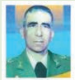
شهید منفرد نیایی

در سال ۱۳۰۸ در آمل به دنیا آمد و دوره‌های نظامی عالی را طی کرد. هنگام شروع جنگ، فرمانده لشکر ۸۸ زرهی زاهدان بود، سپس به فرماندهی لشکر ۹۲ زرهی اهواز و جانشین فرماندهی نیروی زمینی ارتش در جنوب منصوب شد. در این سمت‌ها با رشادت کارنامه‌ای پرافتخار در عملیات‌های بزرگی چون: طریق القدس، فتح المبین، بیت المقدس، والفجر مقدماتی، والفجر ۱ و رمضان از خود برجای گذاشت و در ۱۳۶۴/۵/۶ به درجه رفیع شهادت نائل شد. از ویژگی‌های شهید این بود که حتی در هنگام تشییع و تدفین