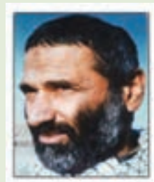
شهید حاج حسین جان بصیر

در شب عاشورای سال ۱۳۲۲ در فریدونکنار چشم به جهان گشود. کودکی و نوجوانی او با فعالیت‌های مذهبی و مداحی برای اهل بیت (ع) طی شد. در سال ۱۳۴۲ با اینکه سرباز بود، در سخنرانی معروف امام حاضر شد و بعدها نیز با استمرار مبارزات خود به‌ویژه در برپایی راهپیمایی‌ها نقش فعالی داشت. پس از پیروزی انقلاب اسلامی نیز مدتی برای مبارزه با شوروی و حکومت وابسته به آن در افغانستان، به این کشور سفر کرد. از نخستین روزهای شروع جنگ عازم جبهه‌ها شد و در واحدهای مختلف نظامی از خود رشادت‌های بسیار نشان داد و بارها مجروح شد. حضور او در عملیات‌های متعدد از جمله فتح فاو و کربلای ۵ چشمگیر بود. سرانجام در سال ۱۳۶۶ در عملیات کربلای ۱۰ به آرزوی دیرینه خود یعنی شهادت دست یافت.