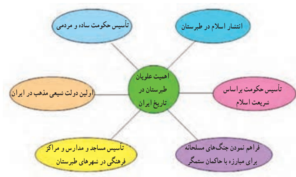
شکل ۵-۴- اهمیت علویان طبرستان در تاریخ ایران