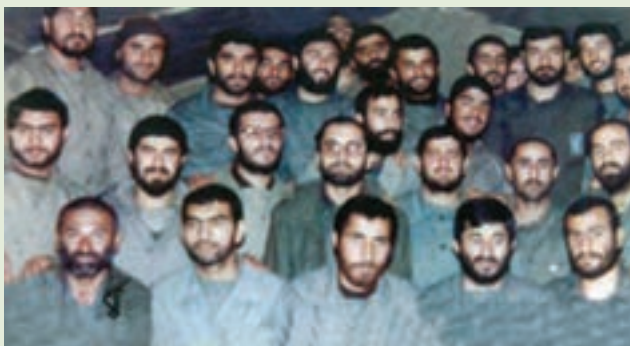
شکل ۱۰-۴- تصویر برخی از علمداران لشکر ۲۵ کربلا

از ارتش جمهوری اسلامی ایران به طور خاص و سایر یگان‌های ارتش در سطح ملی از توانایی‌های امیران و رزمندگان مازندران بهره‌مند بودند.