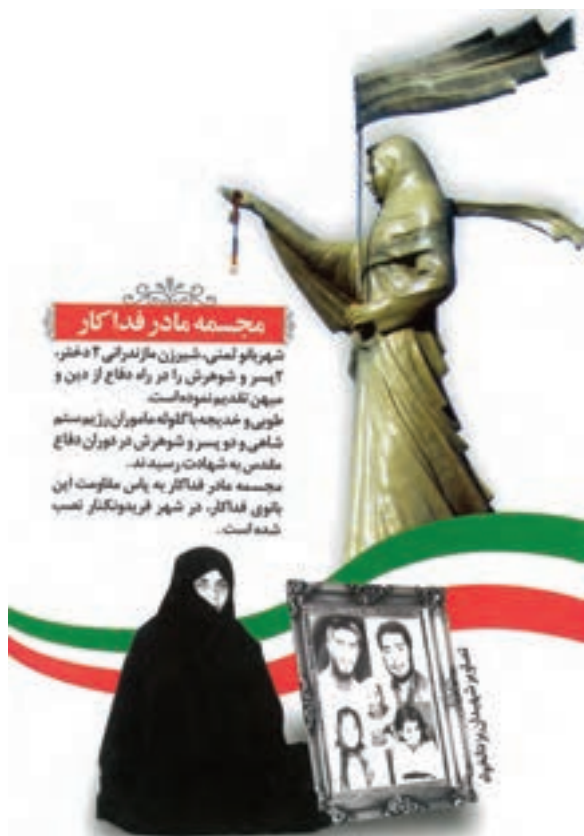
شکل ۸-۴- تندیس مادر فداکار، پنج شهیدزادان خواه

مدت کمی پس از پیروزی انقلاب اسلامی گروه‌های جدایی طلب و ضد انقلاب با هدف جدایی قسمتی از خاک ایران و براندازی انقلاب نوپا دست به قیام مسلحانه زدند. مردم استان مازندران از ابتدای تحركات ضدانقلاب به دو شکل به دفاع از کشور و انقلاب برخاستند :