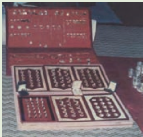
شکل ۱۱-۴- بخشی از زیور آلات اهدایی مردم مازندران به جبهه

- احداث جاده‌ها، پل‌ها، خاکریزها، سنگرها، حفر کانال‌ها و تثبیت خطوط عملیاتی در مناطق جنگی توسط