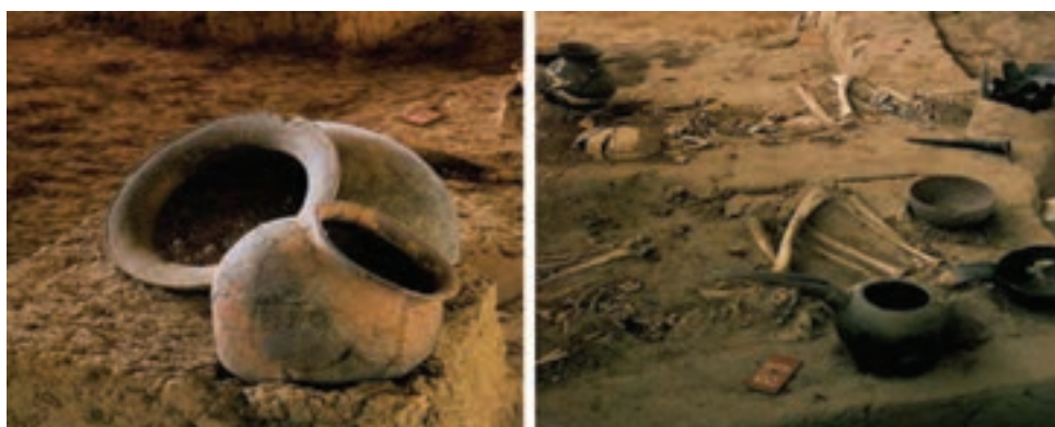
شکل ۱-۴ نمونه هایی از آثار به دست آمده در گوهر تپه

در سراسر جلگه های مازندران تپه های باستانی وجود دارند که برخی از آنها با نام های عمومی و محلی «دین» شناخته می شوند. برخی از آنها توسط باستان شناسان مورد کاوش قرار گرفته اند. یکی از این تپه های معروف «گوهر تپه»، در شهرستان بهشهر است. در حفاری های گوهر تپه شواهدی از ساختارهای معماری با دیوارهای خشتی و سنگی، تدفین مردگان به شکل ساده و قرار دادن اشیاء در کنار آنها، سفال، پیکرک انسانی و حیوانی، صنایع سنگی از جمله مهر و اشیایی از جنس مفرغ و آهن از جمله خنجر، لوازم آرایشی و دوک نخ ریزی به دست آمده است.