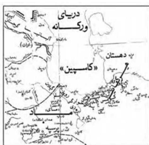
شکل ۲-۴ مازندران در دوره ساسانیان