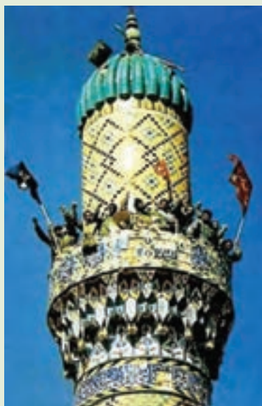
شکل ۹-۴- سلحشوران مازندرانی بر فراز مسجد شهر فاو

تیم ده نفره کربلا در خرمشهر، بعدها به گروهان و در عملیات ثامن الائمه به دو گردان و در عملیات طریق القدس به تیپ ۲۵ کربلا و پس از عملیات محرم به لشکر ویژه ۲۵ کربلا ارتقا یافت و تنها لشکر ویژه سپاه بود. حضور فعال و چشمگیر در ۲۲ عملیات، به ویژه فتح حماسی و غرورآفرین فاو در عملیات والفجر ۸، شاهکار رزمندگان و شهدای این لشکر بود که موجب تعجب و تحسین کارشناسان نظامی دنیا قرار گرفت.