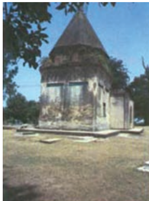
شکل ۴-۴- امامزاده زرین نوا- قائم شهر