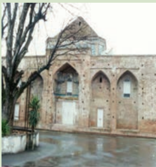
شکل ۴-۶- آرامگاه میرقوام الدین مرعشی - آمل

مرعشیان و حمله تیمور به مازندران : پس از فروپاشی ایلخانان مغول، قلمرو ایلخانان دچار آشفتگی شد و حکومت‌های محلی کوچک توسط سرداران مغول و خاندان‌های ایرانی تأسیس شد. یکی از این حکومت‌ها، حکومت سربداران خراسان بود که برای تصرف مازندران به این سرزمین لشکرکشی کردند ولی شکست سنگینی را متحمل شدند. این دوران پر آشوب و ناامن به اقتصاد مازندران به ویژه کشاورزی آسیب فراوان رساند. در این زمان که ستمگری شدت یافته بود مردم به سادات علوی روی آوردند و دو قیام در مازندران به رهبری سادات روی داد.