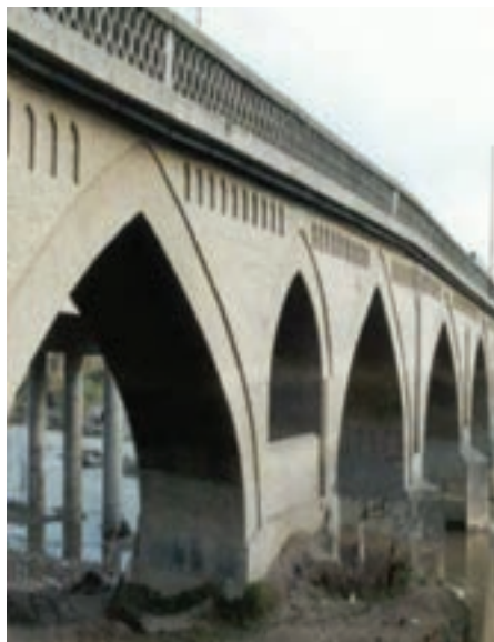
شکل ۷-۴- پل محمدحسن خان - بابل

در دوره قاجاریه، پس از انتخاب تهران به پایتختی ایران بر اهمیت مازندران افزوده شد. ناصرالدین شاه قاجار به مازندران سفر کرد و به آبادانی این منطقه همت گماشت. مازندران در دوره مشروطه نیز همانند شهرهای دیگر ایران دربرپایی مشروطه نقش داشت و عده‌ای به حمایت از مشروطه پرداختند. در این دوره انجمن‌هایی در سطح شهرها تأسیس شد از جمله انجمن سعادت و انجمن حقیقت در ساری که در توسعه مرام مشروطه و افکار جدید می‌کوشیدند.