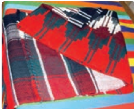
شکل ۳-۷- برخی صنایع دستی استان