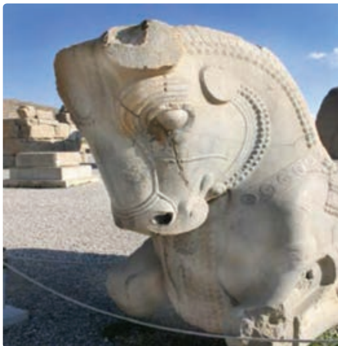
شکل ۵-۷- تخت جمشید

قدمت سکونت آریایی‌ها در این استان، حکومت‌های هخامنشیان و ساسانیان و بعد از آن حکومت‌های اسلامی، همگی آثار و بناهایی را از خود بر جای گذاشته‌اند که بازدید از آنها هدف بسیاری از گردشگران داخلی و خارجی است.