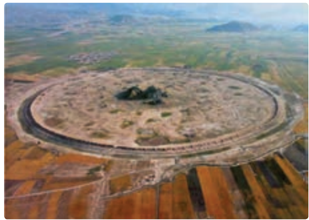
شکل ۱-۵- شهر دارابگرد - داراب

اگر قرار باشد که آثار تمدنی کشورها در یک مسابقه مشارکت داده شوند ارائه تخت جمشید از ایران کافی است که ما را در ردیف پنج کشور اول جهان قرار دهد. همچنین گسترش فرهنگ اسلامی در میان مردم فارس موجب خلق آثار تحسین‌برانگیزی از سوی مسلمانان ایرانی شد و همین آثار به سرزمین فارس اهمیت خاصی بخشیده است.