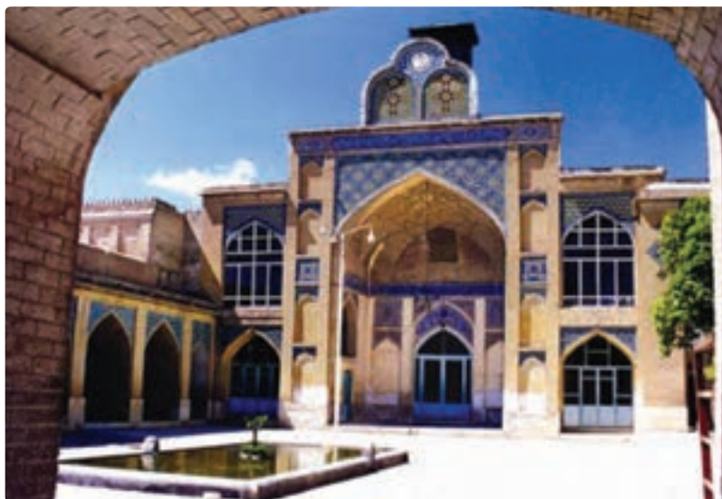
شکل ۸-۵- مسجد مشیر شیراز