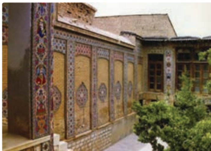
شکل ۱۳-۵- خانه ضیائیان شیراز

— جاذبه‌های تاریخی: همچون مجموعه‌های زندیه، مشیر و قوام در شیراز و فسا و داراب و خانه‌های قدیمی که به‌طور عمده از زمان قاجاریه در این استان به جای مانده‌اند و توسط سازمان میراث فرهنگی به ثبت رسیده‌اند و یا به موزه تبدیل شده‌اند؛ به عنوان نمونه، از خانه ضیائیان در محله سنگ سیاه و در مجاورت آرامگاه سیبویه می‌توان نام برد که مجموعه‌ای زیبا شامل پنجاه تصویر از بزرگان دینی و اجتماعی بر دیوارهای این خانه و بر روی کاشی‌های رنگی منقوش شده است.