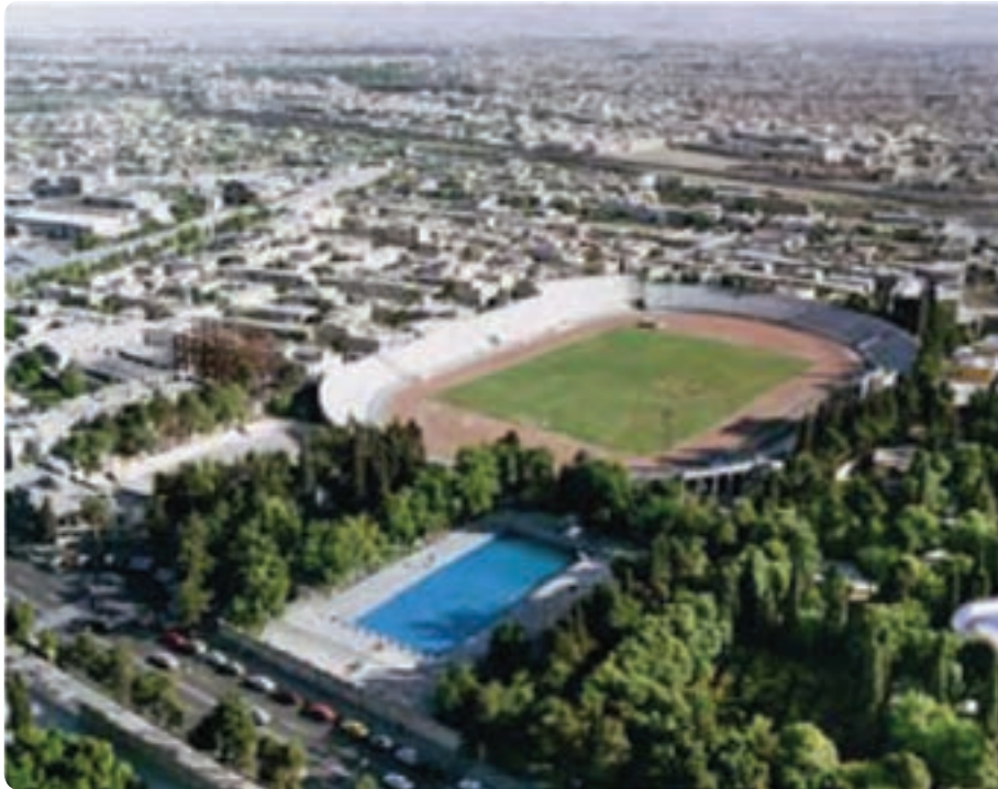
شکل ۲۴-۵- نمایی از استادیوم حافظیه - شیراز

تاکنون فعالیت‌های زیادی برای جذب گردشگر انجام گرفته است، اما برخی راه‌کارهای دیگر می‌تواند به رونق و توسعه این صنعت در استان بینجامد که عبارت‌اند از: