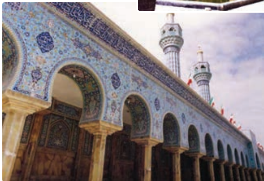
شکل ۹-۵- مسجد اعظم گراش