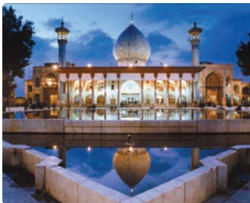
شکل ۴-۵- حرم متبرک حضرت احمد بن موسی (ع) معروف به شاهچراغ - شیراز

جالب است بدانیم که از این سه اصل، اولین و مهم‌ترین عنصر را گردشگری به حساب آورده‌اند. استان فارس در این زمینه توانمندی‌های زیادی دارد (با دو مورد دیگر در فصل‌های بعد آشنا می‌شوید).