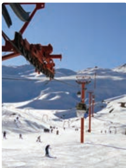
شکل ۱۸-۵- مجتمع پولاد کف