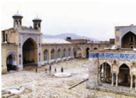
شکل ۲۱-۵- مسجد جامع عتیق - شیراز