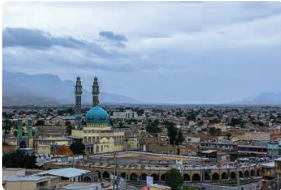
شکل ۵-۵- بازار و مسجد جامع لار

در کشور ما گام‌های نخست در توسعه این بخش برداشته شده است، به گونه‌ای که اکنون بیش از ۵۰ هزار نفر به‌طور مستقیم در زمینه گردشگری مشغول به کارند. از این تعداد در استان فارس در حال حاضر ۴۵۰۰ نفر در این صنعت شاغل‌اند. گردشگری و خودباوری: نهر، نخست‌وزیر هند در کتاب نگاهی به تاریخ جهان می‌نویسد: من هرگاه در برابر ایران و تمدن ایران قرار می‌گیرم، ناخودآگاه سر تعظیم فرود می‌آورم.