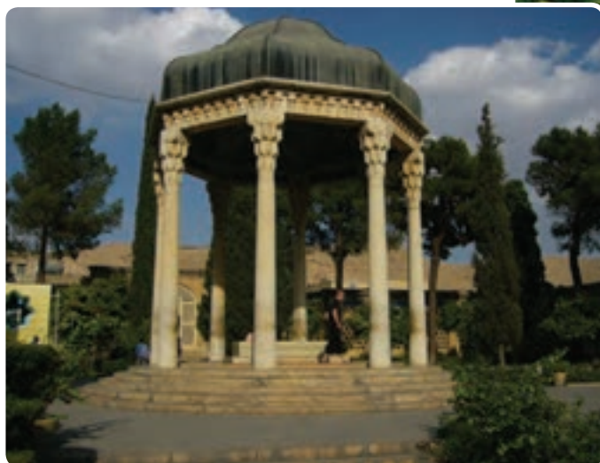
شکل ۱۶-۵- حافظیه - شیراز