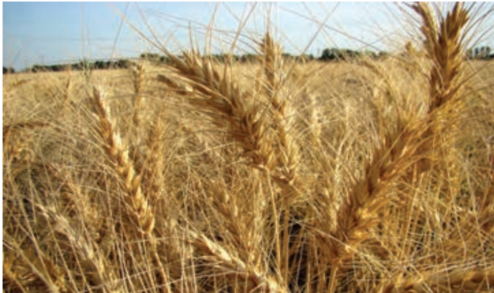
شکل ۲۵-۵ گندم، نماد کشاورزی در فارس