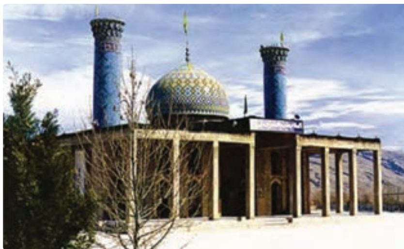
شکل ۱۴-۵- امامزاده شهید - فراشبند

— جاذبه‌های فرهنگی: سعدیه - حافظیه - سیبویه در شیراز و مقبره شیخ بیضاوی در سروستان.