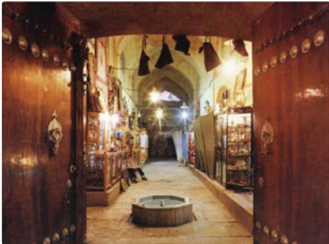
شکل ۱۲-۵- بازار مشیر - شیراز