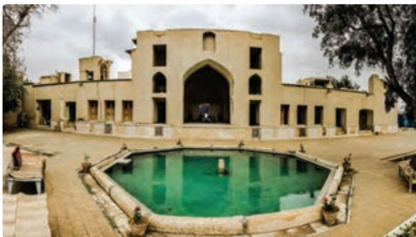
شکل ۱۹-۵- باغ نشاط لار