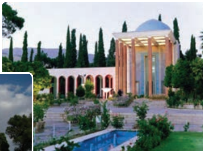
شکل ۱۵-۵- سعدیه - شیراز