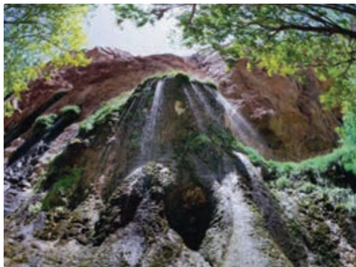
شکل ۱۱-۵- تنگ براق اقلید