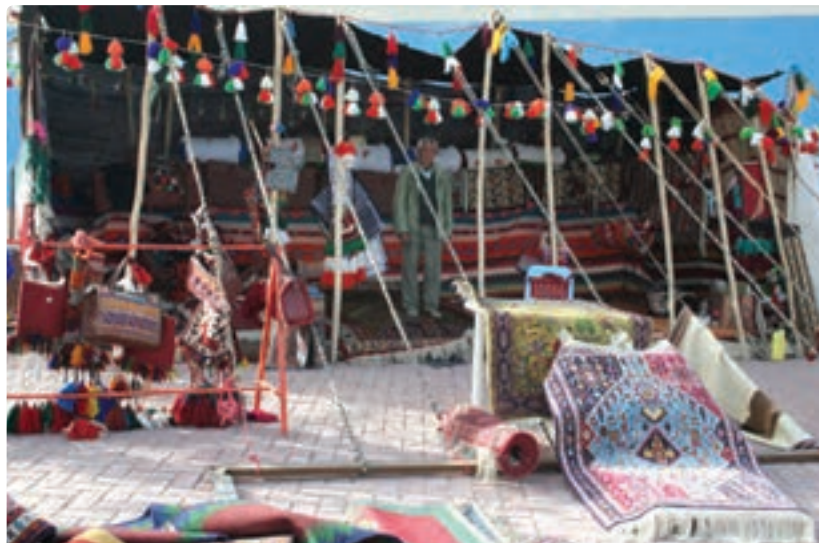
شکل ۱۷-۵- دست‌بافته‌های کوچ‌نشینان فارس