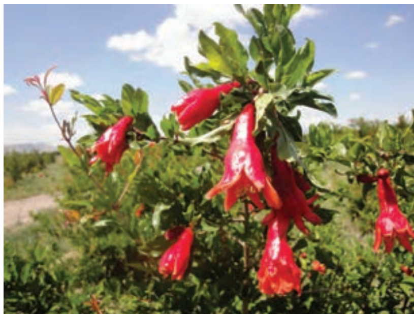
شکل ۲۴-۵- محصول انار در نیریز

بخش کشاورزی در این استان به گونه‌ای است که بعضی از فراورده‌ها جنبه صادراتی و ارزآوری به خود گرفته‌اند؛ همچون گندم و انار و مرکبات. تعدادی از محصولات کشاورزی استان در کشور، رتبه‌های اول تا سوم را به خود اختصاص داده‌اند، حتی تولید و صادرات انجیر فارس در جهان رتبه اول را به خود اختصاص داده است.