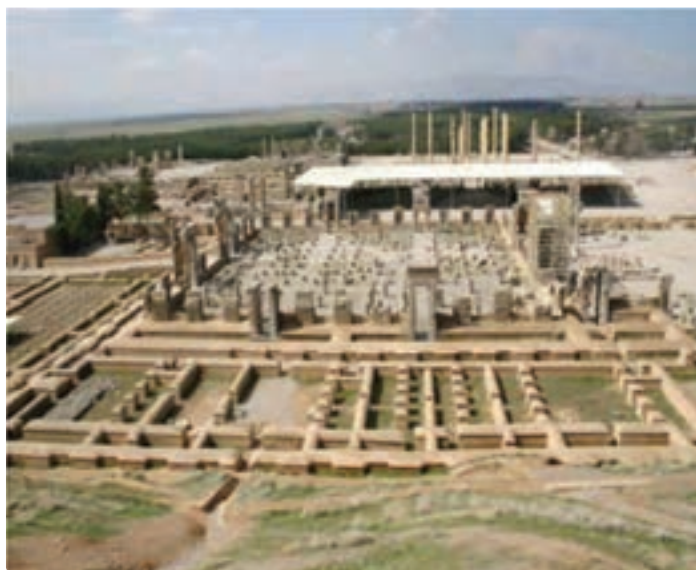
شکل ۵-۶- تخت جمشید مرودشت