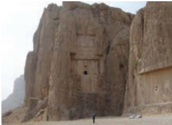
شکل ۲-۵- نقش رستم - مرودشت

در اهمیت پارسیان و تمدنی که بر جای گذاشته‌اند، می‌توان گفت اولین حکومت مقتدر و امپراطوری ایرانی را در این مرز و بوم بر جای گذاشتند که آوازه آن در فرهنگ جهانی خودنمایی می‌کند. این استان پیشینه‌ای هم‌پایه تاریخ ایران دارد و همواره یکی از مراکز شکل‌گیری و شکوفایی تمدن‌های کهن ایران زمین به‌شمار می‌رود.