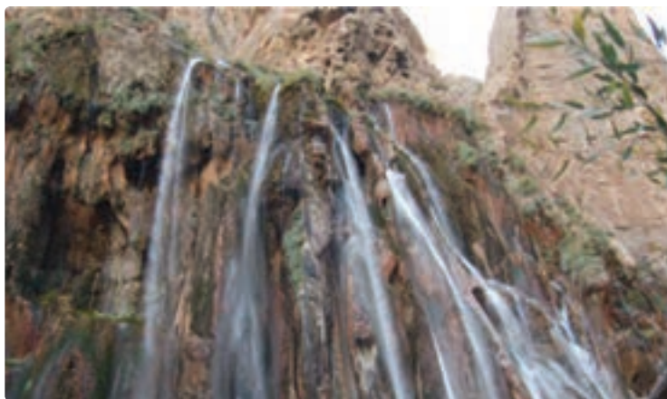
شکل ۱۰-۵- آبشار مارگون- سپیدان

توان‌ها و جاذبه‌های گردشگری در این استان را می‌توان به دو دسته کلی تقسیم کرد :