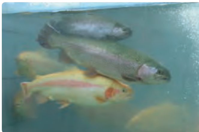
شکل ۲-۶- پرورش ماهی قزل‌آلا

تأمین می‌کند. این استان در بخش مربوط به فعالیت‌های صیادی و آبی‌پروری موقعیت منحصر به فردی دارد که با وجود رودها و آبگیرهای داخلی و دریا، مقدار تولید قابل افزایش است.