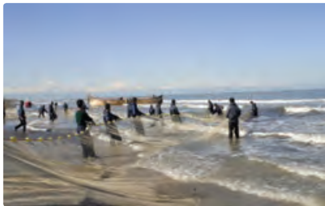
شکل ۳-۶- صید ماهی در دریای خزر