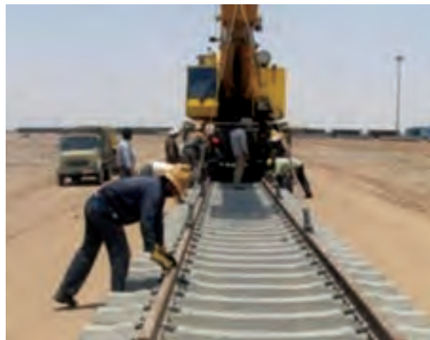
شکل ۱۵-۶- مراحل ساخت راه آهن قزوین - رشت - آستارا