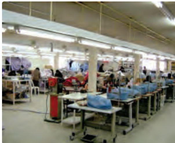
شکل ۱۳-۶- نمونه‌ای از صنایع استان

برای توسعه بازرگانی، رشد صنایع کارخانه‌ای، گردشگری و ... توسعه جاده تهران - قزوین - رشت به آستارا ضروری است. این محور ارتباطی در جابه‌جایی بار و مسافر و ارتباط با کشورهای خارجی و استان اردبیل نقش عمده‌ای دارد.