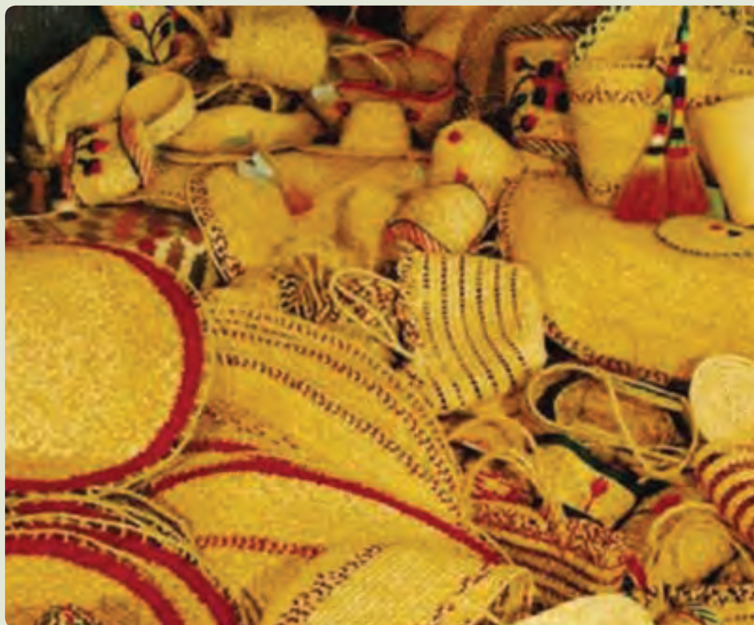
شکل ۵-۶- صنایع دستی