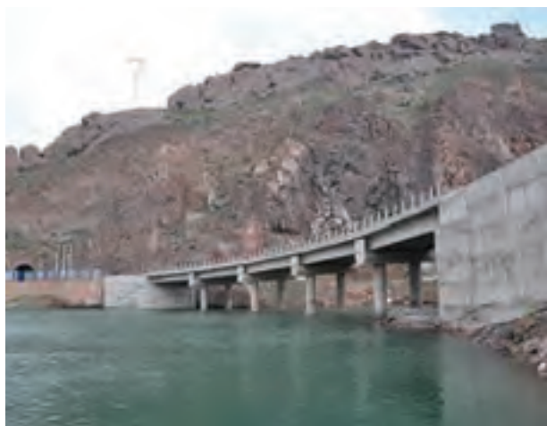
شکل ۱۶-۶- راه آهن قزوین - رشت - آستارا در حال احداث

برای توسعه بازرگانی، رشد صنایع کارخانه‌ای، گردشگری و ... توسعه جاده تهران - قزوین - رشت به آستارا ضروری است. این محور ارتباطی در جابه‌جایی بار و مسافر و ارتباط با کشورهای خارجی و استان اردبیل نقش عمده‌ای دارد.