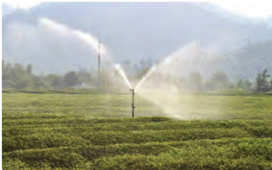
شکل ۱-۶- آبیاری مکانیزه

به دلیل رشد جمعیت و افزایش مصرف مواد غذایی ناشی از آن طی چند دهه گذشته، لازم است جهت افزایش محصولات کشاورزی مخصوصاً در استان‌هایی مانند گیلان برنامه‌ریزی‌هایی انجام شود.