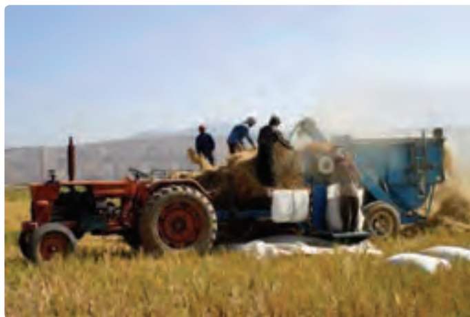
شکل ۱۱-۶- کشاورزی مکانیزه

— توسعه صنایع تبدیلی محصولات کشاورزی : تولید محصولات مختلف کشاورزی مثل زیتون، گیاهان دارویی، چوب، آبریان و ... در استان می‌تواند با توسعه صنایع تبدیلی به افزایش اشتغال، تأمین ارز، تأمین درآمد و سهم آن در افزایش تولید خالص ملی و برآورده کردن نیازهای مصرفی جمعیت کمک کند. — افزایش تولیدات گلخانه‌ای : کشت گلخانه‌ای در استان، زمینه را برای تولید بیش‌تر انواع مختلف محصولات کشاورزی فراهم می‌سازد و علاوه بر سوددهی بالا موجب می‌شود تا از این تولیدات در همه فصول سال استفاده کنیم.