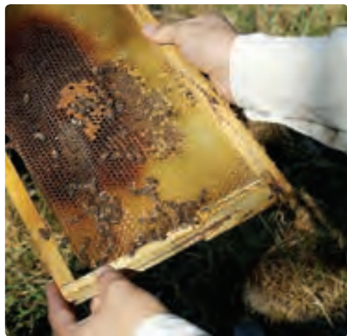
شکل ۱۰-۶- پرورش زنبور عسل

— یکپارچه‌سازی اراضی و مکانیزه کردن کشاورزی: سرانه زمین کشاورزی گیلان 1/13 هکتار است. وسعت کم زمین‌های کشاورزی و کوچک کردن هریک از قطعه‌ها باعث می‌شود تا سرمایه‌گذاری‌ها و مکانیزه کردن کشاورزی مقرون به صرفه نباشد و بازدهی تولید پایین بیاید.