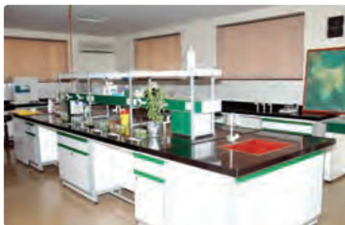
شکل ۱۲-۶- روش‌های جدید بیوتکنولوژی

افزایش بازدهی آبیاری و ازدیاد نرخ بهره‌وری از منابع آب : با استفاده بهینه از منابع آب و با بالابردن بازدهی آبیاری می‌توان کشاورزی استان را توسعه داد. در این زمینه، لازم است بین ارگان‌های مختلف برای استفاده صحیح و معقول از آب هماهنگی‌هایی صورت گیرد. ایجاد تأسیسات کوچک مهار آب‌های سطحی و بهره‌برداری بیشتر از آب‌های زیرزمینی به همراه استفاده از روش‌های جدید آبیاری، می‌تواند در افزایش تولید باغ‌های چای، زیتون، توت و کشتزارهای برنج مؤثر باشد.