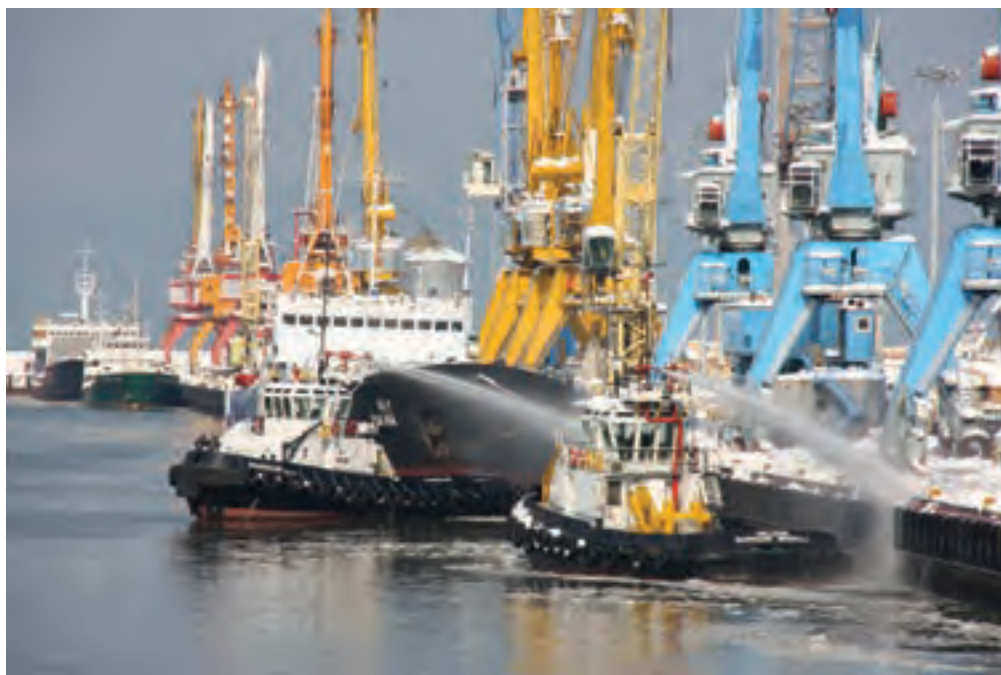
شکل ۶-۷- حمل و نقل دریایی

بعد از سال ۱۳۵۷، ظرفیت بارگیری و تخلیه بار بندر انزلی افزایش یافت و چهار پست اسکله و دو باب انبار سرپوشیده به این تأسیسات اضافه شد. طول موج شکن غربی افزایش یافت و بخشی از کانال به منظور دسترسی به محوطه مورد نیاز احیا شد.