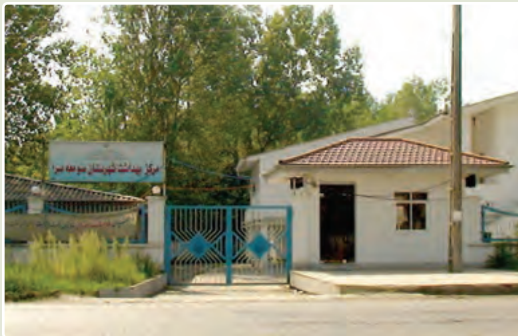
شکل ۸-۶- مرکز بهداشت

۴- حمایت از هویت و فرهنگ اسلامی : تعداد کتابخانه‌های عمومی قبل از انقلاب در استان ۲۵ باب بود که در سال ۱۳۸۶ به ۵۹ باب رسیده است. در این مدت، تعداد اعضا و مراجعان به کتابخانه نیز افزایش محسوسی داشته است. تعداد کل موزه‌های تحت نظارت اداره فرهنگ و هنر قبل و بعد از انقلاب یک باب است. همچنین، در دوران انقلاب اسلامی یک موزه در بندر انزلی و تحت نظارت نیروی دریایی ایجاد شده است. گردشگران خارجی استفاده‌کننده از هتل‌های استان به ۸۰۸۴ نفر در سال ۱۳۸۵ رسیده و در سال‌های اخیر، از نظر تأسیسات گردشگری نیز رشد قابل توجهی صورت گرفته است؛ به گونه‌ای که تعداد اتاق‌های تأسیسات اقامتی از ۱۱۱۳ اتاق در سال ۸۰ به ۱۷۰۳ اتاق در سال ۸۵ رسیده است. قبل از انقلاب اسلامی، تعداد نشریات محلی اعم از هفته‌نامه، ماهنامه، فصل‌نامه و سالنامه تنها ۵ عنوان بود که در سال ۱۳۷۳ به ۱۵ عنوان و در سال ۱۳۸۶ به ۸۷ عنوان رسیده و تعداد تأسیسات و مکان‌های ورزشی نیز از ۲۳ مکان در سال ۱۳۵۷ به ۱۷۴ مکان در سال ۱۳۸۶ رسیده است.