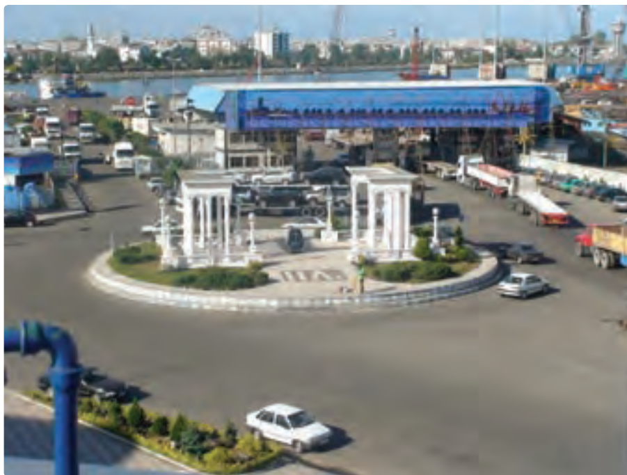
شکل ۴-۶- بندر انزلی - میدان توحید