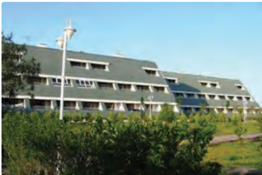
شکل ۶-۶- هتل سفید کنار

۳- وضعیت خدمات و بازرگانی: در طی سه دهه اخیر در استان، بخش خدمات بسیار پیشرفت کرده است. در تمامی سال‌های مورد بررسی، شمار شاغلان آن به طور مطلق و نسبی افزایش یافته است. آهنگ افزایش در سال‌های ۸۵-۱۳۷۵ به شدت رشد داشته و سهم شاغلان این بخش از ۳۹/۱ درصد به ۵۰/۱ درصد افزایش یافته است. در این دوره به طور متوسط، سالانه ۱۳۳۴ شغل در این بخش ایجاد شده است.