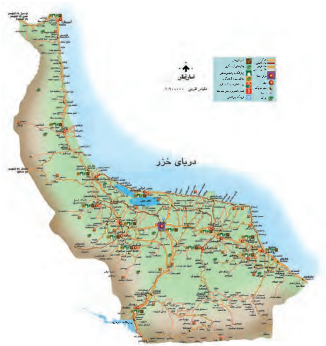
شکل ۱۸-۶ نقشه گردشگری استان