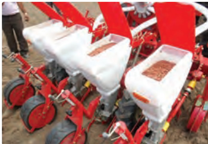
شکل ۹-۶- کاشت مکانیزه بادام زمینی (آستانه اشرفیه)