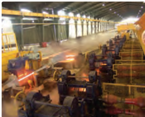
شکل ۱۴-۶- نمونه‌ای از صنایع استان