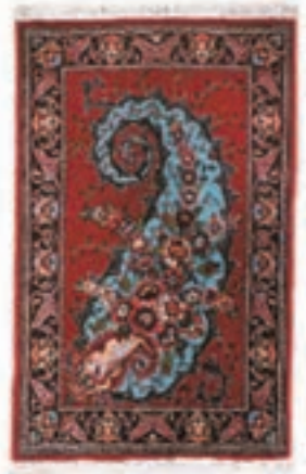
نام طرح: فرش افشار نام نقشه: بته چقه ابعاد: ۳×۴ ۳×۳ بافت: شاهین دژ و بوکان