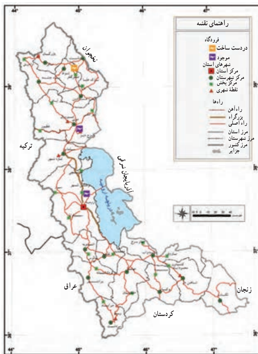
شکل ۶۷-۵- نقشه پراکندگی راه‌های مهم استان