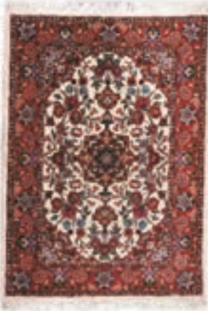
نام طرح: فرش افشار نام نقشه: شکارگاه ابعاد: ۲.۵×۳.۵ ۲×۳ ۱.۷×۴۰ بافت: تکاب