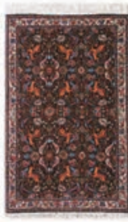
نام طرح: فرش افشار نام نقشه: شکارگاه ابعاد: ۲.۵×۳.۵ ۲×۳ ۱.۷×۴۰ بافت: تکاب