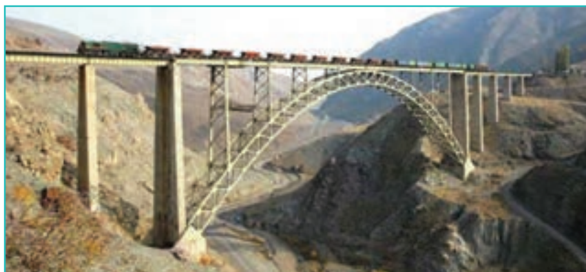
شکل ۶۶-۵- پل هوایی قطور- خوی