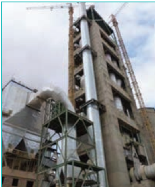
شکل ۵۳-۵- کارخانه سیمان

صنایع تولید مواد غذایی و آشامیدنی پس از صنایع فرآوری و تبدیلی معدنی دومین تخصص صنعتی استان در سال ۱۳۸۵ بود و ۲۱/۶ درصد از کل صنایع استان را شامل می‌شد.