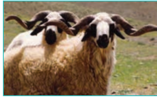
شکل ۴۹-۵- پرورش دام