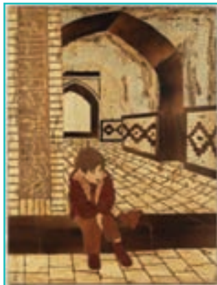
شکل ۶۳-۵- معرق چوب

۴- معرق چوب: این هنر ۴۰ سال پیش به شهرستان ارومیه راه پیدا کرد و با منبت تلفیق شد و رشته جدیدی به نام معرق - منبت یا معرق برجسته بوجود آمد.