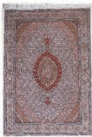
نام طرح: ماهی نام نقشه: شکارگاه ابعاد: ۶×۴ ۲.۵×۵ ۲.۵×۳.۵ ۲×۳ ۱×۱.۵ ۱.۵×۲ بافت: ارومیه - خوی - سلماس - ماکو - چالدران - پلدشت