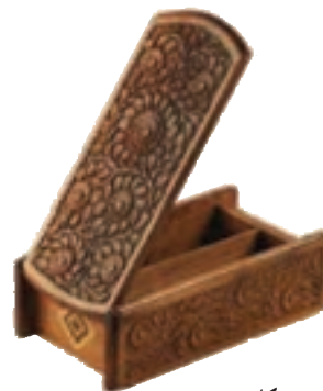
شکل ۶۱-۵- ریزه‌کاری

۲- ریزه‌کاری: هنری بسیار ظریف، زیبا و کاربر است. در این هنر چوب‌هایی بر اساس طرح و نقش از قبل آماده می‌شود و بر قسمت خالی شده چوب روکش می‌شود. ارومیه مرکز اصلی این هنر است. عمده‌ترین تولیدات این صنعت رحل قرآن، جعبه جواهرات، جعبه دستمال کاغذی، قاب عکس، صفحه شطرنج و... است.