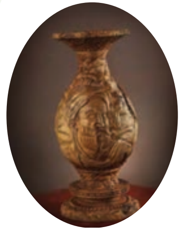
شکل ۶۰-۵- منبت‌کاری