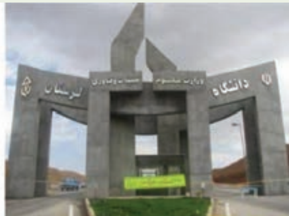
شکل ۱۶-۱۴- مراکز آموزشی استان

همان‌طور که انقلاب اسلامی در زمینه‌های مختلف در جهت توسعه و رونق استان لرستان دستاوردهای مهم و چشمگیری داشته است، در زمینه علمی – آموزشی نیز اقدامات زیادی انجام شده است که می‌توان به افزایش سطح پوشش تحصیلی در کلیه دوره‌های ابتدایی تا پایان دوره متوسطه، توسعه دانشگاه‌ها و مراکز آموزش عالی، گسترش رشته‌های مختلف برای ادامه تحصیل در سطوح مختلف دانشگاهی از کاردانی تا دکتری اشاره کرد.