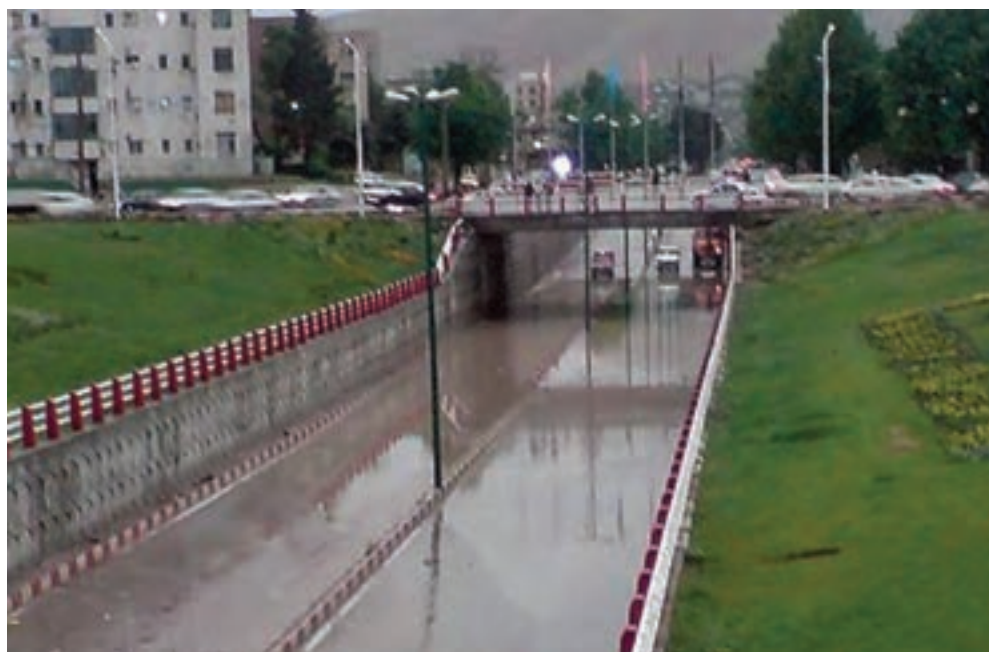
شکل ۱۰-۱۴- یکی از زیرگذرهای شهر خرم آباد

۳- حمل و نقل: استان لرستان به دلیل واقع شدن در مسیر راه های اصلی کشور و همجواری با استان های مرزی و صنعتی به عنوان پل ارتباطی، میان شمال و جنوب کشور از موقعیت خاصی برخوردار است. از مهم ترین طرح های عمرانی در سال ۱۳۸۹ می توان به افتتاح آزاد راه خرم آباد - پل زال و چهارخطه کردن محورهای اصلی استان اشاره کرد. همچنین، آغاز عملیات پروژه های مهم آزاد راه خرم آباد - اراک، احداث خطوط ریلی دورود - بروجرد - غرب کشور و شبکه ریلی دورود - خرم آباد - اندیمشک و