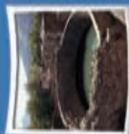
۶- گرداب سنگی