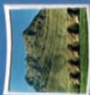
۱- بل شکسته