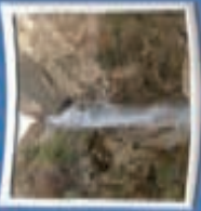
۱۲- آبشار نوزبان