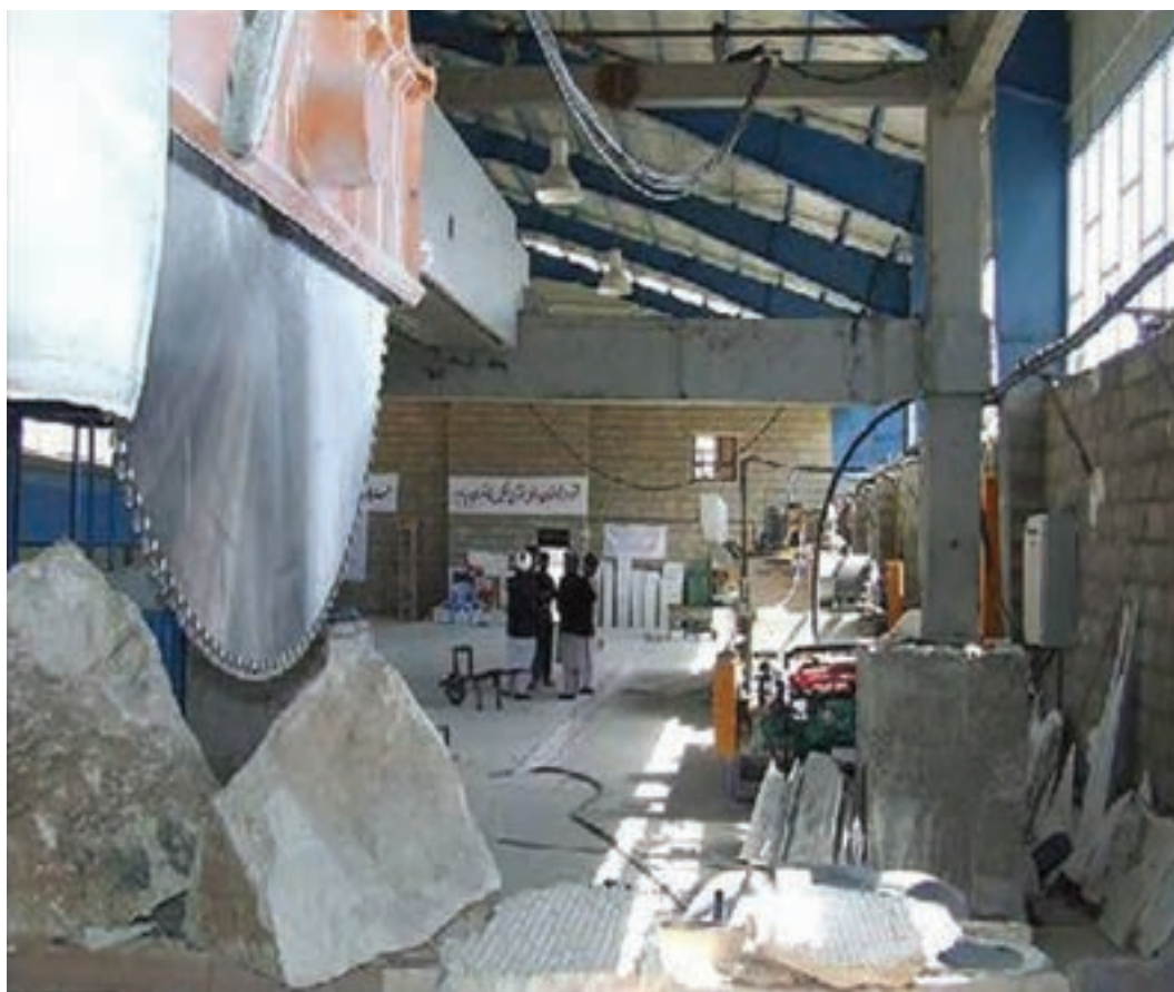
شکل ۷-۱۴- کارخانه سنگبری