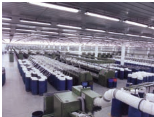
شکل ۴-۱۴- کارخانه نساجی بروجرد