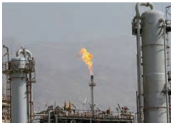
شکل ۲۰-۱۴ - نمایی از صنایع استان