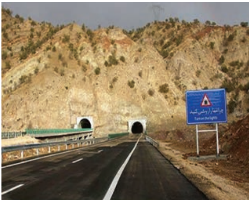
شکل ۱۲-۱۴- آزادراه خرم‌آباد - پل زال