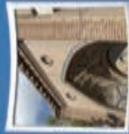
۷- مسجد جامع بروجرد