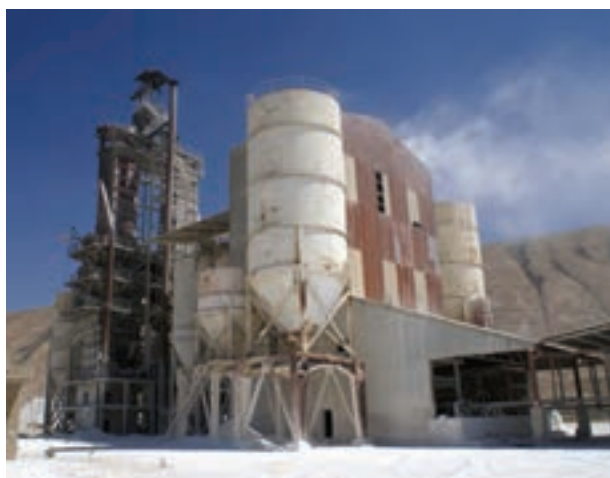
شکل ۳-۱۴- کارخانه آهک هیدراته پلدختر