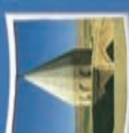
۳- امام زاده قاسم