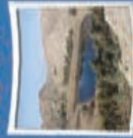
۱۰- کوری بلمک