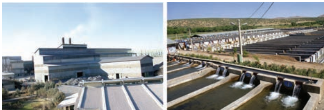
شکل ۲-۱۵- نمایشی از فعالیت‌های اقتصادی در استان