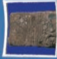
۸- سنگ نوبت