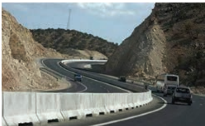
شکل ۲۱-۱۴ - آزادراه