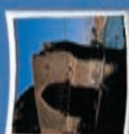
۴- بل دختر