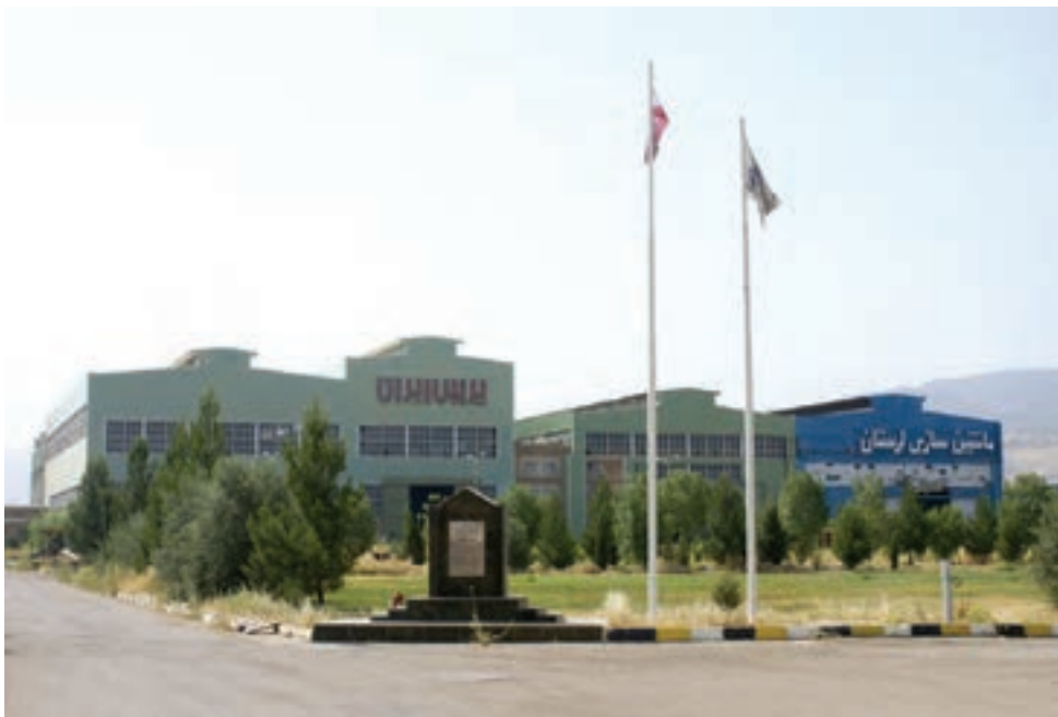
شکل ۱-۱۴- کارخانه پرسی لرستان

استان لرستان از زمینه‌های مناسب توسعه صنعتی به‌ویژه در صنایع معدنی، کانی غیرفلزی، صنایع غذایی و نساجی برخوردار است. با وجود این مزایا، سهم استان از صنایع مادر تخصصی و پیشرفته ناچیز است. استان ما توسعه صنعتی را با اولویت به حفظ صنایع موجود و سرمایه‌گذاری در صنایع تبدیلی کشاورزی، کانی غیرفلزی، صنایع پایین دست پتروشیمی و دارویی انتخاب کرده است. پس از انقلاب شکوهمند اسلامی ۱۵۱۱ پروانه بهره‌برداری در بخش صنعت و معدن صادر شد که در این جهت، چهارده شهرک صنعتی، هفت شهرک فعال، چهار ناحیه صنعتی فعال و تعدادی شکل صنعتی و صنفی تشکیل شده است.