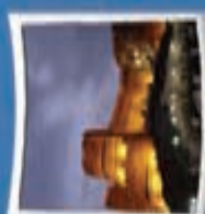
۵- فلک الاقوی