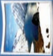
۱۱- دریاچه کور