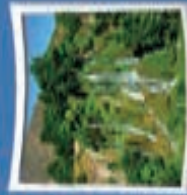
۹- آبشار بک