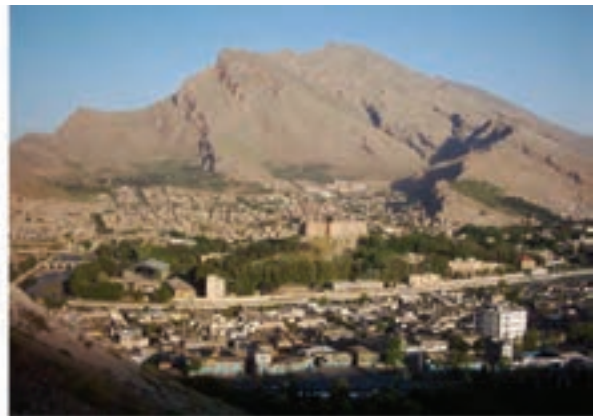
شکل ۱-۱۵- نمایی از چشم‌اندازهای شهرهای استان