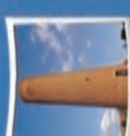
۲- منار آجری