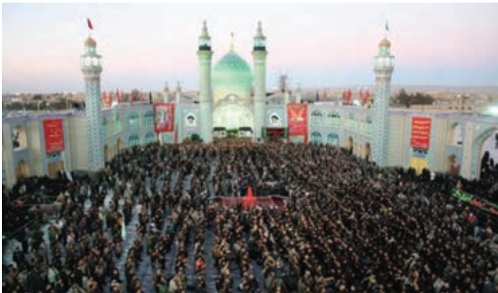
شکل ۳-۵- مراسم سوگواری حضرت امام حسین (ع) - آران و بیدگل

الف) تعزیه و روضه‌خوانی: از مهم‌ترین انواع ارتباطات سنتی و هنرهای نمایشی است که در آن، ترکیبی از هنرها، آداب و عناصر مختلف به کار گرفته می‌شود. تعزیه در لغت به معنای «سوگواری و یاد بود عزیزان در گذشته» است و در اصطلاح، به نوعی نمایش مذهبی و آداب و رسوم خاص اطلاق می‌شود که متناسب با شرایط خاص تاریخی، یادآور ظلم و جور حکام وقت، یادآور ستمکاری‌ها به امام حسین (ع) و یاران اوست. مضمون تعزیه، رویارویی دو نیروی خوب و بد، نور و ظلمت است. در تمام روستاها و شهرهای استان اصفهان، تعزیه به مناسبت‌های مختلف انجام می‌گیرد. در همه جای استان اصفهان به ویژه دههٔ محرم، این مراسم با شور و علاقهٔ وافری اجرا می‌شود؛ برای نمونه می‌توان از مراسم نخل‌گردانی و تعزیهٔ روستای ایبانه، و انواع دیگر نمایش‌های شهر نیاسر، بادرود، خوانسار، خمینی‌شهر و خوراسگان نام برد.