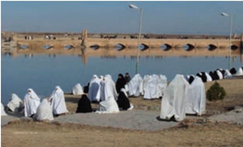
شکل ۷-۵- پوشش زنان و رزنه

چادر سفید و رزنه: پوشیدن چادر سفید، مشخصه منحصر به فرد شهر و رزنه است. گفته می‌شود که پوشیدن چادر و لباس سفید در این منطقه، دلایل تاریخی و جغرافیایی دارد: اغلب زنان و دختران این شهر به شیوه نیاکان خود، از چادر سفید استفاده می‌کنند. شرایط آب و هوایی منطقه، شغل کرباس‌بافی، کشت و کار پنبه و در دسترس نبودن پارچه‌های شهری در گذشته، از عوامل مؤثر در وجود این سنت است.