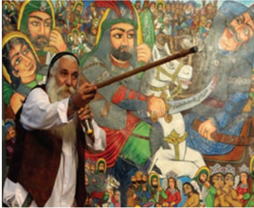
شکل ۴-۵- برده‌خوانی

پهلوانی و حماسی»، «نقالی مذهبی» و «نقالی تفریحی» می‌توان تقسیم کرد. از مهم‌ترین آن‌ها، نقالی پهلوانی و حماسی، شاهنامه‌خوانی و قصه‌خوانی است که در آن داستان‌های منظوم شاهنامه فردوسی با صدای رسا و گرم، همراه با حالات و حرکات مختلف چهره و دست برای تماشاگران نقل می‌شود.