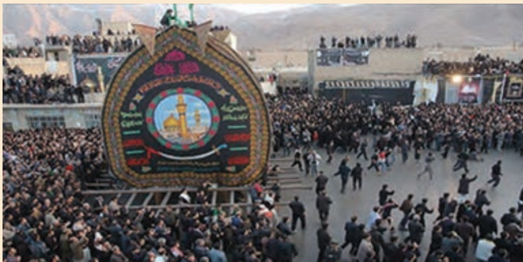
شکل ۸-۵- مراسم نخل‌گردانی

در این قسمت به برخی از مراسم مذهبی - ملی در سطح استان اشاره می‌شود. الف) مراسم نخل‌بندان (نخل‌گردانی) ۱ : مردم در تمام استان اصفهان برای مراسم مذهبی به ویژه «عاشورا» اهمیت ویژه‌ای قائل‌اند و از اول محرم، یکپارچه سیاهپوش می‌شوند. مراسم عزاداری به صورت هیئت‌های زنجیرزنی، سینه‌زنی و روضه خوانی برپا می‌شود و در روز «عاشورا» به اوج خود می‌رسد. نخل همراه با دسته‌های زنجیرزن، در شهر و روستا و در مکان‌های متبرک و امامزاده‌ها به گردش درمی‌آید؛ برای مثال در «خور و توابع آن» در روز ششم محرم، دو عَلم زینت داده می‌شود که با پارچه‌های رنگی و دستمال ابریشمی سیاه یزدی آراسته می‌شود و روزهای بعد نیز در مواردی، پوشش عَلم‌ها را تغییر می‌دهند.