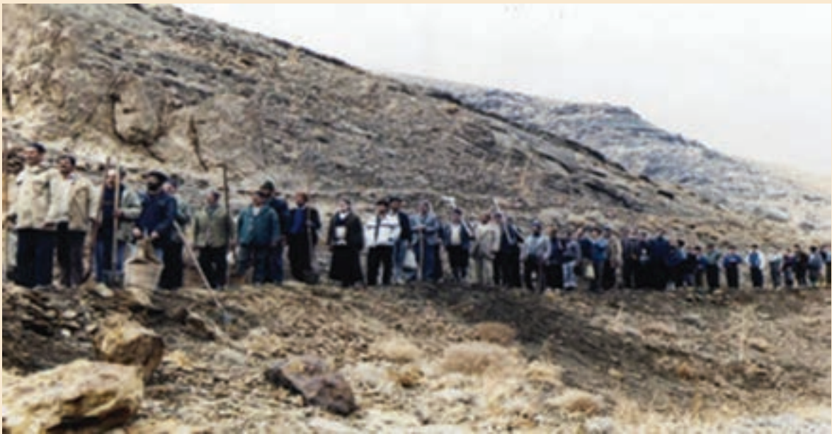
شکل ۱۲-۵- لایروبی جوی‌های آب نمونه‌ای از همکاری اهالی با یکدیگر - سمیرم

هرچند با مکانیزه شدن کشاورزی و صنعتی‌تر شدن جامعه، این مراسم کمرنگ شده ولی همیاری و تعاون همچنان در فرهنگ ایرانی - اسلامی ما از اهمیت خاصی برخوردار است.