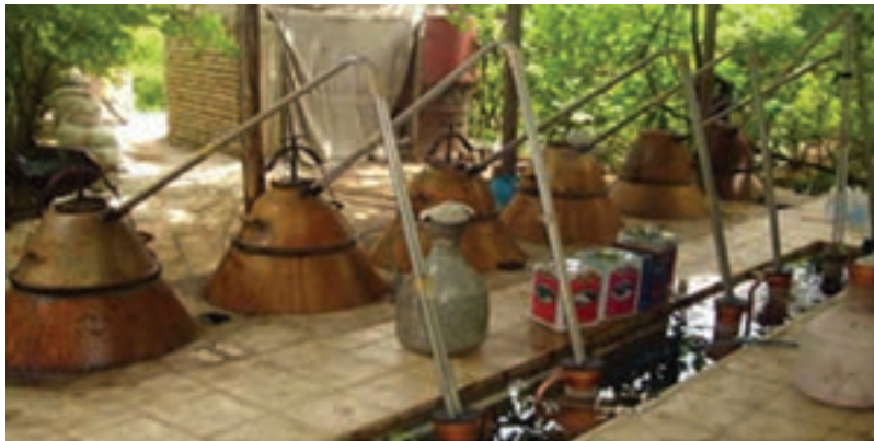
شکل ۱۰-۵- گلاب‌گیری (قمصر کاشان)

روز سیزده فروردین نیز مردم سبزه سفره هفت‌سین را از خانه بیرون می‌برند. این روز، روز بزرگداشت و احترام به طبیعت است و تا پایان روز، افراد خانواده و فامیل در کنار هم در دشت و سبزه‌زار ساعتی را می‌گذرانند. ج) مراسم گلاب‌گیری: گلاب‌گیری در قمصر، برزک، نیاسر، جوشقان و کاشان از قدمتی دیرینه برخوردار است که این، خود از رواج کاشت گل محمدی در این منطقه خیر می‌دهد و نسل به نسل از گذشتگان به فرزندان انتقال یافته است.