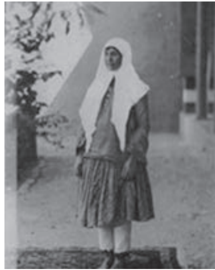
شکل ۵-۵- لباس زنان و مردان اصفهانی (۱۵۰ سال قبل)

از مهم‌ترین ویژگی‌های پوشش سنتی مردم، می‌توان با توجه به رعایت پوشش بدن، تولید محلی تن‌پوش‌ها، سادگی، زیبایی، رنگارنگی، رعایت پاکیزگی، تناسب با ویژگی‌های آب و هوایی منطقه، اشتغال تعداد زیادی از افراد به امر تهیه و تولید پوشش و تن‌پوش‌ها، تنوع آنها و ... اشاره کرد. در استان ما، پوشش و لباس از اهمیت زیادی برخوردار است ولی با گذشت زمان، پوشش سنتی کمتر به کار می‌رود.