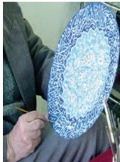
شکل ۱۴-۵- صنایع دستی و فرهنگ