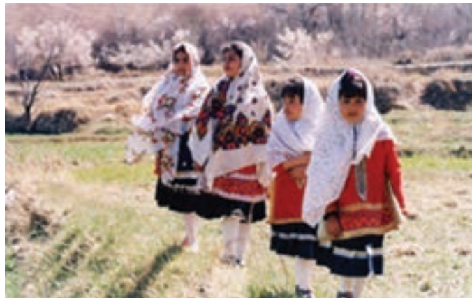
شکل ۵-۶- لباس سنتی مردم ایبانه

لباس سنتی مردم ایبانه ۱ : این نوع لباس بیانگر ویژگی‌های جغرافیایی، باورها، اعتقادات و ویژگی‌های فرهنگی مردم این قسمت از استان است که ریشه در اعماق تاریخ ایرانیان دارد و نشانگر سنت‌های زیبای ایران باستان است.