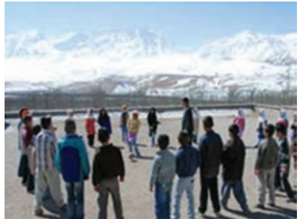
شکل ۲-۵- بازی‌های دسته‌جمعی