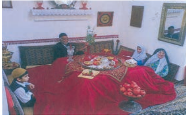
شکل ۱۳-۵- خانواده