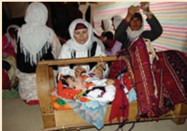
شکل ۱-۵- لالایی و انتقال فرهنگ

لالایی ها : لالایی ها، بخشی از ادبیات شفاهی سرزمین ماست که در کنار افسانه ها و قصه ها در گذشته کاربرد بسیار داشته است. لالایی، آوازی است که مادران برای خواباندن کودک شیرخواره می خوانند. لالایی نخستین ارتباط کلامی و رابطه همسخنی مادر با کودک است که برای هردو، این موسیقی آهنگین، موجب آرامش جسم و روح مادر و کودک می شود. در مناطق مختلف استان اصفهان، لالایی و دوبیتی های محلی، به طور خودجوش توسط زنان و مردان با ذوق در وزن های ساده سروده شده است.