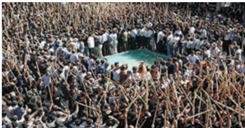
شکل ۱۱-۵- مراسم قالی‌شویی - مشهد اردهال

ج) مراسم قالی‌شویی «مشهد اردهال»: اردهال به علت شهادت حضرت سلطان علی، فرزند امام محمدباقر(ع)، در این محل به «مشهد اردهال» معروف شده است؛ به سبب حرمت تخته‌ای قالی که پیکر امامزاده علی را ابتدا روی آن قرار دادند و بعد به جای پیکر او غسل دادند، اصطلاح «مشهد قالی‌شویان» نیز مشهور است. در سیزدهم پاییز هر سال، نمایش آیینی قالی‌شویان که بیانگر اعتقاد خالصانه مردم منطقه به خاندان اهل بیت است، با شور و هیجان وصف‌ناشدنی انجام می‌گیرد.