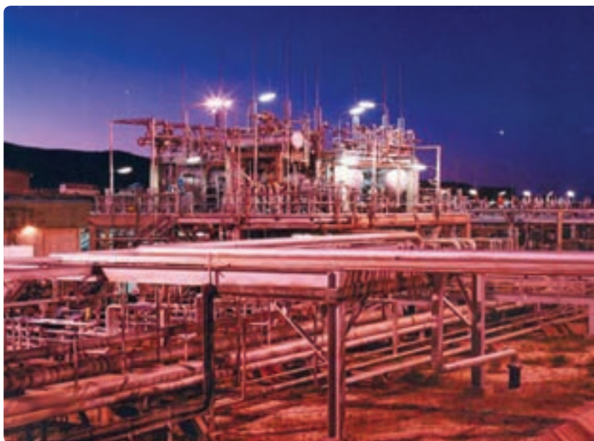
شکل ۱-۶- توسعه صنعتی