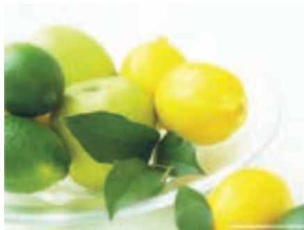
شکل ۱۷-۶- مرکبات (دوم)