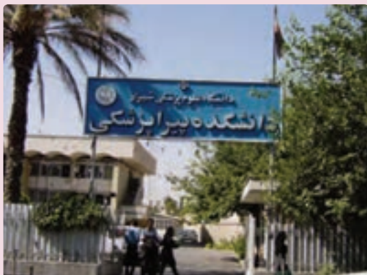
شکل ۳۶-۶ دانشگاه شیراز