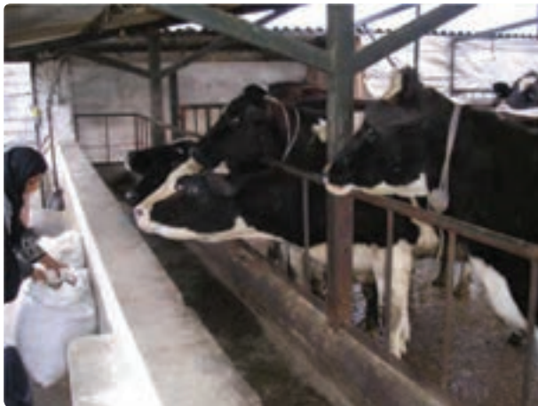
شکل ۲۰-۶- گاوداری صنعتی