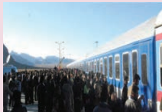
شکل ۴۲-۶- ایستگاه راه‌آهن