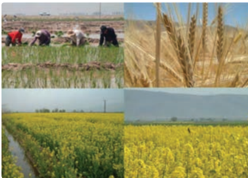
شکل ۲-۶- توسعه کشاورزی