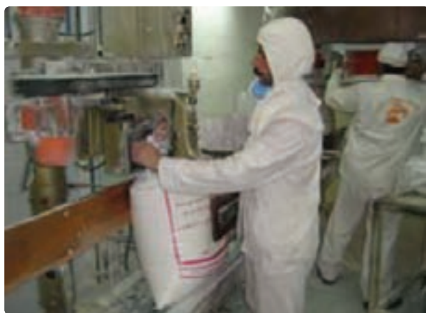
شکل ۳۴- صنایع غذایی بیضا