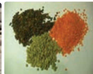
شکل ۱۲-۶- حبوبات آبی (اول)