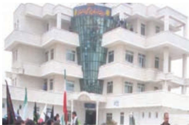
شکل ۲۷-۶- ساختمان فرودگاه لار

براساس آمارهای موجود طول شبکه راه‌های اصلی استان که در سال ۱۳۵۷ برابر ۱۲۲۱ کیلومتر بوده در سال ۱۳۸۶ به حدود ۲۲۲۹ کیلومتر افزایش یافته که ۵۶۹ کیلومتر آن بزرگراه است. تعداد فرودگاه‌های استان نیز که پیش از انقلاب اسلامی تنها به فرودگاه شیراز محدود می‌شد، امروز به شش فرودگاه فعال افزایش یافته است (آیا اسامی این فرودگاه‌ها را می‌دانید؟).