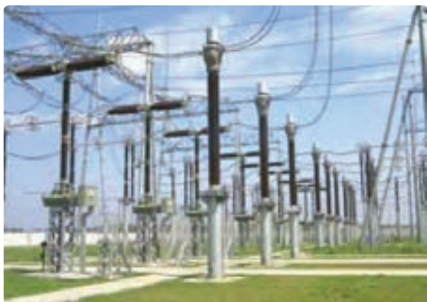
شکل ۳۰- صنایع الکترونیک