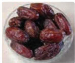
شکل ۱۵-۶- خرما (دوم)