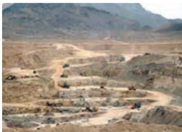
شکل ۳۱- کانی غیرفلزی