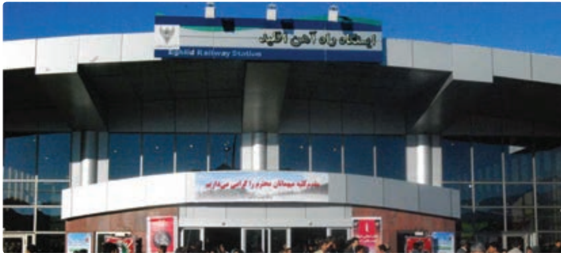
شکل ۲۸-۶- ایستگاه راه آهن اقلید

اگر بخواهیم پرافتخارترین طرح عمرانی استان فارس را در سال‌های اخیر نام ببریم، بی شک راه‌اندازی قطار شیراز - اصفهان است که کلیه مراحل مطالعه - برنامه‌ریزی و اجرای آن در زمان جمهوری اسلامی انجام شده است.