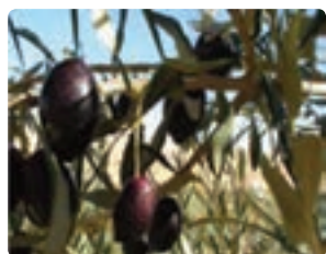
شکل ۱۱-۶- زیتون (اول)