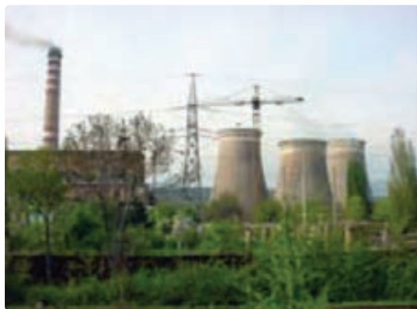
شکل ۳۳- سیکل ترکیبی