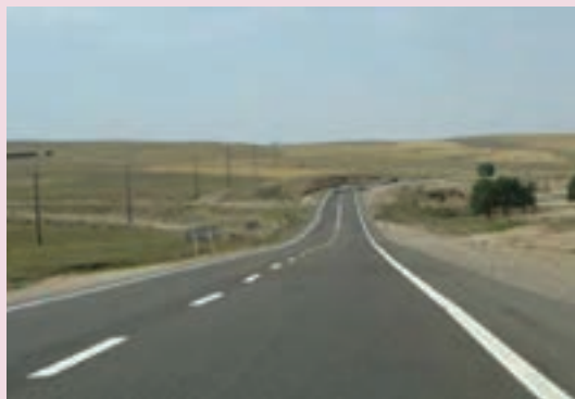
شکل ۴۳-۶- راه‌های بین شهری

در بخش انرژی کارهای بزرگی در استان فارس شروع شده که علاوه بر گسترش واحدهای تولیدی مجتمع پتروشیمی شیراز پالایشگاه گاز پارسیان که از آن به عنوان نقطه اتکا از کشور یاد می‌شود، کشف منابع جدید نیز در زمینه نفت در مناطق مختلف استان صورت گرفته است و امید می‌رود در زمینه صنعت نفت استان فارس قدم‌های بزرگی در آینده برداشته شود.