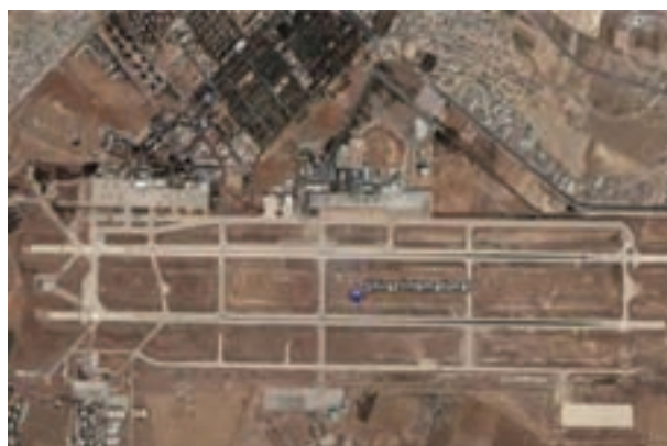
شکل ۲۶-۶- فرودگاه شیراز