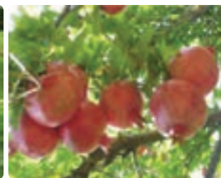
شکل ۴-۶- انار (اول)