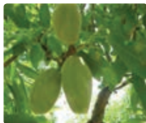
شکل ۷-۶- بادام (اول)