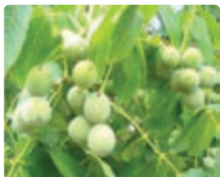
شکل ۱۴-۶- گردو (دوم)