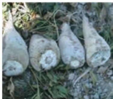
شکل ۱۸-۶- چغندر قند (سوم)