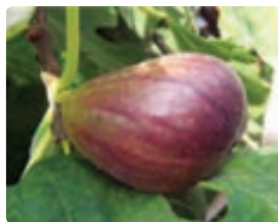
شکل ۶-۶- انجیر (اول)