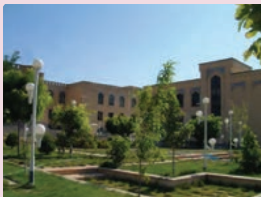
شکل ۳۵-۶ دانشگاه آزاد شیراز

علمی و آموزشی: یکی از ابعاد توسعه همه‌جانبه استان علاوه بر گسترش سوادآموزی، رشد فعالیت علمی و آموزشی در دانشگاه‌ها و توسعه مراکز آموزشی در مقاطع گوناگون تحصیلی در استان فارس بوده است. میزان باسوادی در استان فارس از ۴۹/۵ درصد سال ۱۳۵۵ به ۸۷ درصد در سال ۱۳۸۵ افزایش یافته که بیانگر تحول قابل ملاحظه‌ای در سوادآموزی است.