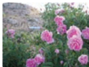
شکل ۱۰-۶- گل محمدی (اول)