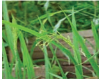
شکل ۱۶-۶- شلتوک (دوم)