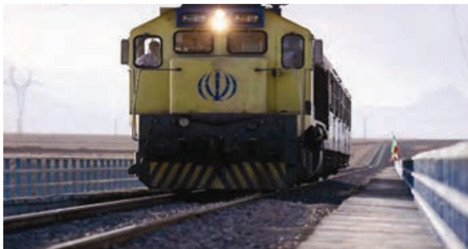
شکل ۳-۶- حمل و نقل و ارتباطات