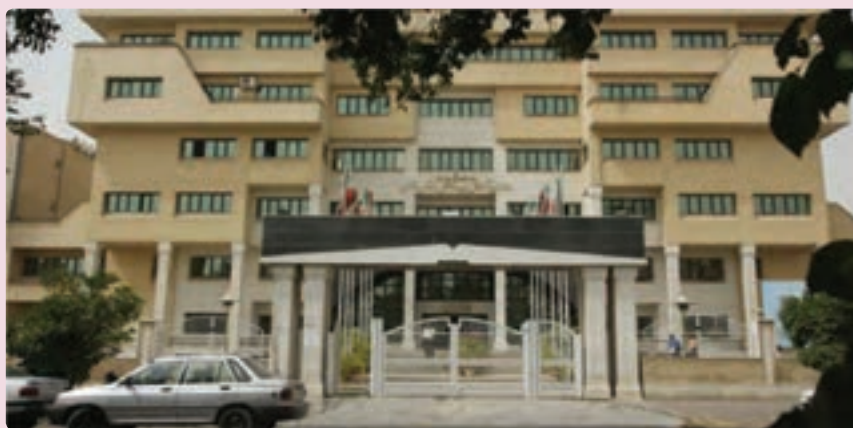
شکل ۳۷-۶ اداره کل آموزش و پرورش استان فارس

از نظر مراکز آموزش عالی نیز تعداد دانشجویان استان در سال ۱۳۵۷ تنها ۶۴۷۰ نفر بوده است که این تعداد در سال ۸۷-۱۳۸۶ به ۱۷۴,۰۰۰ دانشجوی دانشگاه دولتی و آزاد اسلامی افزایش یافته است. تأسیس دانشگاه صنعتی شیراز و تبدیل آن به دو بخش دانشگاه شیراز و دانشگاه علوم پزشکی، تأسیس دانشگاه دولتی در فسا، جهرم و ... تأسیس ۱۳ آموزشکده فنی در نقاط مختلف استان، تأسیس دانشگاه مجازی شیراز و تأسیس دوره دکتری در رشته‌های مختلف در دانشگاه شیراز، بخشی از اهداف علمی استان بوده است.