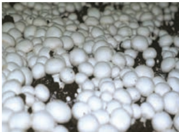
شکل ۲۹- صنایع غذایی بیضا