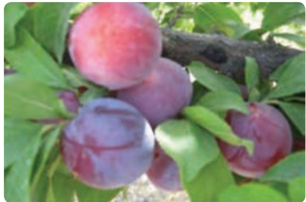
شکل ۴۰-۶- باغداری