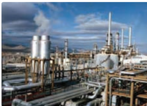
شکل ۳۲- پتروشیمی فارس