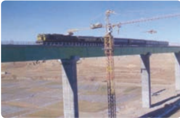
شکل ۴۱-۶- پل ایزدخواست