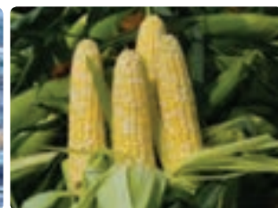
شکل ۸-۶- ذرت دانه‌ای (اول)