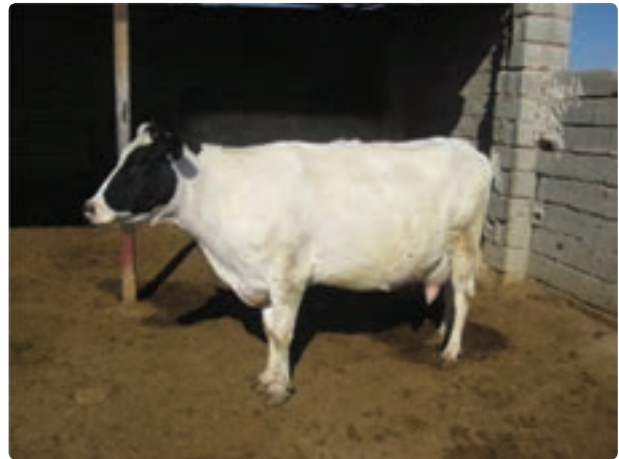
شکل ۱۹-۶- گاوداری صنعتی

علاوه بر فعالیتهای زراعی و باغی در زمینه دامپروری و تولیدات دامی و پرورش آبزیان و ماهیان پرورشی روستائیان و عشایر فارس توانسته‌اند سهم عمده‌ای از تولید گوشت قرمز و سفید کشور را به خود اختصاص دهند. جدول ۲-۶ بخشی از فعالیتهای دامپروری و تولیدات آن را در سال ۱۳۸۶ نشان می‌دهد.