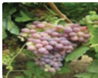
شکل ۵-۶- انگور دیم (اول)