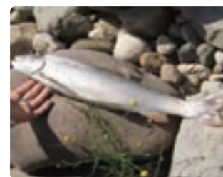
شکل ۱۳-۶- ماهی سرد آبی (اول)