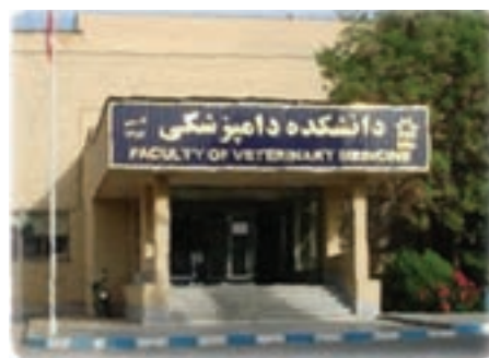
شکل ۷-۶- دانشگاه‌های ارومیه