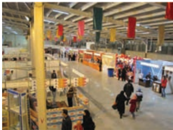
شکل ۲۱-۶- نمایشگاه فصلی فروش کالا در اراک

– محصولات تولیدی پتروشیمی، معدن، شمش، پروفیل آلومینیوم، سازه فلزی، تجهیزات نیروگاهی و پالایشگاهی، مخازن، دیگ بخار، جرثقیل، واگن قطار، ماشین آلات راهسازی، کمباین، ادوات کشاورزی، مصالح ساختمانی، لاستیک، سیمان، بلور، چینی، انواع رنگ، محصولات کشاورزی، دامداری و ... .