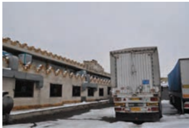
شکل ۲۰-۶- گمرک اراک