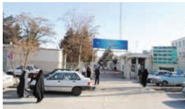
شکل ۱۰-۶- بیمارستان امام خمینی (ره) خمین