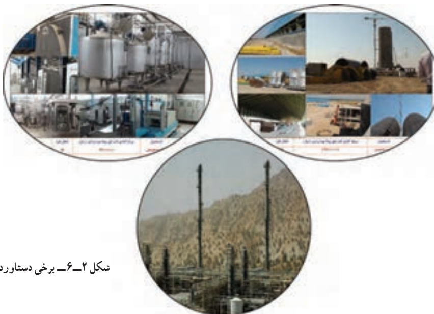
شکل ۲-۶- برخی دستاوردهای صنعتی استان