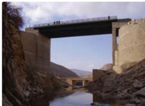
شکل ۳-۶- برخی دستاوردهای راه‌سازی استان